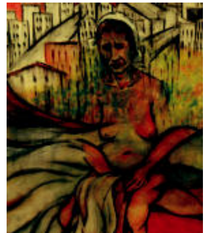
Akuarela erabiltzen du Agirrezabalek. S. GIRREZABALA