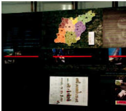
Gipuzkoako Hiri Hondakin Kudeaketa Plan Orokorra. Hemen, mankomunitate bakoitzari buruzko panela dago. Informazio horrekin batera, lurralde historikoaren mapa agertzen da, eta bertan, egungo azpiegituren banaketa. E. EZEIZA