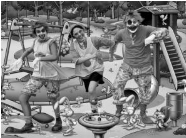
Pirritx, Mari Motots eta Porrotx izango dira ikuskizuneko protagonistak. HITZA

Etzi ikusi ahalko da eta dagoeneko sarrerak agortuta daude