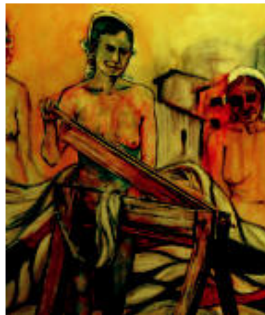
Emakumeak dira nagusi koadroetan. S. GIRREZABALA