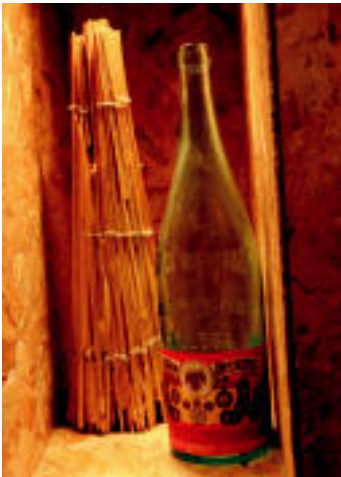
Beirazko botilak. Gipuzkoako herrietan, 1930. urte aldera hasi ziren gubxi gorabehera ura beirazko botiletan merkaturatzen eta saltzen. E. EZEIZA