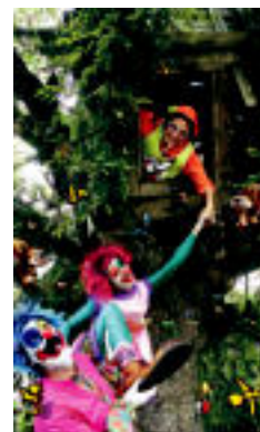
Pirritx, Porrotx eta Mari Motots. HITZA

Etzi ikusi ahalko da 'Mari Motots' Gurea aretoan eta sarrerak agortu dira dagoeneko ▶ 6