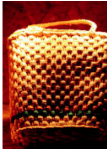
Plaztikozko poltsak. 1973an hasi ziren merkaturatzen. Ciclopastek ziurtatzen du Espainian erabili eta botatzeko 16.000 poltsa egin zirela 2005ean, %10a birziklatuz. E. EZEIZA