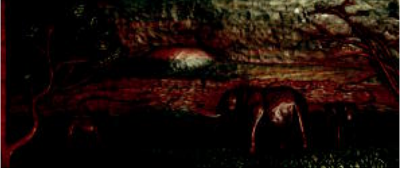
18/98 auziko eskualdeko inputatuei laguntzeko erosgai dauden artelanetako batzuk. I. GARCIA