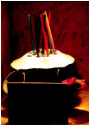
Birzizklaketa kanpaina. 1993an, Berzizklaketa, bai noski lelopean, Sasieta Mankomunitateak ingurumen-hezkuntzako lehen kanpaina sustatu zuen. E. EZEIZA