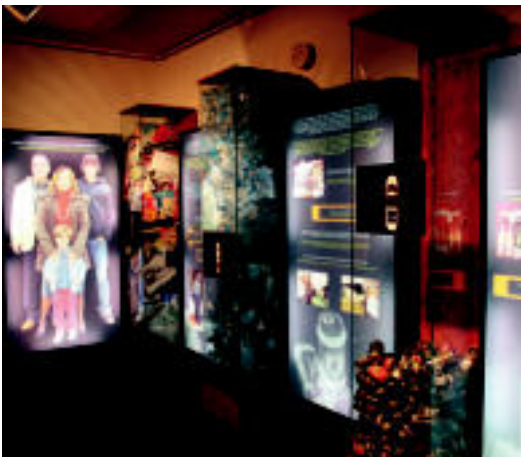
Etako hondakinak. Erakusketako bigarren atalean Ugarte familiak urtean sortzen dituen hondakin berri ematen du. Beirazko lau edukiontzitan, lau kideko familia batek urtean behar dituen ur-botilak, tetrabrikak, papera, kartoia eta latak erreproduzitzen ditu. E. EZEIZA