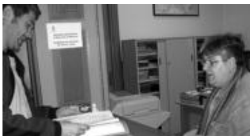
Udaletxean, atzo, bildutako sinadurak entregatzen. N. URBIZU