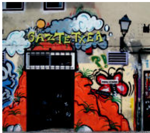
13 urte pasa dira Ibarako Gaztebea sortu zenetik. HITZA

Hasiera guztiak bezala, Ibarako Gaztetxeak ez zuen hasiera erraza izan. Udaleko ordezkariekin izandako «gorabeherek