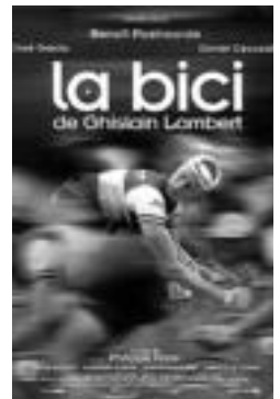
Filmaren kartela.