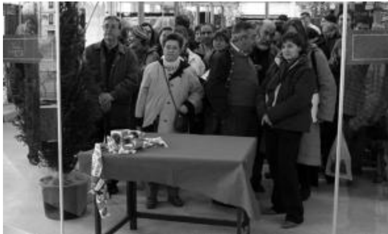
Jende ugari Zerkausira sartzeko itxaroten Txuleta-ren festa ren. MADDI SOROA

3.500 lagun baino gehiago erakarri ditu ekimenak, eta 2.500 kilo txuleta prestatu dituzte denera sukaldariek