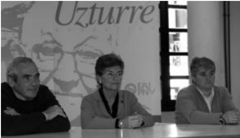
Uzturre Fundazioko kideak atzo eskaintako prentsaurrekoan.