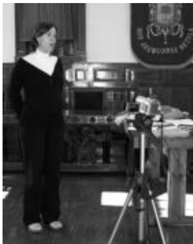
Hainbat komunikabide hurbildu ziren herritarrek kameraren aurrean aurkezpena egin bitartean. N. U.