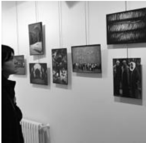
Herri arabiarrek ekin diete Kulturarteko Jardunaldiei. MADDI SOROA

Hitzaldiak edota bideo emanaldiak eta baita jardunaldi amaierako afaria ere, denetik izango da egunotan Ibarra Kultur Etxean. Helburua bakarra, ordea, kultur aniztasuna bultzatu eta zabaltzea, «Euskal Herrian garrantzi sozial, politiko, ekonomiko eta kultural handia duen gertakaria» delako.