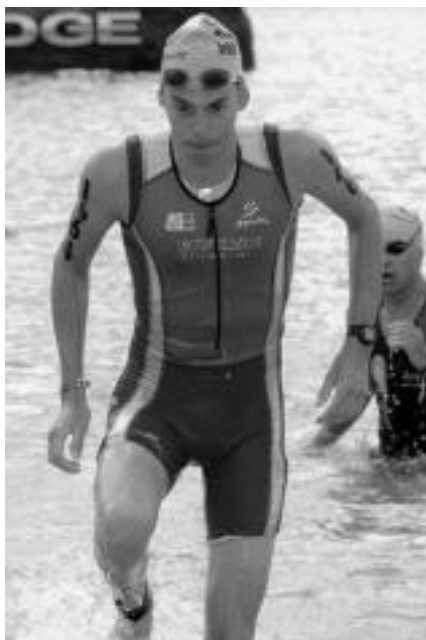
5.000 metro igerian. Igeriketa tartea ohikoa baino motelagoa izan zen. 1.500 parte-hartzaile jaurti ziren uretara. Haien artean kolpe ugari izan ziren lehenengo postuei heldu nahian. Zalakaiek arazo berezirik gabe egin zien aurre igeriketako bost mila metroei. HITZA