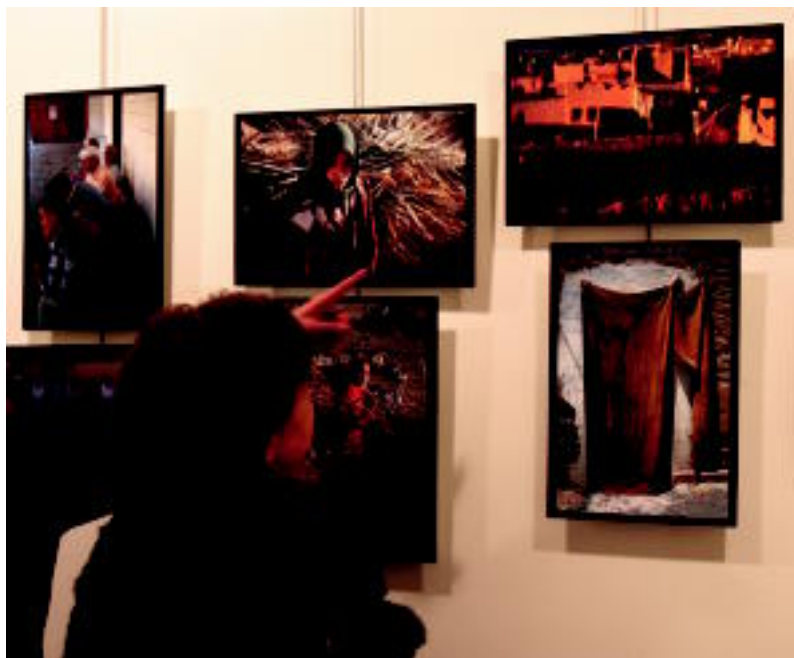
Arabiar lurraldeei buruzko argazki erakusketak inauguratu zituen atzo Kulturarteko Jardunaldiak.

GAIAK ▶ Adin txikiko etorkinen egoera eta hizkuntzaren integrazioa landuko dituzte ▶ 5