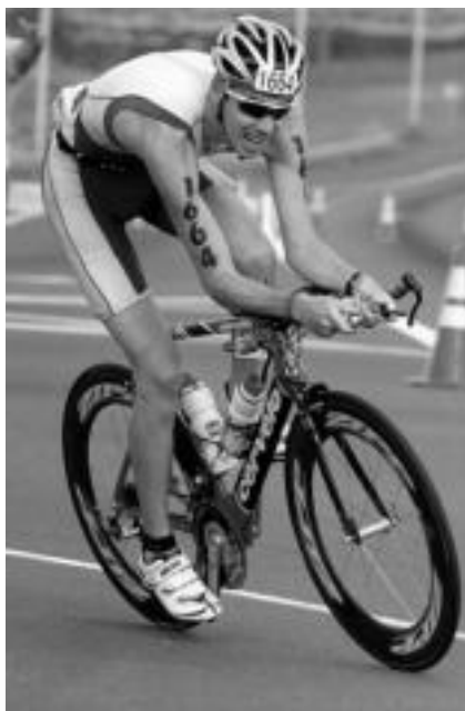
180 kilometro bizikletan. Bizikletaz egin beharreko tartean hasi ziren arazoak tolosarrentzat. Azkarrago joan nahi eta ezin eta hartutako edariak tripan min eginda, buruari bueltak ematen hasi zen. Oraindik maratoi bat zuen korritzeke helmugara iristeko. HITZA