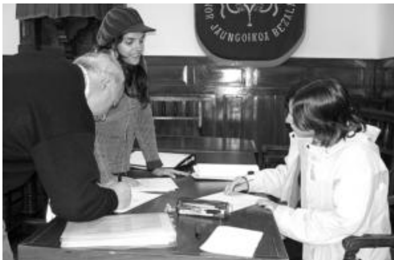
Udaberriean filmatuko duten pelikulan parte hartzera animatu diren herritar batzuk fitxa betetzen. N. URBIZU

'La buena nueva' filmerako probak burutu zituzten atzo; gaur, antzerki eskolakoekin eta institutukoekin izango dira