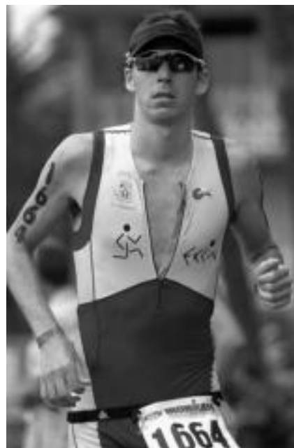
Maratoia. Maratoia erdia oinez egin zuen Zalakaiek. Buruari bueltak egin zituen hainbat kilometro. Azkenean beste filosofia batekin hartu eta korrika jarri zen azken 15 kilometrotan. Hala ere 9ordu eta 50 minutukoa izan zen bere denbora. Ez dago gaizki! HITZA