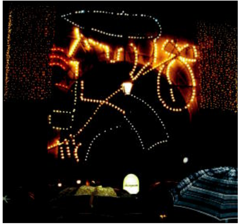
Aterkien artean Olentzero Gaztelako Atean ageri zen; bertan izango da hilabetez. E. EZEIZA

TOLOSA ▶ Eguberrietan kaleak argituko dituzten apaingarrien pizte ekitaldia egin zuten atzo; Tolargik egin du instalazioa, 45.000 euroko aurrekontuarekin