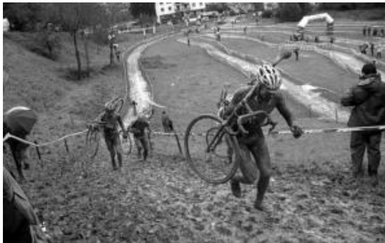
Lamiategi inguruko eremuan iaz egindako probaren une bat. I. GARCIA