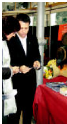
Aurkezpenaren une bat. E. E.

Lau urteko lanaren ostean 'Kilimak!' liburua aurkeztu du, haurrentzat ▶ 4