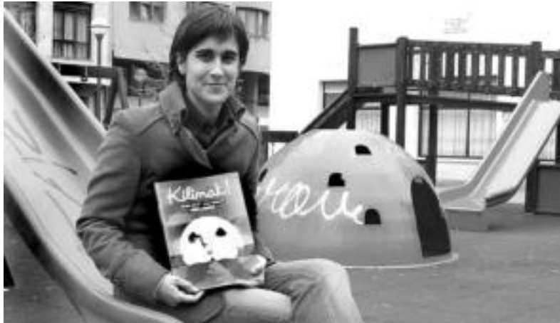
Nerea Sanchok Kilimak! liburuaren aurkezpena egiten duela ikusgai. N. URBIZU