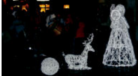
Tolosako ikasleen bandak alaitu zuen ekitaldia.

H eldu al dira jada Eguberriak? Galdera hau otuko zaio, ziurrenik, herri-tarrari herriko kaleak zeharkatzerakoan. Egutegiari begira jarri eta «ez ba, ez dira oraindik heldu!». Bi aste pasatxok igaro behar dute oraindik lehen turriak jateko, baina Tolosako Udalak dagoeneko piztu ditu kaleak apainduko dituzten Eguberrietako argiak. Atzo