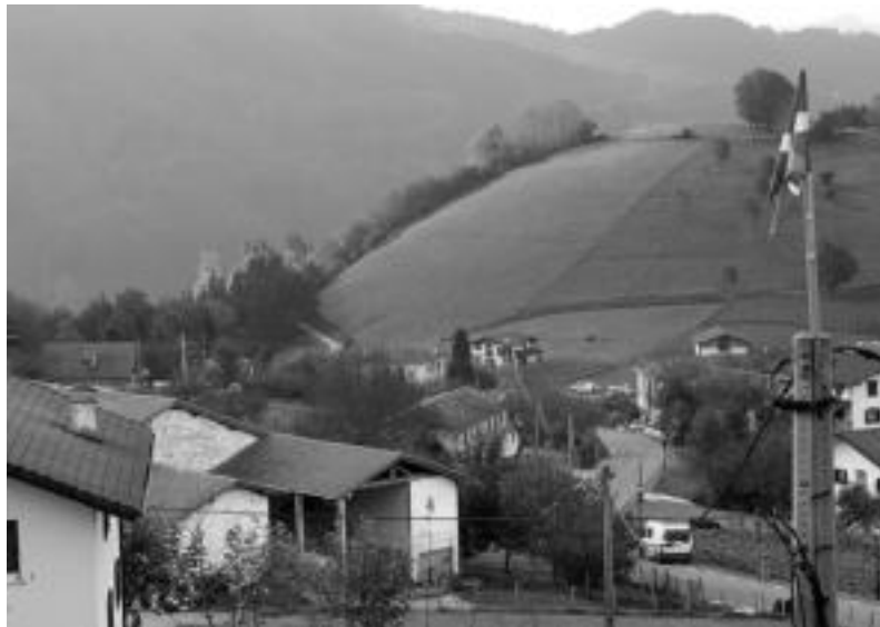
Leaburun ez da horrelako kable posterik izango aurrerantzean, guztia lur azpitik joango baita.