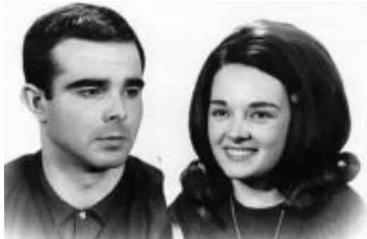
Gazte gara gazte... Eta ez zuden konforme. 60ko hamarkadan ezagutu zuten biek elkar, eta kartzelak bakarrik alindu zituen bata bestearen ondotik. Gerora, biak bat izan dira beti. TXALAPARTA ARGITALETXEA