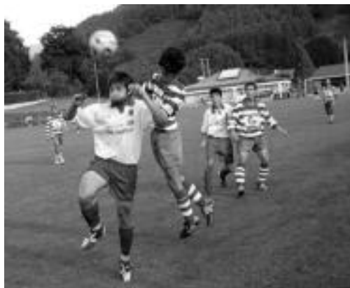
Aurrerakoak denboraldi honetako beste partida batean. J. ASTIBIA