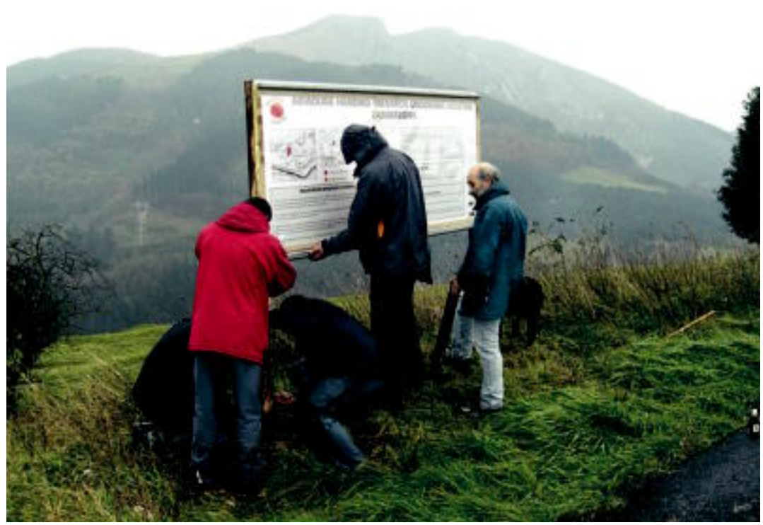
Anoetarrak, Larratz belazean gainean AHTren inguruko panel informatiboa jartzen. N. URBIZU

ANOETA ▶ AHTk eragingo dituen kalteei buruzko panel informatiboa jarri zuten, eta hondakinek estaliko duten belazean lizarrak eta astigarrak landatu zituzten