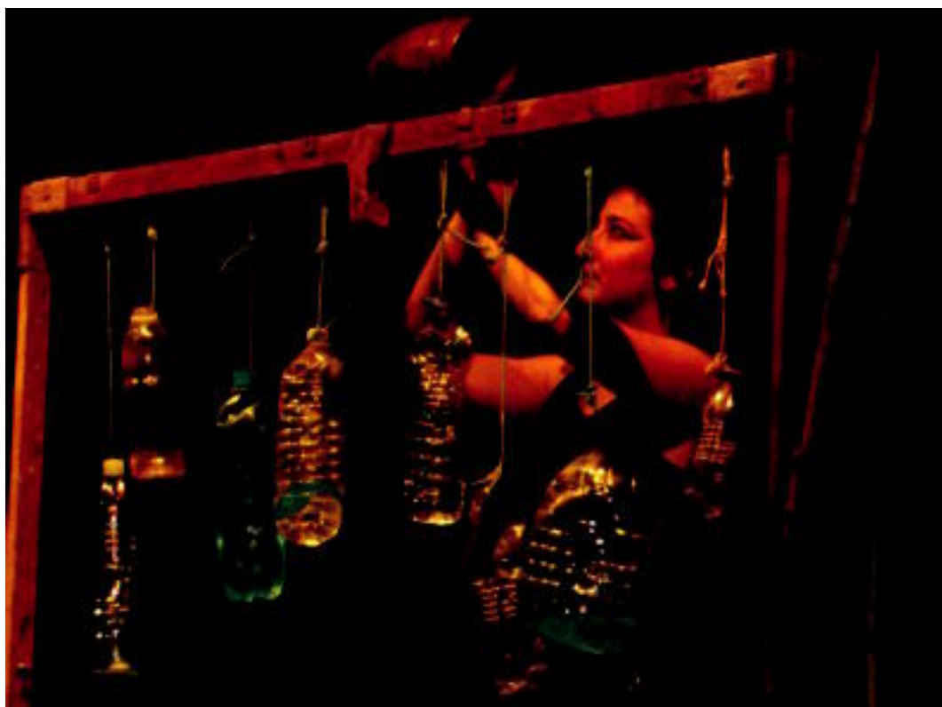
Titiriteros de Binefar Aragoiko (Espainia) antzerki taldearen El hombre cigüena antzeziana, atzo Leidor aretoan. ESTI EZEIZA

«Lapurreta handia jasan zutela» dio abertzaleak ▶ 7