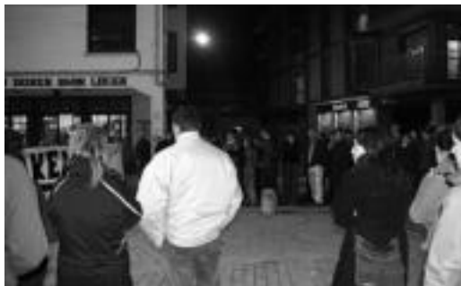
Alegian ere herenegun ehunka lagun bildu ziren.