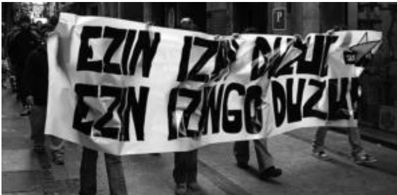
150 lagun inguruk Tolosako Alde Zaharreko kaleak zeharkatu zituzten, abiloketak salatuz. N. URBIZU

Espainiako Auzitegi Nazionalak 10.000 euroko fidantzapeko espetxeratzea ezarri die «sute, indarkeria, mehatxu terroristak eta atentatuak» egotzita