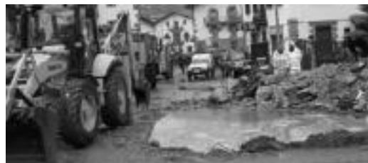
Urak gainezka egin zuen errotonda inguruan.