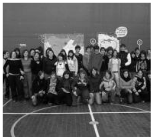
Hirukide. Adin guztietako ikasleek hartu dute parte. HITZA