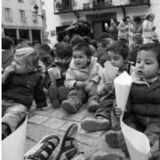
Irura. Irurako ikastolako haurrak gantain jatean. M.SOROA

Tolosaldeko hainbat herritako ikastetxek hamaika ekitaldiren bitartez bihar izango den Euskararen Eguna ospatu dute ikastoletan giro ederrean