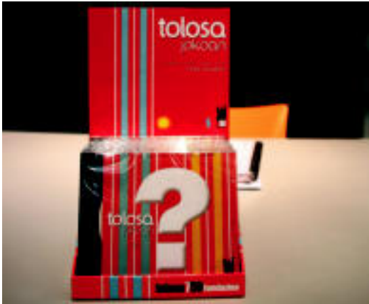
Tolosa jokoan DVD-a 10 euro balio ditu eta salgai da dagoeneko. N. U.

▶ HITZAK ez du bere gain hartzen egunkarian adierazitako esanen eta iritzien erantzukizunik.