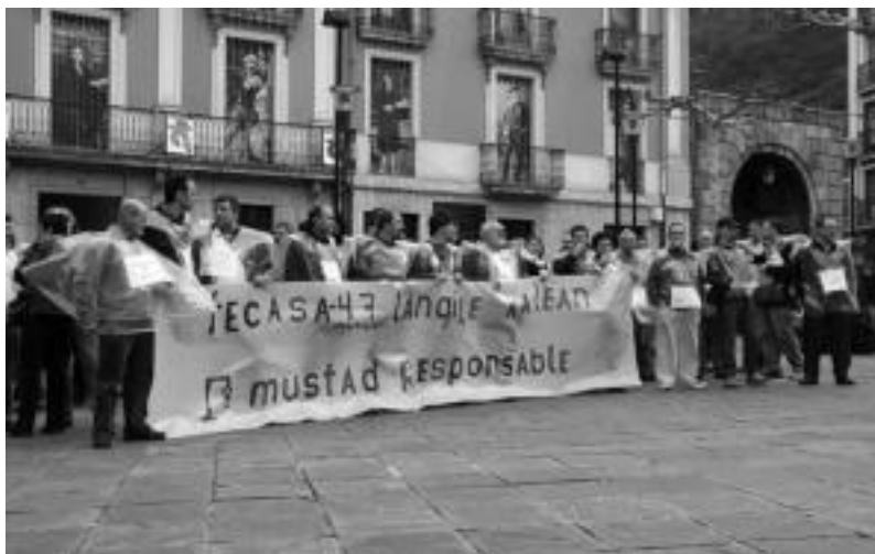
Langileek prentsaurrekoa egin aurretik kontzentrazioa egin zuten Triangulo plazan. N. URBIZU

Paper lantegia ixtearen erabakiarekin «47 langile eta beraien familiak utziko ditu kalean»; enpresak prozedura konkurtsala, likidazio eskaerarekin eskatu du