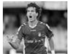
Xerezekin gola ospatzen. HITZA