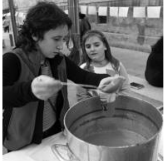
Villabona. Txokolatada izan zen guztientzat Villabonako plazan. M.S.