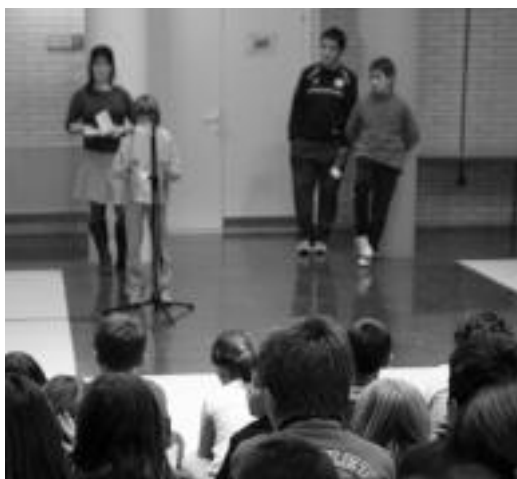
Anoeta. Ipuin Lehiaketako sariak banatu zituzten unean. M.SOROA