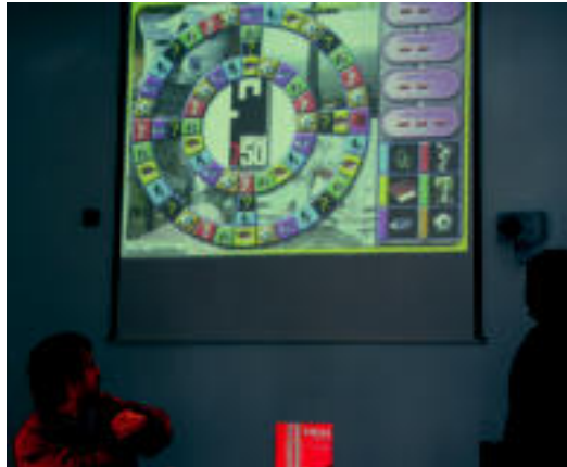
Tribial tradizionalaren irudia hartu dute oinarri. N. URBIZU