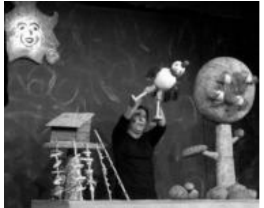
La Goleta de la Azotearen La gallina churra obra izan zen atzo. E. E.