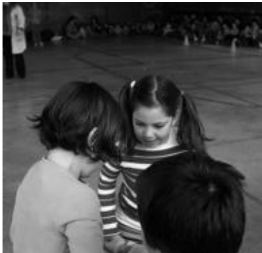
Zizurkil. Haur eta gurasoak jolasean aritu ziren frontoian. M.SOROA