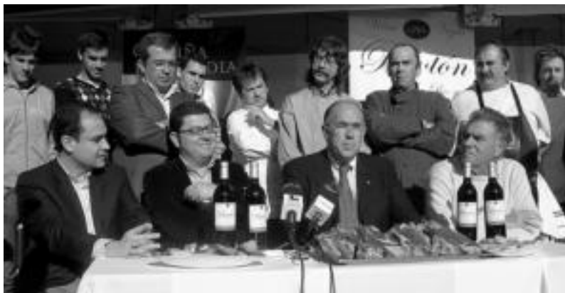
Txuletaren jaialdian parte hartuko duten zenbait kide atzoko aurkezpenean.

Zerkausian, erretegiatiko menu berezia dastatzeko aukera izango dute herritarrek hilaren 6tik 10era bitartean