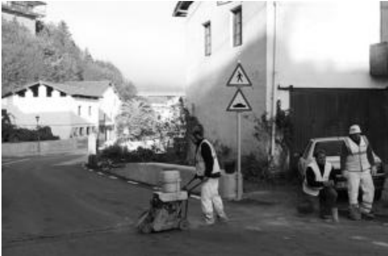
Langileak gaineko pasabidea egiten hasi zirenean, atzo. M. SOROA

Bizilagunek azaldu duten araberako «Ibarrako Udala