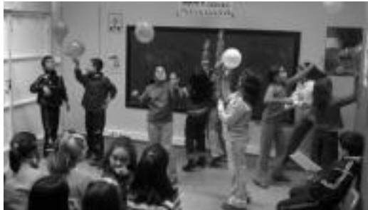
luz, Jesusen Bihotza ikastolan, Euskararen Eguneko une bat. I. GARCIA

Hirukideak, gaur egingo dituzte ekitaldi guztiak. Xabil maskota-