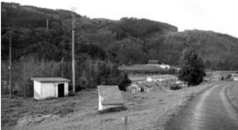
Errepikagailua —etxolaren gainean eta ondoko zutabeen— Agarre bailaran jarri du Udalak. I. GARCIA