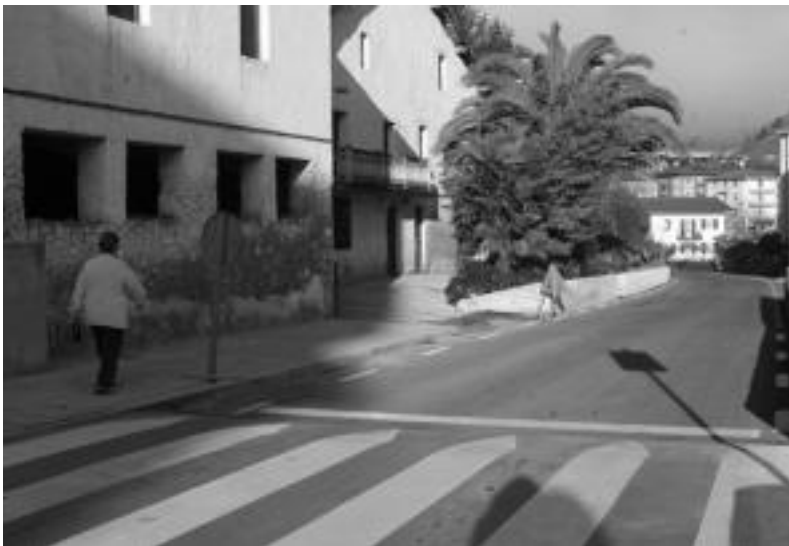
Bizilagunek espaloia Zumardi Handiraino luzatzea eskatu diote Tolosako Udalari. M. SOROA