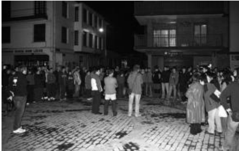
Alegian elkartu ziren iluntzean herrikidearen askatasuna eskatzeko, herriko plazan.