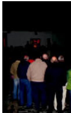
Alegiko elkarretaratzea. i. g.

MOBILIZAZIOAK ▶ Alegian eta Tolosan izan ziren atzo; epailearen aurrean deklaratuko dute gaur ▶ 6