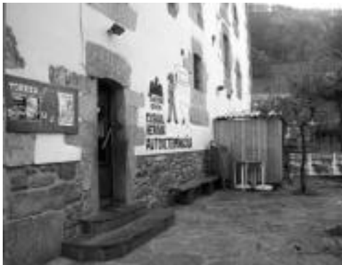
Torreko ataria. N. GARZIA

Autodeterminazioaren aldeko mus txapelketa bihar hasi eta 29an bukatuko da