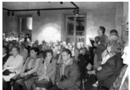
Jende ugari bildu zen herenegun osoko bilkuran. ov

Plataformako kideek eske- rrak eman zizkieten bilkurara joandako herritarrei. Bestalde adierazi zuten, itxaron zerren- den arazoa gero eta larriagoa dela, horregatik, lehenbaile- hen konponbide bat bilatu be- harra dagoela. Gainera, «ze- hazki» jakin nahi dute alderdi