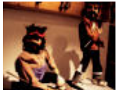
Titiriteroak behetik maniatzen dituen bobongiloak, eta eskularru bezala jarrita maniatzen direnen adibideak. | TERRADILLOS