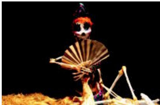
Eskelotoak. Harry V. Tozeren bildumako adibide bat, Bartzelonako Antzerki Institututik ekarria. | TERRADILLOS