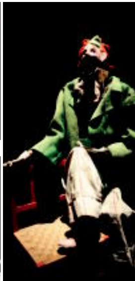
Portugalgo txotxongiloak. Alentejo eskualdeko bobongilo tradizionalen adibide da irudian duguna. Sortu ziren herriakatik hartu zuten izena. Heganen bidaz manipulatzen dira. | 100000000