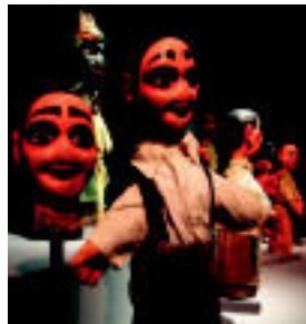
Eskularru txotxongiloak. Bartzelona Antzerki Institututik utzilaikoak dira bobongilo hauek. | TERRADILLOS