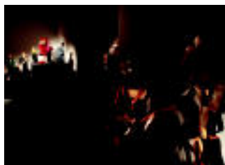
On Kixote. Sancho Panza eta On Kixote, Lleidako (Espainia) zentroak utziak. | 1

TXOTXONGILOAK Osketa, 39 konpainia, bildumagile, erakunde eta museok utzilaiko txotxongiloak dago osatuta.