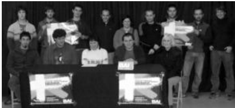
Bai Euskal Herriari herri ekimenaren eskualdeko kideek Adunan egindako agerraldiaren une bat.