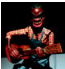
Gerra ondorengo txotxongiloen adibide bat. | 1