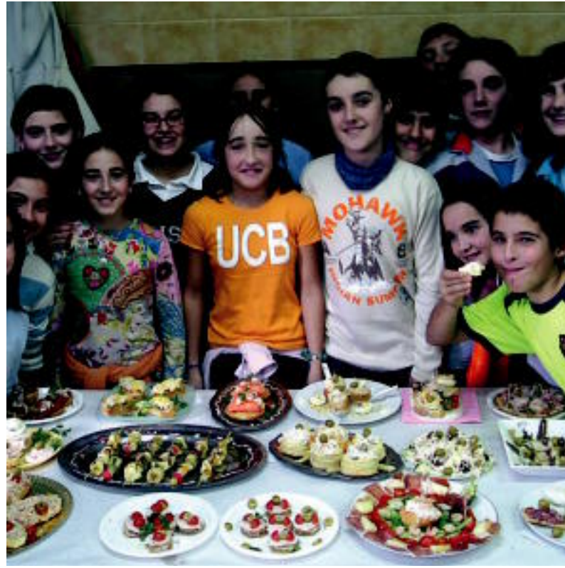
Zaindariaren omenezko astearen baitan, DBHko lehen zikloko pintxo lehiaketa.