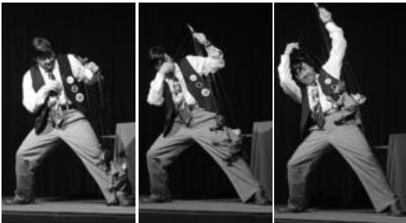
Colombiako Hilos magicos taldearen De sombras y sombrillas emanaldiko une bat, atzo.

Titirijai 2006 ibilbide erdira iritsi da dagoeneko; gaur ere, egunean zehar bost saio izango dira haur eta familientzat, beste bat berriz, helduentzat