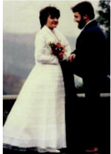
ZORIONAK Atzo 25 urte elkarri «bai, nahi det!» esan zenietela. Zorionak eta, nola ez, eskerrik asko zuen bi urteen partetik.

Mesedez, ekarri argazkia bi egun lehenago ondoko leku hauetako batera. Mila esker.