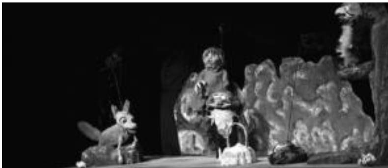
Euskal Herriko Pro Ismo Cero taldearen Quizas el bospue estreinaldiko une bat, atzo, Leidorren. ESTI EZEIZA

Ekuadorko, Argentinako, Kolonbiako, Mexikoko eta Euskal Herriko taldeek eskainiko dituzte ikuskizunak, haurrentzat nahiz helduentzat zuzenduak