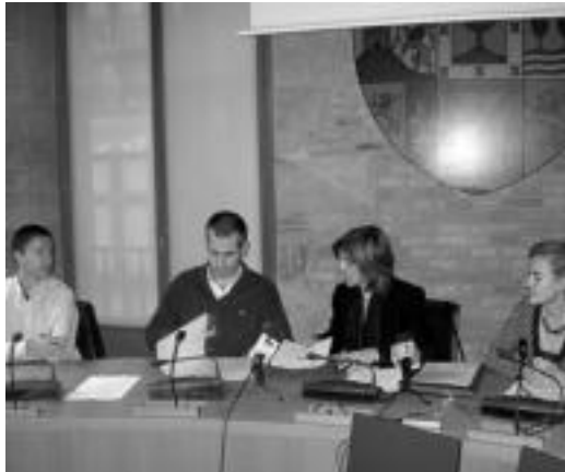
Atzo goizean sinatu zuten akordioa, udalebean. E. EZEIZA

Orain arte, La Caixak Euskal Herrian 246.000 eurotik gorako 22 mikrokreditu eman ditu. Bestalde, eskualdeko garape-