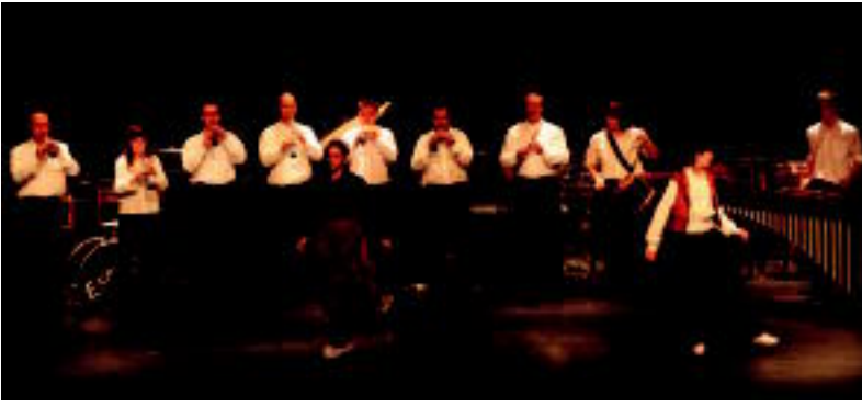
Giro arte dultzainari taldeak dantzariak sartu zituen igandeko bere emanaldian, Leidorren. NEREA LIZARTZA

TOLOSA ▶ Jende asko bildu zen Leidorren igandean herriko bost musika taldek Santa Zeziliaren omenez eskaini zuten kontzertu berezian