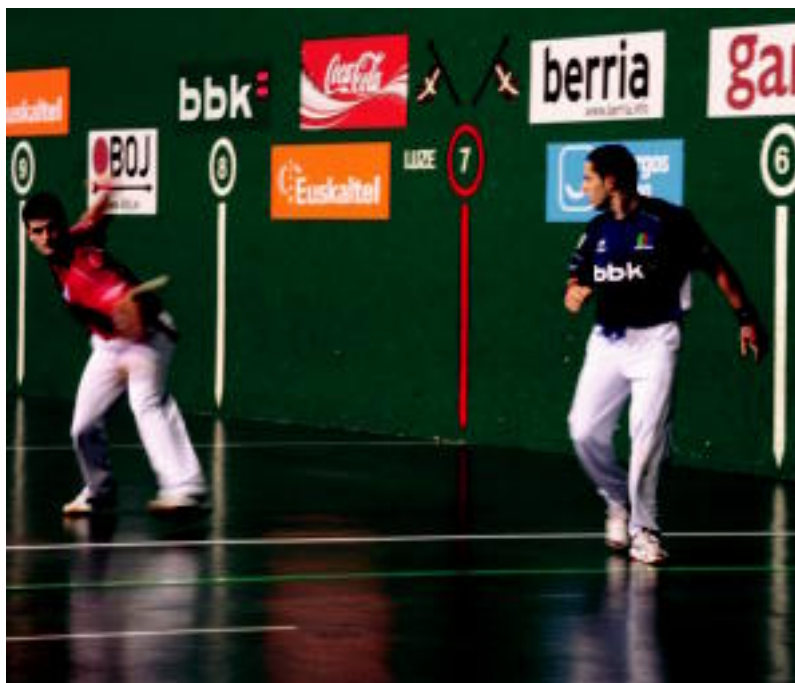
«Seguru» jokatu zuen pilotari leitzarrek Tolosako Beotibar pilotalekuan, herenegun. NEREA LIZARTZA

LEITZA ▶ Olaizolari irabazita, Lau t'erdiko txapela eskuratzeko aukera du Martinez de Irujoren aurka ▶ 7