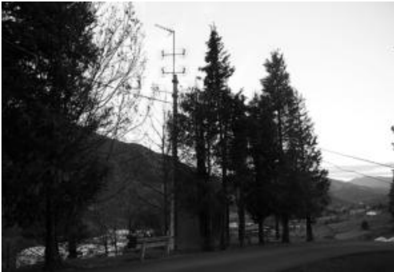
Hilerraren ondoan dago egun telebistako seinalea ematen duen errepikagailu analogikoa. I. GARCIA

Egun dagoen errepikagailu analogikoak «ez duelako ondo funtzionatzen», aparailu berria jartzeko erabakia hartu du