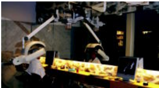
Berko prentsa arrosko aldizkariaren gain, hainbat eskaintza dituen ziber ileapaindegia. ENERITZ MAIZ

Ileapaindegietan eta estetikaz zentroetan gizonetakoak ia emakumeak beste birgiztatu diote euren buruari; guztiak bere estiloa aurkitzen saiatzen dira