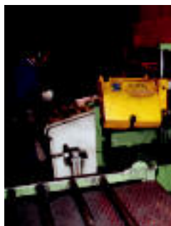
Lanik enpresa. I. GARCIA

Neurri handiko estalkietan espezializatua dago, eta bulego nagusiak Donostian baditu ere Asteasun du lantegi bat ▶ 4