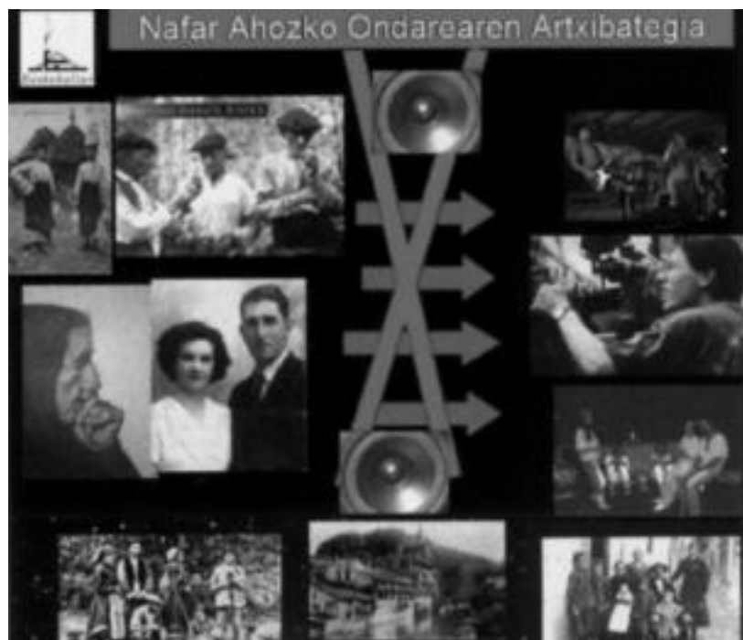
Herri bakoitzeko ezaugarriak ezagutzeko elkarrizketak egin eta bideoz grabatuko dituzte. HITZA

Leitza, Areso, Goizueta eta Aranon dagoeneko zenbait herritarrekin bildu dira, proiektua bideratzeko asmoz, baina 2007. urtean hasiko dira elkarrizketekin