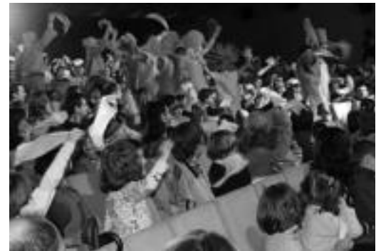
Trikitraka Trikitronekoak Leidorretik bueltaketa. I. TERRADILLOS