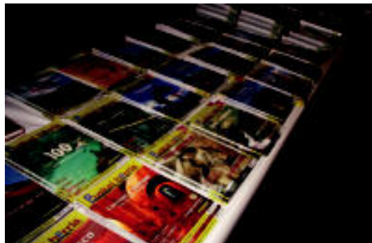
Mendiari buruzko aldizkarietan ere bada zer aukeratu. I. T.