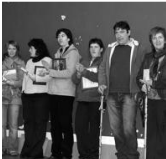
Gazta, postu eta argazki rallyko irabazleak sari banaketan. N. LIZARTZA