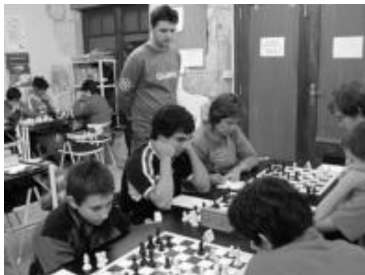
Pasa den larunbateko xake partidetakoa une bat.