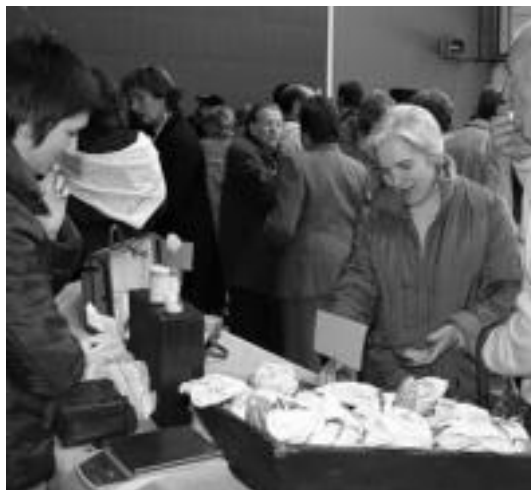
Igandean, frontoain toki hartu zuen postuetako bat. NEREA LIZARTZA