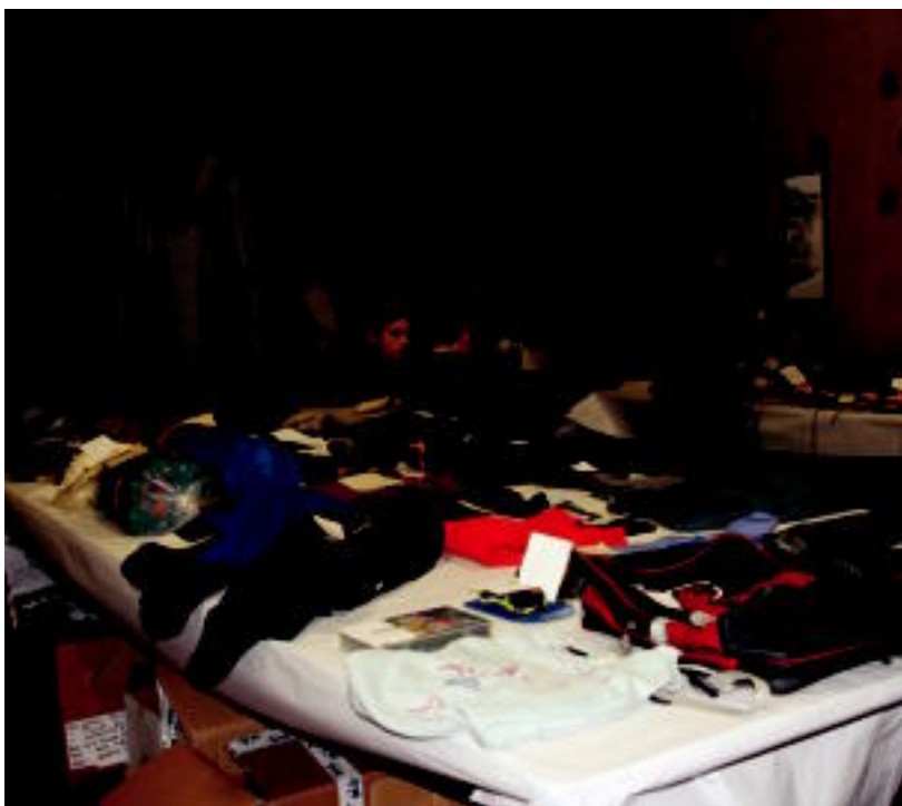
Aukera handia dago azokan mendiko materialen artean erosteko. I. TERRADILLOS

TOLOSA ▶ Mendi Hamabostaldiaren harira mendiko materialaren azoka antolatu du Oargi elkarteak; igandera bitarte izango da zabalik