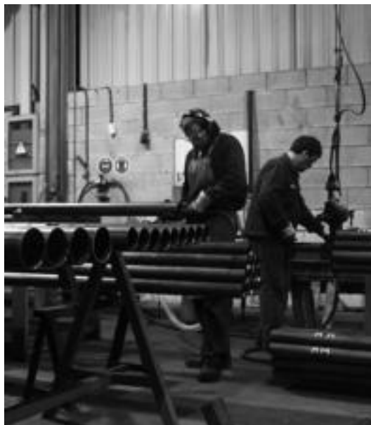
Langile batzuk lanean Lanikek Asteasun duen lantegian. I. GARCIA

ten lehenengoa Donostiako Illunbe zezen-plazarako izan zen. Ordudik horrelako estalki ugari egiten ari dira, gehienetan zezen-plazetarako. Tamaina handiko estalki mugikor zein finkoetan daude espezializatuak. Esparru horretan beste produktu batzuk garatzen ari dira eta laster merkaturatuko dituzte.