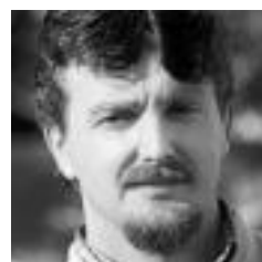
PATZIKU PERURENA IDAZLEA

«Gure hizkuntza kultura eta nortasuna bultzatu eta erabiltzeko tresna eraginkor nahiz beharrezkoa izanen da»