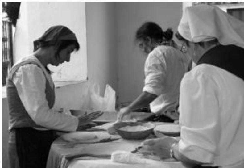
Taloak. Aresoko Euskararen Egunean hainbat ekitaldi antolatu zituzten, baina egunari ongi etorria emateko talo-jatea aukeratu zuten. Herritarrak izan ziren taloak prestatu zituztenak eta eguraldi txarra egin zuzenez, gustura jan zituzten bertara hurbildu zirenek. N. LIZARTZA

«Denon artean festa polit bat egitea eta euskara bultzatzea» helburu duen egun hau Gurasoen elkarteak, Udalak eta Larrea eta Pake-toki elkarteek antolatu zuten, eta beste helburu bat ere bazuen: «gauzak aurrera eramaten saiatu behar gara, atetik heldu direnek herri txiki-txikiaren ere gauzak egin daitezkeela ikus dezaten».