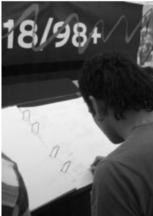
18/98+ Kaiera ekimenean herritarrek auziaren inguruko iritzia eman ahal izan zuten. I. GARCIA

Egibarrek dionez, Euskal Herriaren independentziaren alde dagoen dinamika «oztopatu eta bertan behera gelditzea»