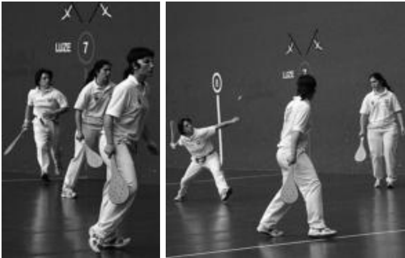
Larunbatean Beotibarren jokatu zituzten Emakumea Pilotari Txapelketako partidetak irudiak.

Larunbatean jokatu zituzten paleta goma partidak, Beotibar frontoian; denera, 10 bikote ari dira parte hartzen