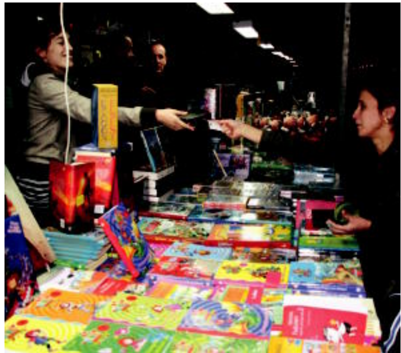
Arrakasta handi dute gaztetxoei zuzenduriko liburuek. I. TERRADILLOS

TOLOSA ▶ Hilaren 26ra arte Liburu eta Disko Azoka ezarri dute San Frantzisko ibiltokian; bertan euskarazko liburu eta diskoak eskura daitezke, besteak beste