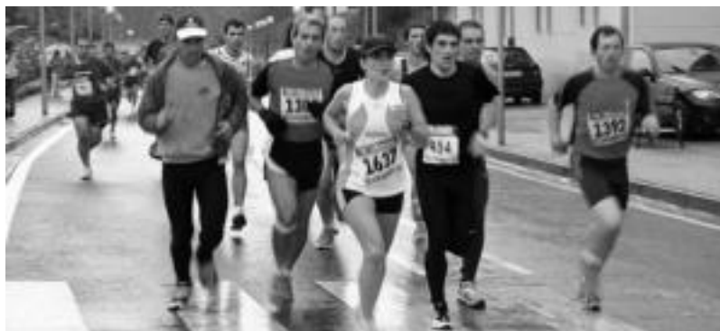
169 korrikalarik egin zuten Ikaztegieta XVI. herri krosa. N. LIZARTZA

Igandeko lasterketan 169 korrikalarik hartu zuten parte 10 kilometroak eginez