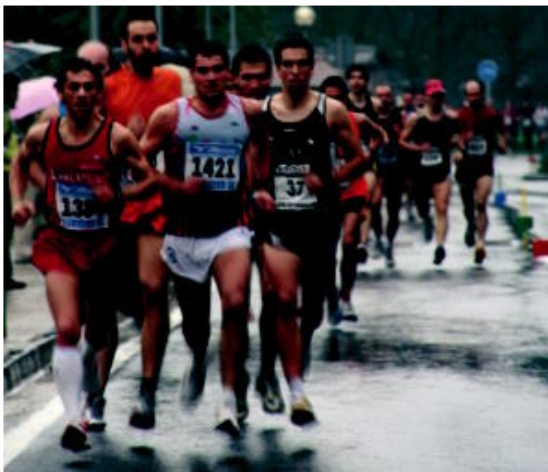
Euria izan zuten lagun herenegun lasterkariek 10 kilometrotan zehar. NEREA LIZARTZA

PARTAIDETZA ▶ 169 korrikalarik burutu zuten 10 kilometrotako ibilbidea; antolatzaileak, «gustura» ▶ 3