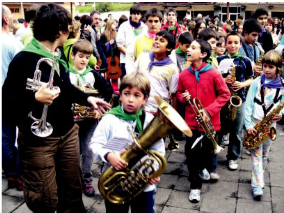
300 gazte inguruk hartu zuten parte Loatzo Egunean; argazkian, ume batzuk euren instrumentuekin eskuetan.

TXINTXARRI EGUNA ▶ Azaro Kulturalaren baitan abesbatzen emanaldia izango da gaur ▶ 6