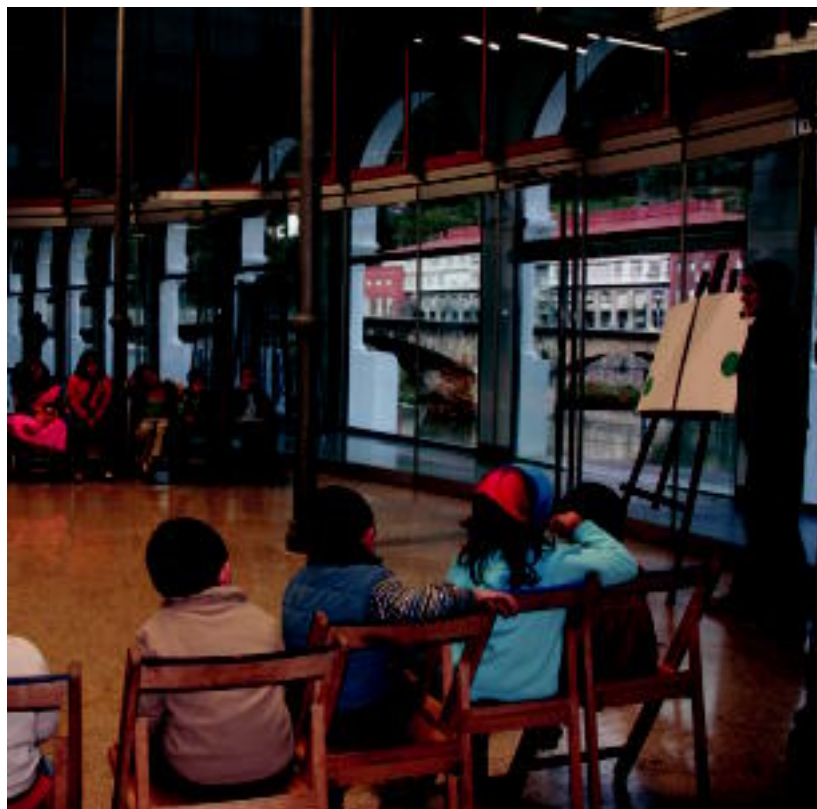
Haur guztiak sartzen ez zirelako, bigarren emanaldi bat egin behar izan zuten. E. EZEIZA

TOLOSA ▶ Igarondo Tolosako Merkatarien Elkartek antolatuta, Ipuin kontalaria izan zen atzokoan Zerkausiko behirazko eremuan