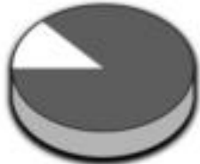
Bai 87% • Ez 13%