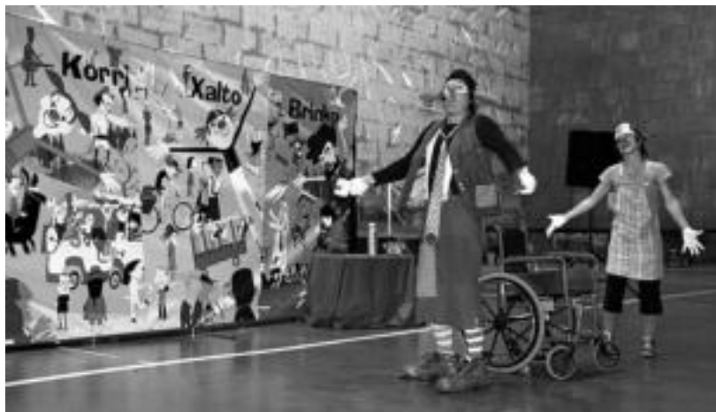
Korri, Xalto eta Brinko pailazoaren emanaldiarekin barre ugari egin zuten umeek atzo Adunan. E. EZEIZA