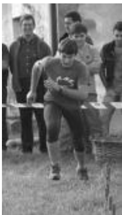
Etxeberria, lokotz biltzen. N. L.

Eta ona den guztiak omen du bukaera; ezin hau salpuespena izan. Hala, gaur emango diete amaiera aurtengo sanmartinei.