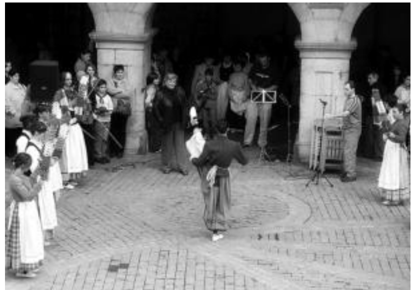
Begoña Azepeitiari plazan egin zioten omenaldia. Bertan bertsoak, opariak eta dantzak jaso zituen. N. URBIZU