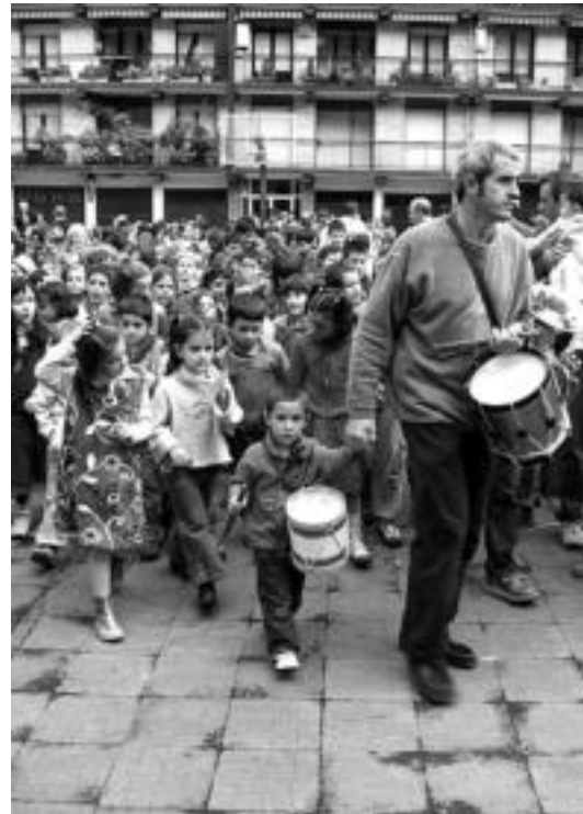
Loatzo egunean Loatzo musika eskolako ikasleak bildu ziren. N. URBIZU

300 musikari inguruk ospatu zuten musikarien eguna, musika eginez