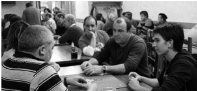
Berastegiko Kultur Astearen baitan, jende ugari bildu zen musean joatzeko. E. EZEIZA

Berastegik eta Adunak gaur emango diote amaiera Kultur Asteari; Ikaztegieta aldiz, gaur hasiko dira krosarekin