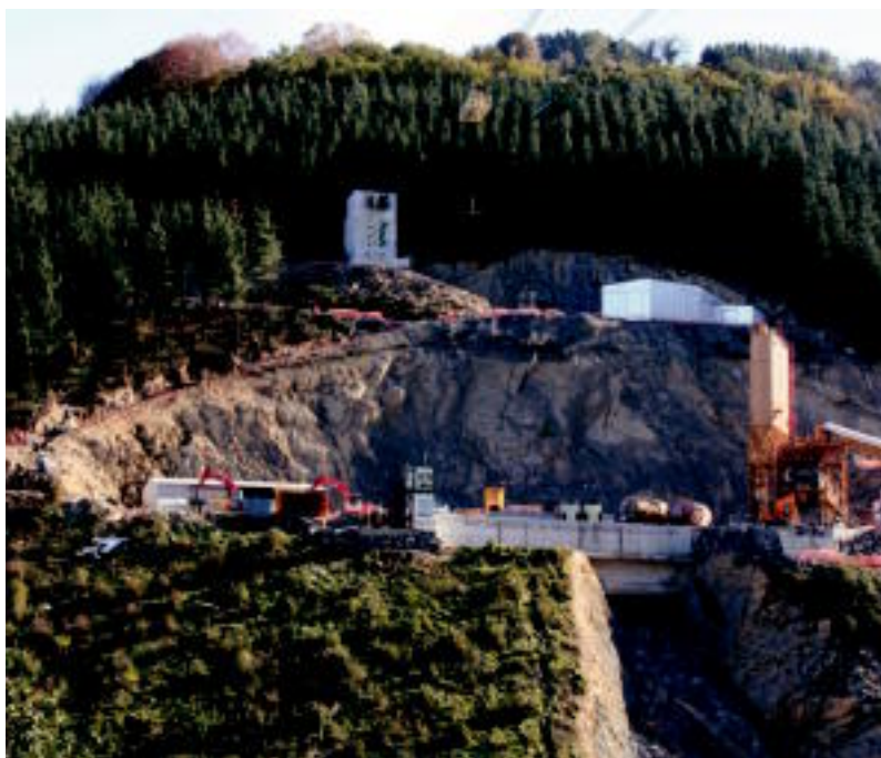
Ibiurko lanak direla eta, Baliarrainera doan errepedea «estuagoa eta trazaketa txarrekoa» da orain.