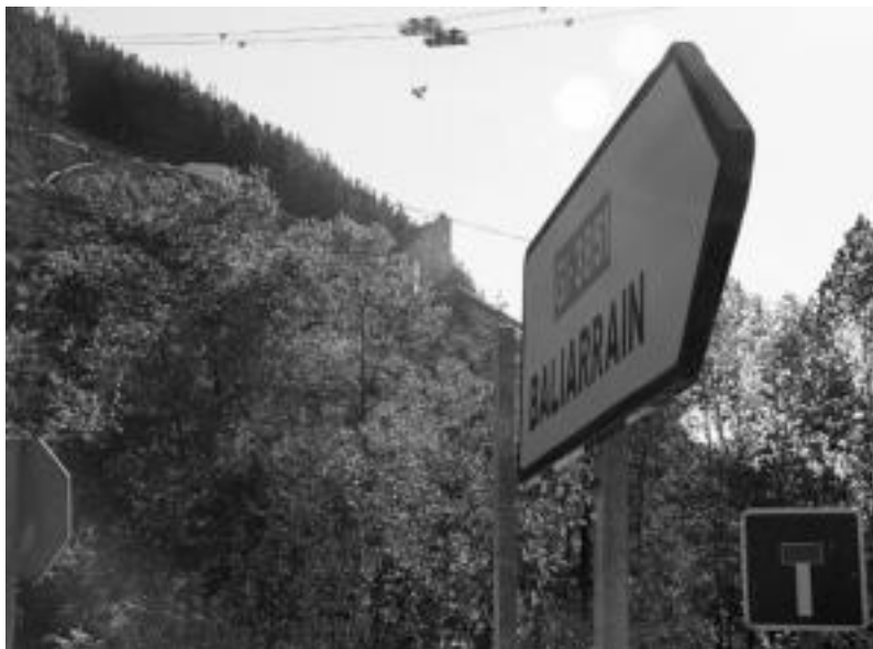
Ibiur urtegirako presa egiten hasiko dira aurki. Ondorioz, Baliarrainerako errepidea aldatu egin dute. n. u.

Urtegiarengatik herrirako errepide «estuagoa eta trazaketa txarrekoa» egin dute