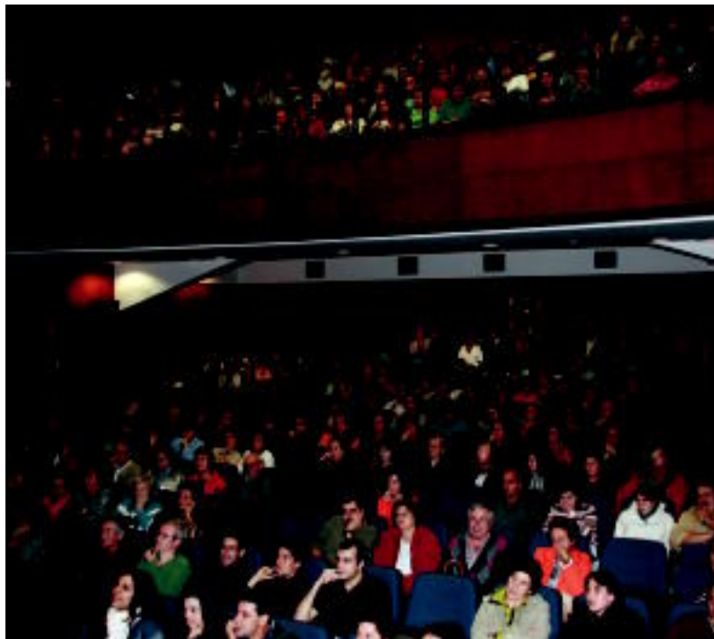
Jende ugari joan zen Gurea aretara zozketaren berri zuzenean izateko. I. GARCIA

VILLABONA ▶ Flemingo eremuan egiten ari diren babes ofizialeko 20 etxebizitzak eskuratzeko zerrendaren zozketa burutu zuten atzo Gurea aretoan