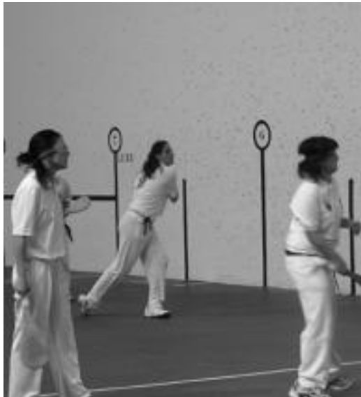
Emakumea Pilotari Txapelketako partida bat.

Hori dela eta, «pilota lehiaketak interesa galtzen joan dira pixkanaka», eta ondorioz, denboraldi honetarako Gipuzkoako Euskal Pilota Federazioak Emakumea Pilotari Txapelketa antolatzea erabaki zuen, «bikoteak joko mailaren arabera