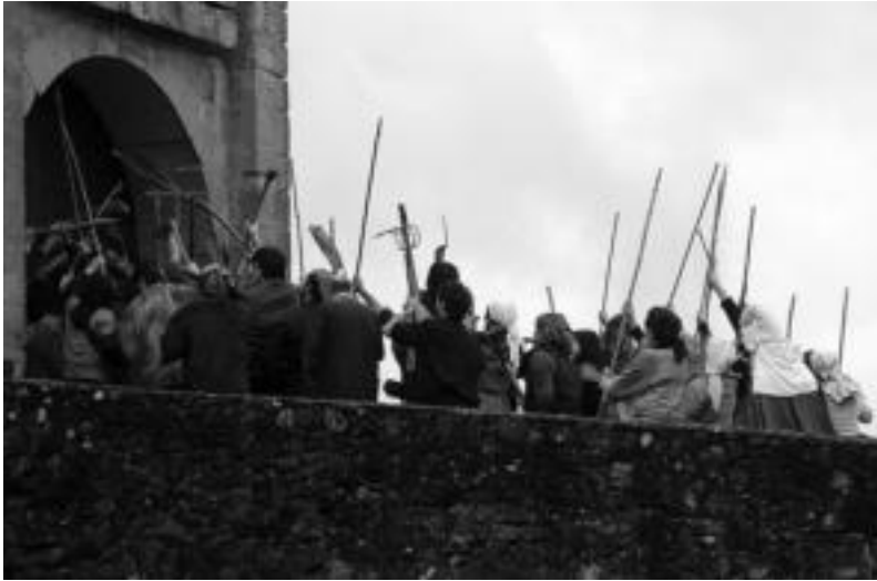
Eneko Aritzaren inguruko informazio gehiago eskuratzeko sartu www.enekoaritzarenlagunak.net-en . HITZA

Etzi goizean egingo dute grabaketa; antolatzaileek dei zabala egin die eskualdeko herritarrei parte hartzeko