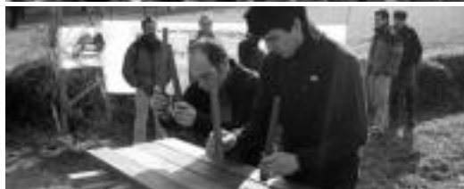
Aurten hainbat ekitaldi egin dituzte AHTren proiektua salatuz... HITZA