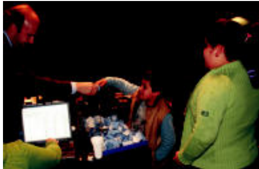
Bi haurrek atera zituzten zenbakiak kuxatik. I. GARCIA

▶ HITZAK ez du bere gain hartzen egunkarian adierazitako esanen eta iritzien erantzukizunik.