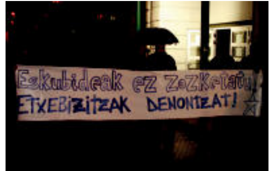
Zenbait gaztek protesta ekitaldia burutu zuten. I. GARCIA