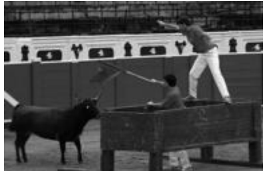
Herri bazkariaren ondoren Lasturgo zezen enbolatuekin erakustaldia eta festa ospatu zuten Zezen Plazan. N. LIZARTZA