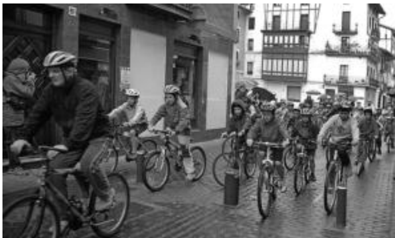
Azaro Kulturalaren baitako bidegorriko martxako momentu bat. Ondoren, ginkana egin zuten. HITZA