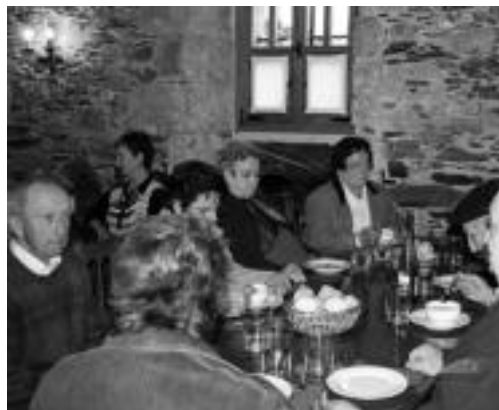
Igandeko hamaiketakoak eta bazkaria Zartagin izan ziren.

Hilaren 26an babarrun eta gaztain jatea izango dira: txartela 17rako erosi behar da