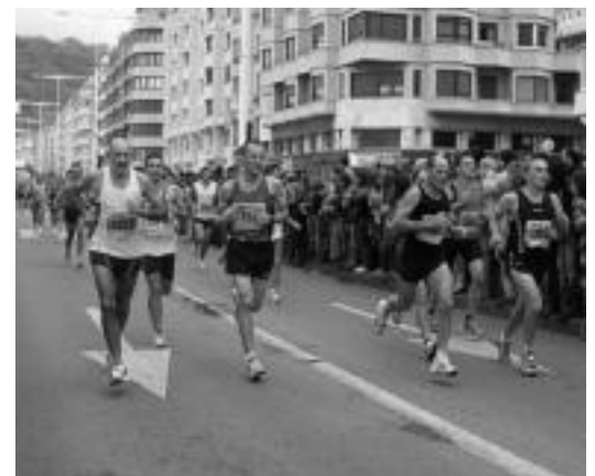
Gutzira 11.719 iritsi ziren helmugara. HITZA