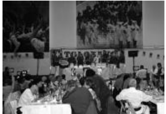
Herri bazkarian 500 pertsona inguru bildu ziren eta denei jaten emateko, 70 kilotik gora babarrun behar izan zituzten.