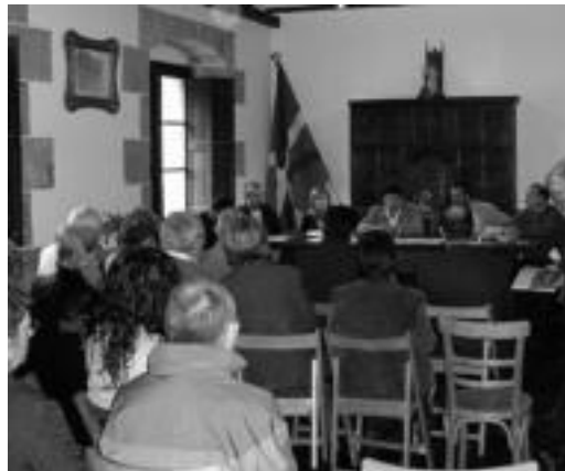
Udaletxean egin zen bi liburuen aurkezpeneko unea. HITZA

Behartsuen apaiz ezezik, euskaltzale sutsua ere izan zen Jakakortexarena, besteak beste. ◀