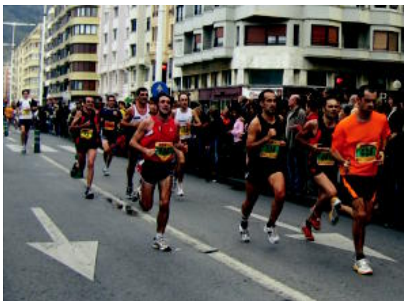
Bi eskualdeetako 307 korrikalarik korritu zuten; irudian, korrikalariak Groseko azken banpan. ESTITXU IMAZ

PARTE-HARTZEA ▶ Bi eskualdeetatik, iaz baino 31 korrikalari gutxiago iritsi dira helmugara ▶ 2-3