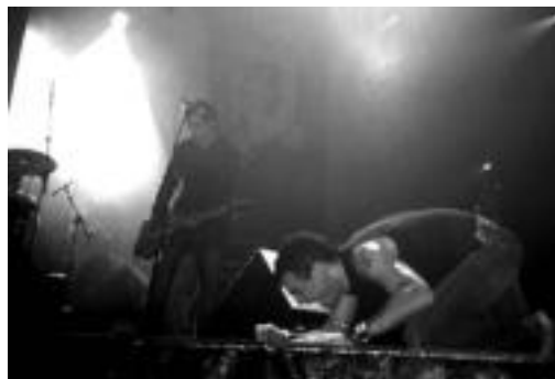
Kuraia musika taldea emanaldietako batean.