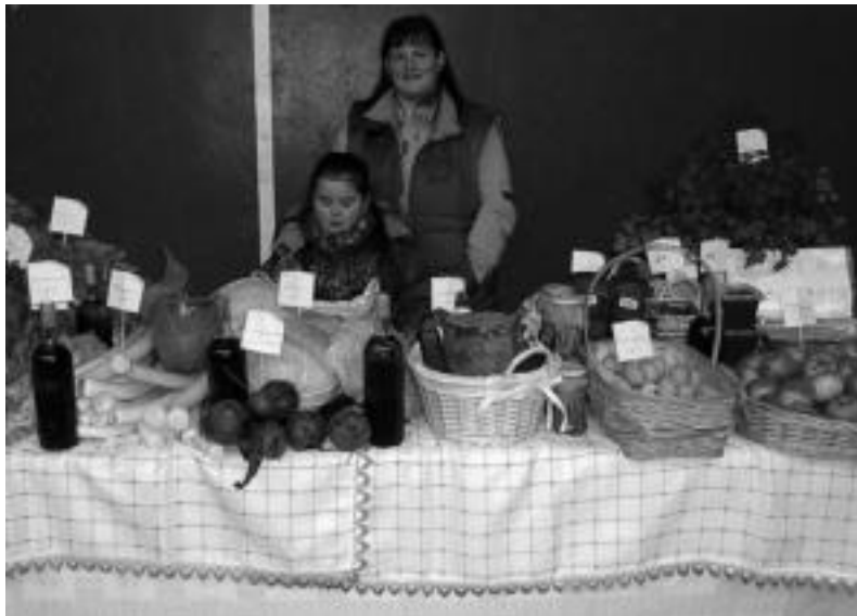
lazio Kultur Astean ospatu zen azokan garaila atera postuko irudia.

Gogoratu, honako hauek dira Kultur Astea posible egiten duten taldeak: Aldin Kirol eta Kultur elkarteak, Basurde elkarteak, Berastegiko Udala, Muñagorri Guraso elkarteak, Muñagorri Herri Ikastetxea eta Urepele elkarteak.