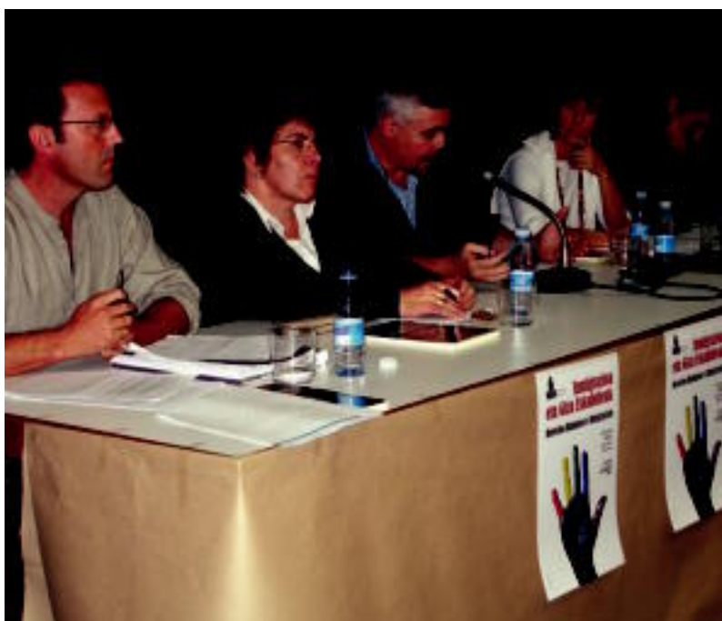
Albite, Anxutegi, Unzurrunzaga, Gonzalez de Txabarri eta Matute, herenegun, Kultur Etxean. I. TERRADILLOS

TOLOSA ▶ Lau alderdietako ordezkariak euren iritzia eman zuten herenegun; gaur, adingabeak mintzagai ▶ 2