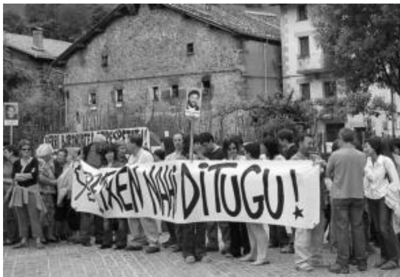
Bi urte. 2004ko azaroan abilo hartu zuten zuzenez geroztik herrian bere egoera salatzen hainbat manifestaldi egin dira, eta osoko azkeneko bilkuran ere, udalak bere aldeko mozioa onartu zuen aho batez. Argazkian, 6 hilabete kartzelan egin zituenean egindako bilkura.

Ezker abertzaleak deialdi pare bat egin ditu gaurko eta bihar. «Indarrak bilduz, prozesua aurrera!» lemapean, beraien nahia azaldu dute «alde batetik historikoa den momentu honi bultzada ematea eta beste aldetik prozesuari irtenbiderik ematen ez dioten irteera faltsuei atea ixtea». Helburu honekin, beraz, gaurko deialdia egin dute, gaueko 21:00-21:15 aldera itzalaldia eta burrunbada handi bat egiteko, hau da, etxeko argiak itzali eta kazerolada handi bat egiteko. Bestetik, bihar, Bilbon «Euskal Herriak Autodeterminazioa» lelopean ospatuko den nazio manifestaldira jendea joateko deialdia egin du ezker abertzaleak. Leitzatik autobusak aterako dira, eta joan nahi duenak Torrean izena eman besterik ez du egin behar.