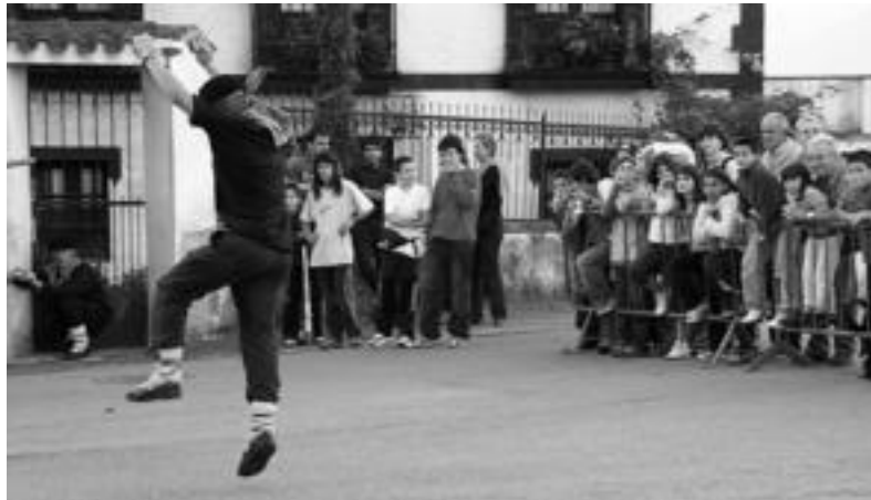
Bazkariaren ostean, dantzan aritu ziren herriko gazteak, trikitilarien doinuekin. MADDI SOROA

Eskualdeko azkenak izanagatik, Amasako herritarrek ez dute inbidiarako aitzakiarik, bertako jaiak ere indartsu hasi baitira, bere lehen egunetik. Zerura begirata udako jai giroan daudela pentsa dezaketen arren, azaroa bete-betean hartzen dute San Martin jaiak. Atzo gazteei zuzendutako eguna izan zen bereziki eta festa eta algarra goizetik hasi zuten. Batzuk oraindik oheratu gabe eta beste batzuk jeiki berri, gosaria egin zuten, Ongi Etorri tabernan, trikitilari eta dultzaineroen doinuak alaituta. Ondoren, goiza indarrak berreskuratzeke baliatu zuten.