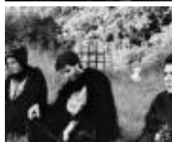
Gaur joko duten taldeak.

egindako geldiuenearen ostean grabatu zituzten biniloan. Hau, edizio mugatuko 10" baten argitaratu zen. Beraiekin batera ariko da Freak Kennedys taldea. Hauek zaragozarrak (Espainia) dira, eta Dead Kennedys taldearen bertsioak eskeniko dituzte.