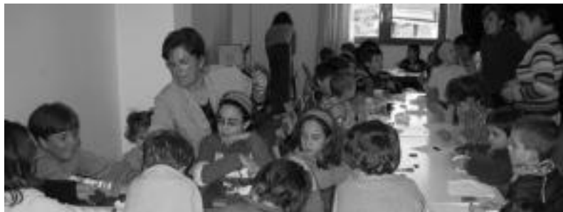
Aurreko urteetan ere haurrei zuzendutako ekitaldiak izan dituzte Kultur Astearen baitan. IMANOL GARCIA

Heldu den astelehenean hasita, adin guztientzako ekitaldiak antolatu dituzte