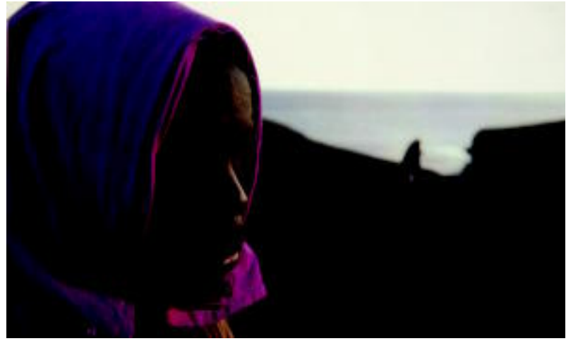
Etorikin honek begirada tristeja jasan duen egoera larriaren adierazgarri da. HITZA

TOLOSA ▶ Immigrazioa eta giza eskubideen jardunaldien baitan, 'Gertutik hiltzea: hondoratze baten sekuentzia' erakusketa dago ikusgai Kultur Etxean