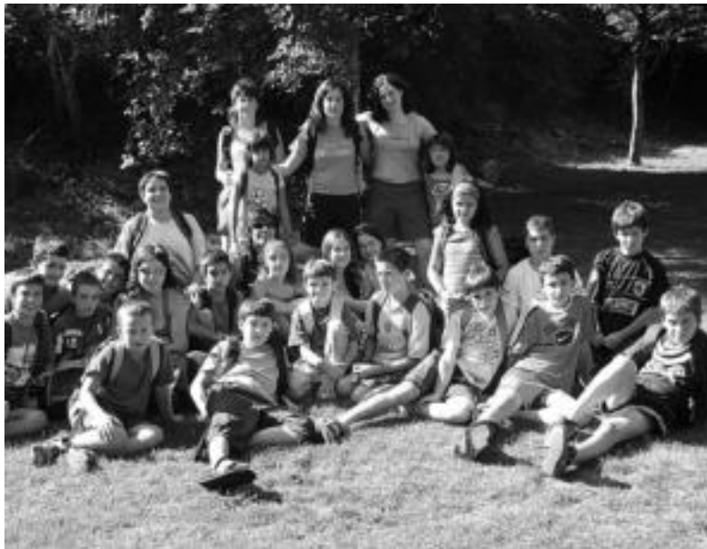
Aurtengo udan Zudairen izan dira Txiribituko haurrak urtero egin ohi den udalekuetan.

12 urte beteko ditu aurten aisialdi taldeak, hasiera zaila izan arren, gogotsu eta indartsu dirau gaurdaino haurrei elkarbitzta irakatsiz