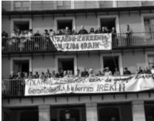
Gerontologikoaren aldekoak larunbatean egindako agerraldia.

Bestalde, sei hilabete igaro dira Tolosako Udalak gerontologiko berri baten aurreproiektua aurkeztu zuenetik, eta orduetik hona, plataformakoen esanetan «ez dugu berri gehiagorik izan, eta arazoak hor jarraitzen du». Datuen arabera, egun, egoera honek, orotara, 1.650 pertsonengan du eragina. Hori dela eta, «berehalako