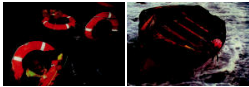
Txalupa txikiak hondoratu egiten dira askotan, euren biziak arriskuan jarrit. HITZA