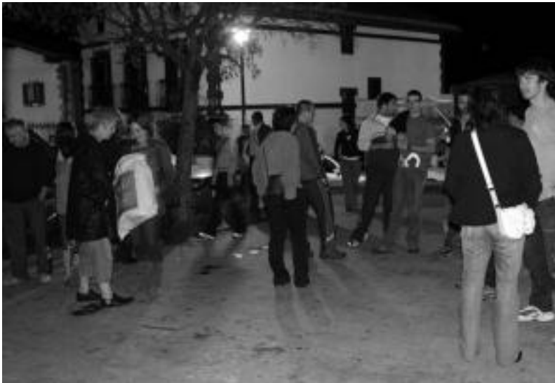
Amasako Martina Sorgina jaitsi ondoren taberna inguruan bildu ziren bizilagunak.

Amasako plazan egongo da jai guztietan zehar; bitartean, Amezketan 'Sanmar Sound Festival' eta Alkizan San Martin eguna iristeko irrikitan daude