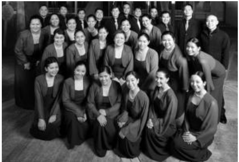
Ateneo Chamber Singers Filipinetako taldea polifonia eta folklore sailean ariko da. HITZA