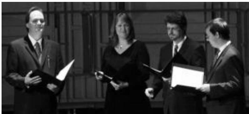
Suitzako Ensemble Vocal Peñalosa, atzo Leidor aretoan. IÑIGO ASENSIO