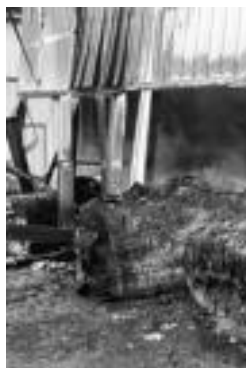
Erretako paper fardea. N. URBIZU

Zauritutako suhiltzaileari dagokionez, erietxean jarraitzen du, eta bere egoera, ebakuntza egin ondoren, «larria baino egonkorra» da.