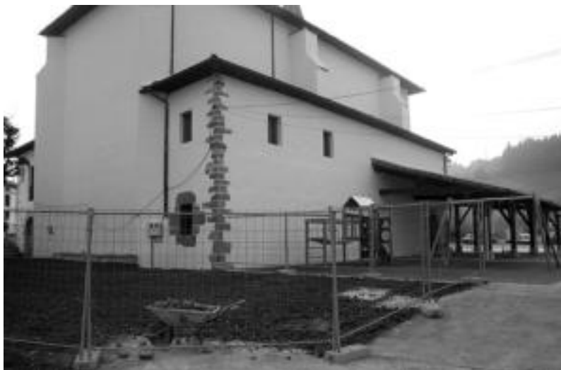
Ikaztegietak eliza bukatuta badago ere, oraindik inguruko detaileekin bukatzea falta da. ENERITZ MAIZ

Landareak udaberria aldera aldatuko dituzte, eta eserleku gehiago jartzeko asmoa dute, baina obrak bukatu dituzte