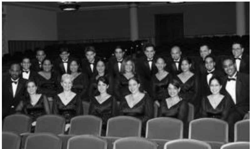
Puerto Ricoko Coralia abesbatzako kideak polifonia eta folklore arloan ariko dira gaur. HITZA