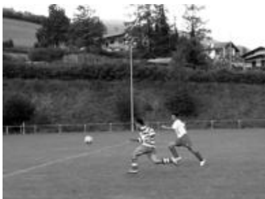
Aurrera denboraldi honen hasieran. J. ASTIBIA

Inazioren aurka jokatu zuten partidari dagokionez, gaizki aritu zirela esan dute arduradunek; «aukera asko sortu genituen, baina ez genuen hauek aprobetxatzen jakin». Leitzarrek gainera hutssegite pare bat izan zituzten, eta hauek baliatuz aurkariek golak sartu zituzten. Partida ez zen nahi bezain garbia izan, arduradunen ustetaz arbitroak asko lagundu bai-