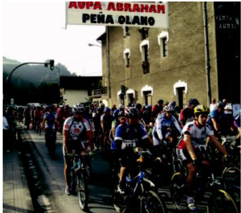
120 lagun inguruk hartu zuten parte mendiko bizikleten XVIII. travesia herrikoian. HITZA

TOLOSA ▶ Hainbat ekitaldiz osaturiko egitaraua izan dute asteburuan Olarrain auzoko jaien baitan; jendetsuena, mendi bizikleten travesia herrikoia