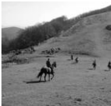
Paisaia. Txoko zoragarriak ikusi dituzte. HITZA