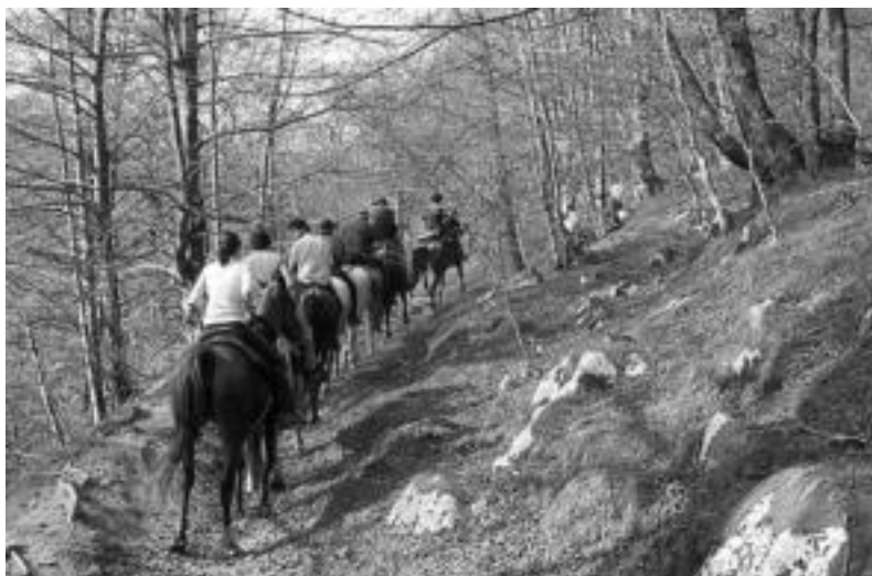
Ibilbidea. Santa Krutzetik abiatu ziren 65 zaldun ibiltariak, eta Ezkurrako mendiak pasa ondoren, Arrarasen egin zuten hamaiketakoa. Arratsaldean iritsi ziren Beintza-Labaienera.