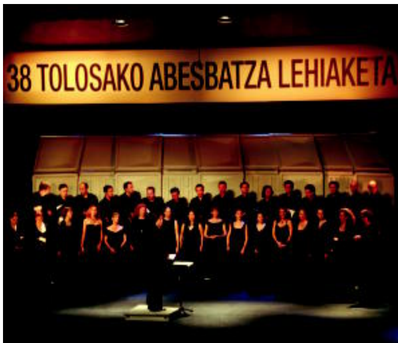
Accentus koru frantziarrak eskaini zuen atzo lehiaketaren inaugurazio kontzertua. E. EZEIZA

TOLOSA ▶ Polifonia eta Folklore ataletan ere lehiatuko dira helduen abesbatzak, Leidor aretoan ▶ 2,3