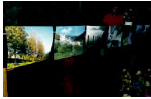
Auzoko argazkien erakusketa jarri zuten ikusgai. HITZA

▶ HITZAK ez du bere gain hartzen egunkarian adierazitako esanen eta iritzien erantzukizunik.