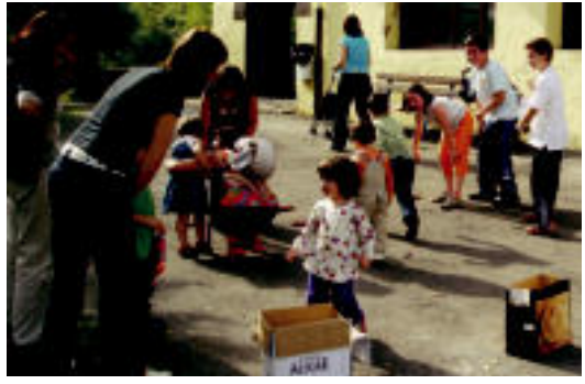
Haurboek ederki igaro zuten jolasetan. HITZA