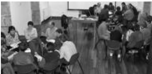
Abaltzisketan urriaren 20an aurkeztu zuten zirriborroa. HITZA

Bozue 21ek bilerak egingo ditu, urtean zehar egindako diagnostikaren zirriborroa aurkezteko