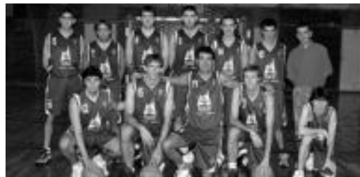
La Salle Bilbao taldea izango dute aurkari tolosarrek asteburuan.