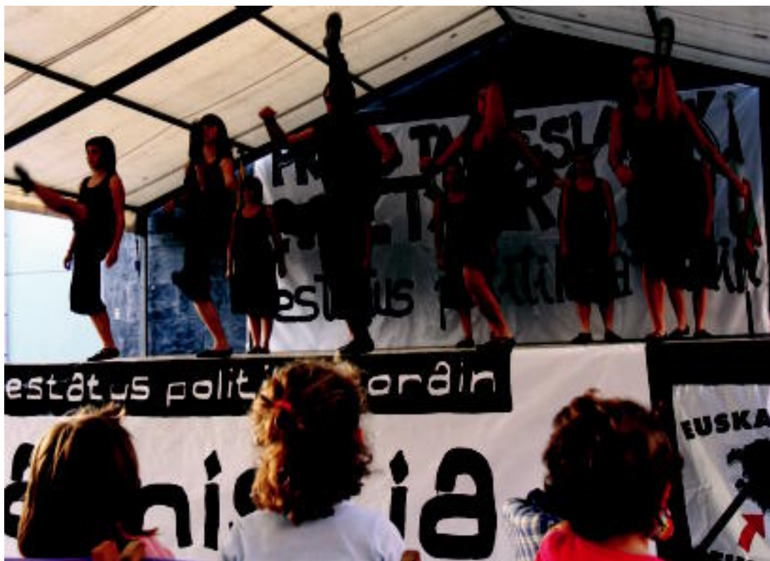
Herriko dantzariak emanaldia eskaini zuten bazkalostean, plazan; aurretik, herriko hiru elkarteetan bazkaldu zuten bertaratuek. M.SOROA

ELKARTASUN EGUNA ▶ Mindegiaga, Aramendi, Aranalde eta Ijurko izan zituzten gogoan atzoko ekitaldietan, «estatus politikoaren alde» ▶ 6