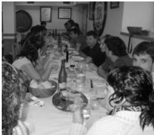
Sendi Ekintzan, Xeplan eta Deportibon egin zituzten bazkariak. HITZA

Gutzira 150 lagun inguru izan zen bazkaltzen hiru elkarteetan banaturik.