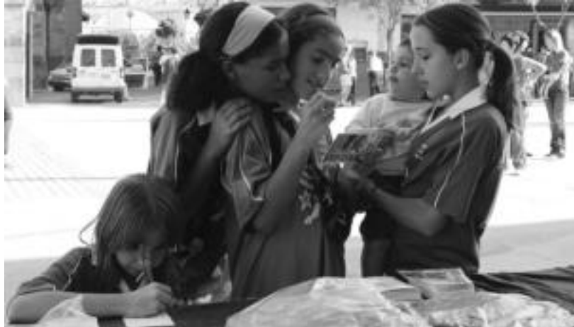
Herriko gaztekoen ere parte hartu zuten Elkartasun Egunean herriko presoek postalak idatziz. MADDI SOROA

Elkartasunarekin jarraituz, Ibarra eta Orendainen arteko herri kirol lehia burutu zen plazan. Ikuskizun bizi eta giro alaiean jo ta su aritu ziren gazteak nor baino nor gailendu. Gorputza nekatu ondorenean batzuk, eta ikuskizunaz gozatu ondoren besteak, bazkariaren txanda heldu zen 14:00etan. Xepla, Sendi Ekintza eta Deportiba elkarteetan izan ziren bazkariak, herriko elkarteek ere presoek elkartasuna adierazten dietenaren islada gisan.