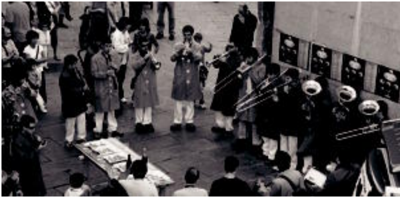
Bonberenea txaranga Triangulon, kalea alaitzen. N. GARZIA