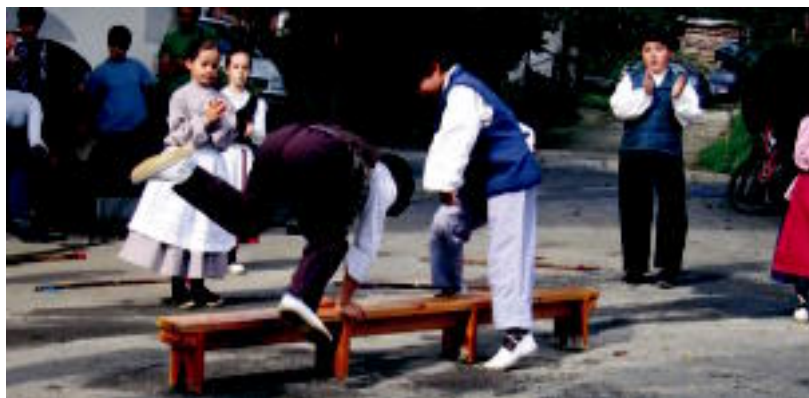
Ikaztegiatiko dantzari txikiak emanaldia eskaini zuten larunbatean. NEREA URBIZU

ALDABA ▶ Larunbatean Aldabako Ugane auzoan, urtero moduan, egun beteko jaiak antolatu zituzten. Hango giroa azpimarratu dute auzokideek