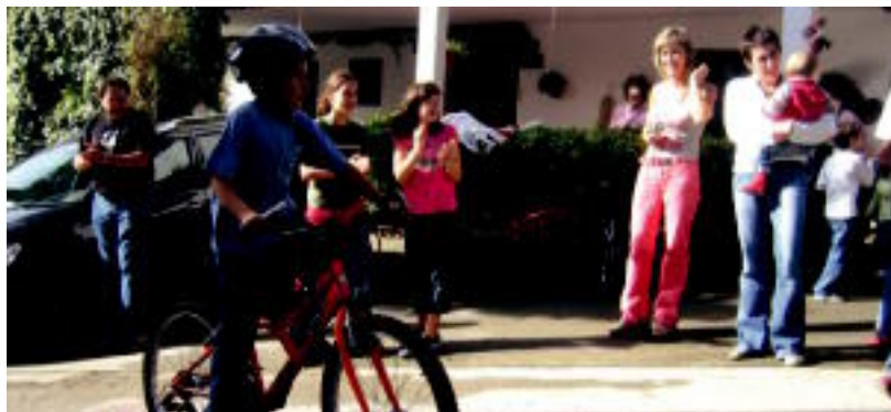
Uganeko 8. Txirindulari Igoeran, hainbat gurasok eta gaztetok hartu zuten parte. NEREA URBIZU