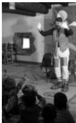
laz, pailazoak Orexan. m.s.s

16:30. Haurrentzako jolasak eta ondoren merienda.