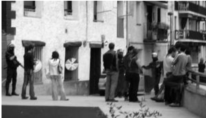
Ibarra Subegi 'herriko tabernan', herritarrak eta Ertzaintza, miaketak egiten ari ziren bitartean. HITZA