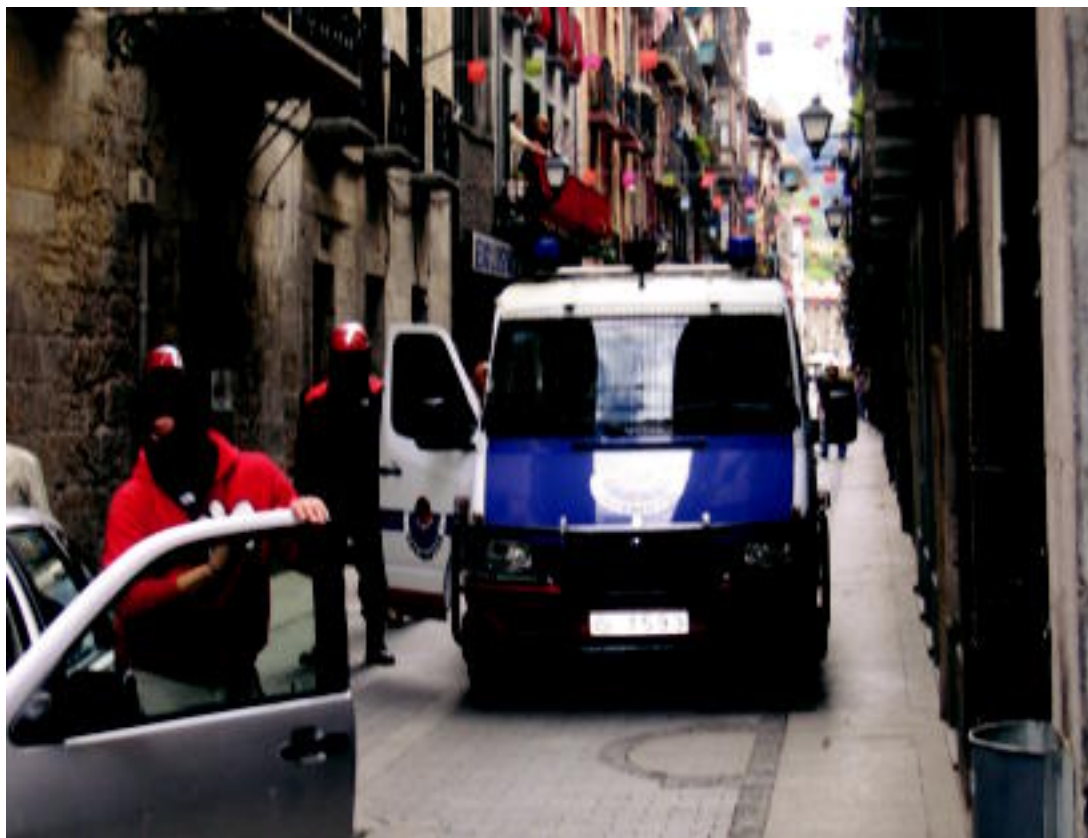
Tolosako Intxurre 'herriko taberna'-n egin zuen Ertzaintzak atzo arratsaldeko lehenenengo miaketa.