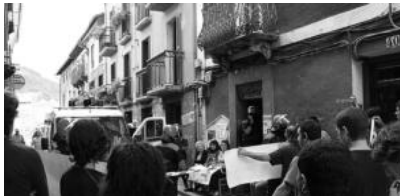
Villabonako Iratzar 'herriko tabernaren' aurrean Ertzaintzaren ekintza salatu zuten herritarrek. N. URBIZU

Ibarra Subegi herriko tabernara joan ziren agenteak nahiz bertan zeuden herritarrak. Ekintza honen aurrean 'herriko tabernetako' arduradunetako batzuk salatu nahi izan zuten «bake prozesuan gauden honetan nola den posible Euskal Herriko seme batzuk Espainiako legeak jarraituz horrelako ekintzak egitea». Ondoren, eskualde mailako erantzun bat datorren egunetan emango zutela ere adierazi zuten.