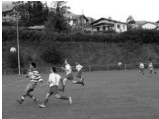
Aurrera taldea aurreko partida batean.

Leitzarrek gogotsu atera ziren zelaiera hasieratik, derbia baitzen, eta partidu konpletoa jokatu zuten. Horrelako emaitzik ez zuten espero inondik inora, «aurreko urteetan Lekunberriren aurka partida gogorrak egokitu zitzaizkigun eta