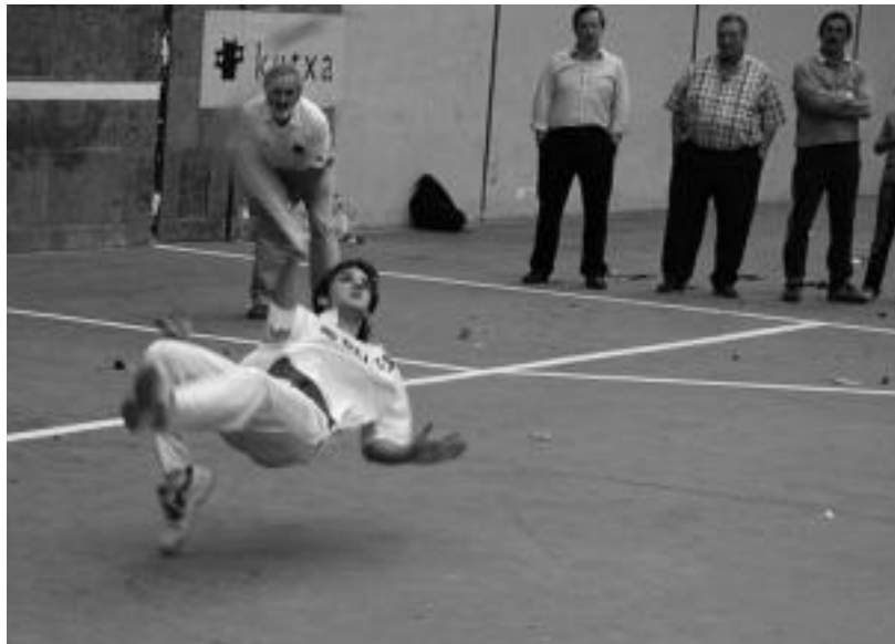
Goputzarekin mugimendu ikusgarriak egin zituzten erreboteko jokalariek igandeko partidan. HITZA

400 lagun inguru izan ziren partida ikusten, parekotasun handia eta, ondorioz, emozio gehiago izango zelakoan. Hala ere bigarren aukera izango dute, azaroaren 5ean bi taldeak berriro lehiatuko baitira Villabonan, Erreboteg egunean egin ez zen partida jokatzeko.