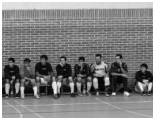
Sailkapen orokorreko 2. postuan da Ibarra 16 punturekin.

3-5ekoarekin partida garrantzitsua irabazi zuen Ibarrak kantabriako Muriedasen aurka