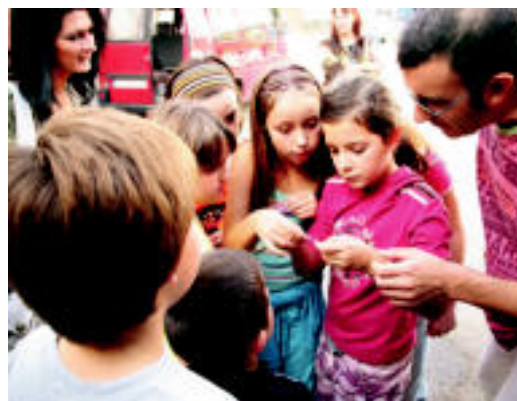
Haurren jolasen aurretik altxorraren bila aritu ziren lau taldeko. N. U.

Ferialekuan eta inguruan jolas guztiak egin zituzten: helduagoak musean aritu ziren