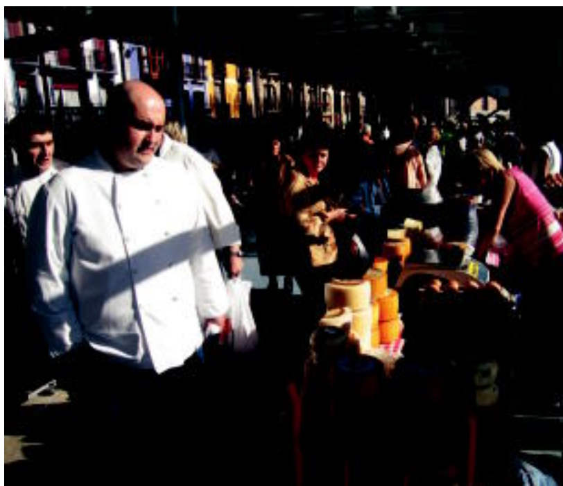
Eskualdeko sukaldariak atzo, Zerkausiko aurkezpenean. NEREA URBIZU

INAUGURAZIOA ▶ Eskualdeko hainbat sukaldarirekin batera egin zuten atzo Zerkausiaren inaugurazioa ▶ 5