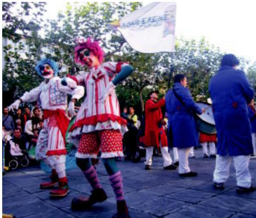
Pirritxek eta Porrotxek Maite Zaitut kanta dantzatu eta abestu zuten Trianguloan, txarangakoekin. N. U.

TOLOSA ▶ Haurrek pazientzia handiz itxoin duten eguna iritsita, badute Bonberenean aurkezturiko pailazo maitagarrien DVDa eskuragarri