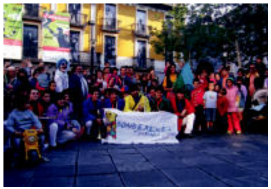
Haurrak, txaranga eta pailazoak argazkirako prestatu ziren. N. U.

Txikientzat Bonbereneako aurkezpena pisutsu samarra izan bazen ere, azkar ahaztu zitzaizen, globoak eta posterrak banatu baitzituzten. Txarangarekin bukatu zen aurkezpena.