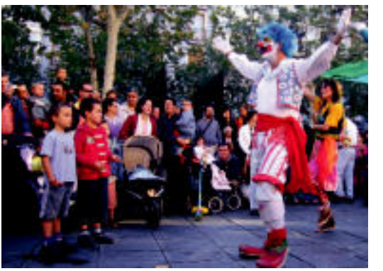
Haurrek lotsa eta emozioaren arteko nahasketa sentitu zuten. N. URBIZU