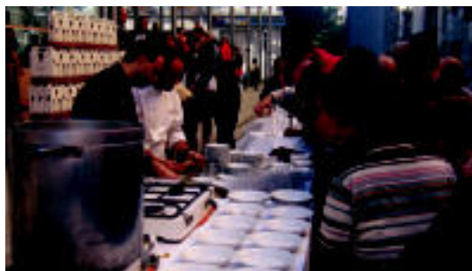
Zerkausiaren ondoan bi sukaldarik jatekoak zerbitzatu zituzten. N. U.

Txorixoa, salda eta onddo-nahaskia izan ziren jateko; postuetan, jateixe askotako sukaldariak izan ziren