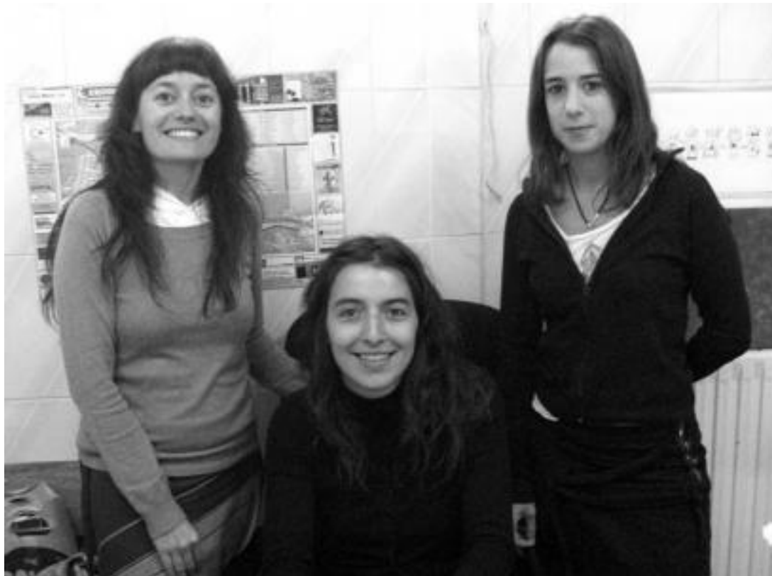
Silpesek Tolosan dituen hiru langileak. Ezker-eskuin: kudeatzailea, zeinu-hizkuntza interpretea eta aholkularia, hurrenez hurren. NEREA LIZARTZA

Amaroz auzoan dago elkarte; pertsona gorrei lan munduan dituzten zailtasunak gainditzeko laguntzen diete bertan lan egiten duten profesionalak