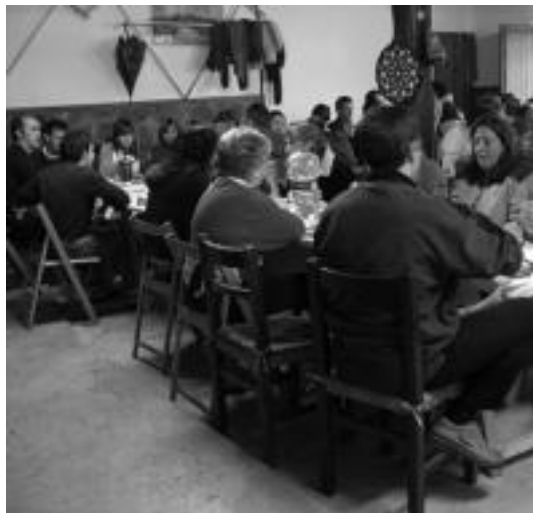
Aurten katerin zerbitzua izango da auzoko bazkarian. OLAIJA ESKITXABEL