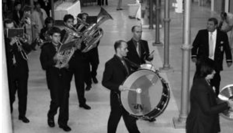
Tolosako Musika Bandak Zerkausiaren inaugurazioan eskaini zuen emanaldiko unea. MADDI SOROA

Zerkausi berrituko beirazko egituraren barnean eskainiko dute emanaldia bihar; 'Tolosa-Irailaren 13a' joko dute