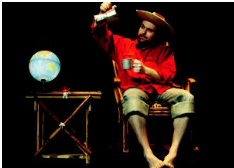
500 haur inguruk ikusiko dute atzo eta gaur artean Kafe Haurra antzezlan. HITZA