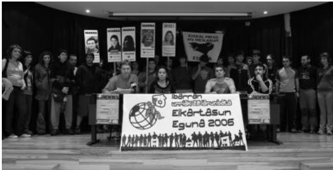
Herriko hainbat gaztek, Elkartasun Egunean parte hartzeko deia egin zieten ibartarrei herenegun emandako prentsaurrekoan. MADDI SOROA

Elkartasun Eguna antolatu dute, ekitaldi ugari osaturiko egitararekin