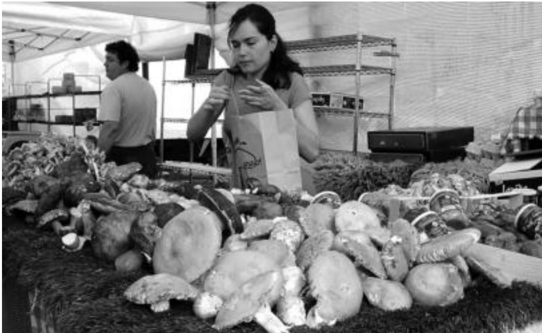
Onddoak salgai, Tolosako larunbateroko azokan.

Azken urte hauetan udazkena iristen denean mendiko txokoak erabat masifikatzen dira; aparkatzeko lekuren bat topatzea ere ez da erraza izaten