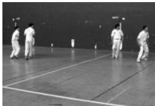
Aurrera-Saiaz eta Zazpi-Iturri jokalariek askotan lehiatu dira. N. U.

Aurrera-Saiaz eta Zazpi-Iturri lehiatuko dira Beotibarren, seniorretan eta jubeniletan