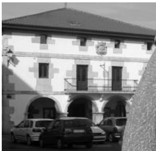
Abaltzisketako udaletxeko ordezkariak bileran izango dira. O. ESKITXABEL

«bihar bilduko diren artean osatzen diren hiru taldeak dira, eta hauek gai ezberdinak jorratuko dituzte. Ondoren, denak berriz bildu eta azken emaitzak jasotzen ditugu».