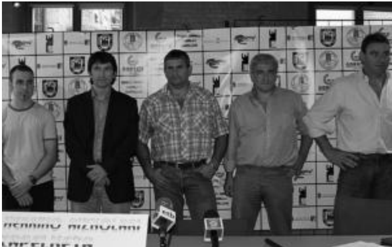
Larretxea, Olasagasti, Txapartegi eta Azurmendi aizkolaria antolatzaileekin batera, atzo. E. EZEIZA

Aurten, lehenengo aldiz, aizkolarari bakoitzak emanen dituen kolpeak kontatzeko pertsona bat jarriko dute bereziki