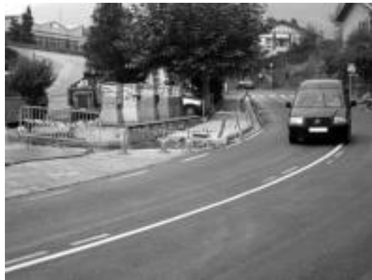
Errepidearen espaloian obrak burutzen ari dira. I. GARCIA

Zizurkildarrei errepideak eragiten dien «arazoari» irtenbidea aurkitzeko ahalegina izan da Udalak egindakoa. Lazkanoren hitzetan, «beste herri-