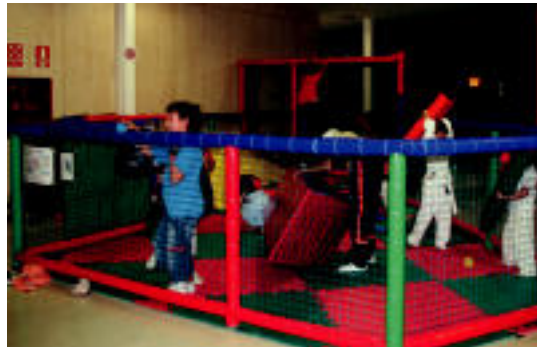
Edaritegi-jatetxeaz gain, haurrentzako txokoa ere badu. E. EZEIZA