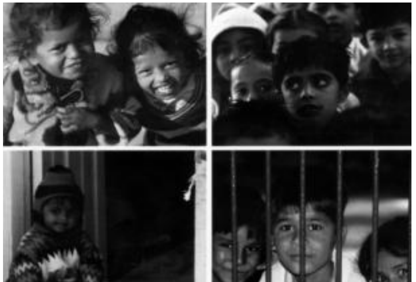
Ibarratik misio taldeak Indiara egindako bidaietan ateratako argazkiekin egindako bilduma; irudian Indiako haurrak ageri dira. IBARRATIK MISIO TALDEA

Eztabaida. Azkenaldian, Euskal Herriko Gazteak ez daude egoera onean, hustuketak, eraispenak... Orain, Villabonako Onddo Gaztearegi egokitu zaio Gaztearegi utzi behar izatea. Zer derituzue? Zergatik itxi nahi dituzte? Egoera onek ba al du irtenbiderik? Sartu gure webgunean eta eman ezazu zure iritzia, eztabaida atalean.