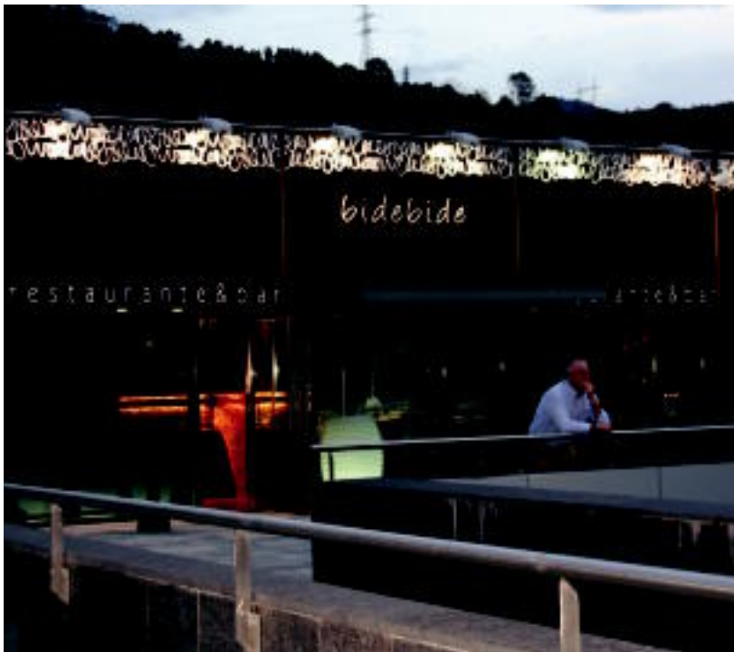
Bidebide izenpean, Usabal kiroldegiko bigarren solairuan dago kokatuta. E. EZEIZA

TOLOSA ▶ Herenegun, arratsaldeko zazpietan ireki zituen ateak Usabalgo bigarren solairuan kokatuta dagoen Bidebide edaritegi-jatetxe berriak