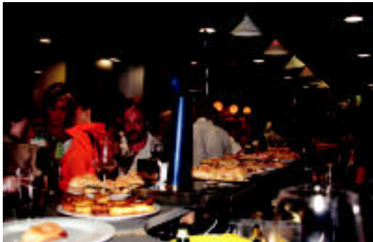
Jende ugari bildu zen herenegun egindako inaugurazioan. E. EZEIZA

▶ HITZAk ez du bere gain hartzen egunkarian adierazitako esanen eta iritzien erantzukizunik.