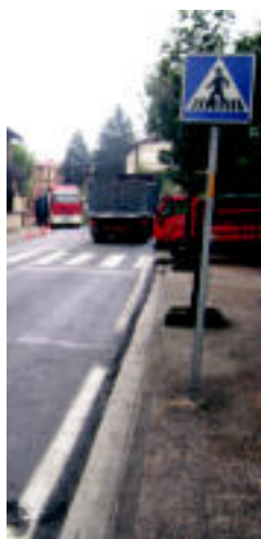
Elbarrenako errepidea. HITZA

IBARRA ▶ Ibarrik misio taldeak Gabonetako sei postal jarri ditu salgai lau herrialdeetan dituen proiektuak bultzatu ahal izateko ▶ 6