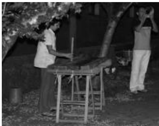
Ekitaldiari txalaparta eta adar soinuekin eman zioten hasiera. E. EZEIZA

Ekitaldiari txalaparta eta adar soinuekin eman zioten hasiera. Jarraian tolosar batek hitz egin zuen, orain dela 23 urte gertatutakoa oroitzuz eta hara hurbildutakoei eskerrak luzatuz. Ondoren, aureskua dantzatu zuen dantzariak, eta Joxi eta Joxeanen amek lore eskaintza egin zuten. «Une hun-kigarri» horretan, txalo zaparrada batekin erantzun zuten bertaritutakoei.