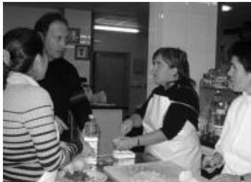
Iaz ere munduko sukaldaritzari buruzko ikastaroa izan zen. HITZA