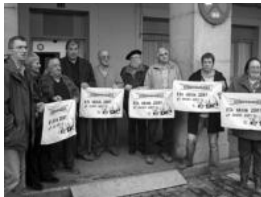
Eta orain zer? Gerontologikoaren itxieraren aurkako plataformak. N.L.

Gerontologiko zaharra itxi eta gero, honen aldeko plataformak emandako datuen arabera, «itxaron zerrendetan dauden eta dagoeneko beste eskualdeetako erresidentzetara bidali dituzten pertsonen kopurua 60 baino gehiagokoa da». Eta aldi berean, egoitza zaharrak, 60 pertso-