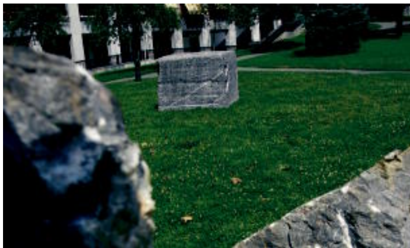
Zabalarreta parkean kokatu dituzte Kantu isila erakusketaren eskultura batzuk. LEIRE MONTES

TOLOSA ▶ Urriaren 31ra bitarte herritarrek Koldobika Jauregiren 15 eskulturen artean gogokoena aukeratzeko txartelak eskuragarri jarri ditu Tolosako Udalak