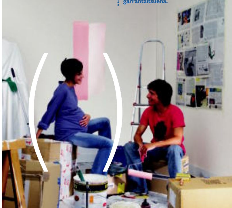
"Biharko Vida y Pensiones, S.A."-rekin kontratatutako Kutxa Bizitza-Asegurua. Kutxa da bere erregistroan 02 zk.az ageri den aseguru agentziaren sozietatea.

Guretzat ere zure familia baita garrantzitsua.