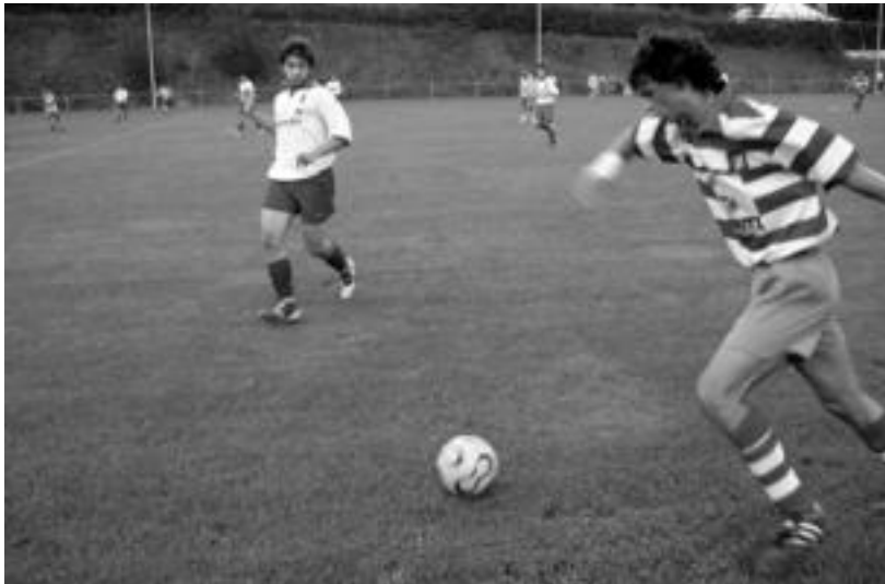
Aurrera Taldea denboraldiko lehenengo partidari. J. ASTIBIA

Hagitz gol polita sartu zuen bigarren zatian: kanpo erditik abiatu eta defentsak saihestuz gola sartzea lortu zuen