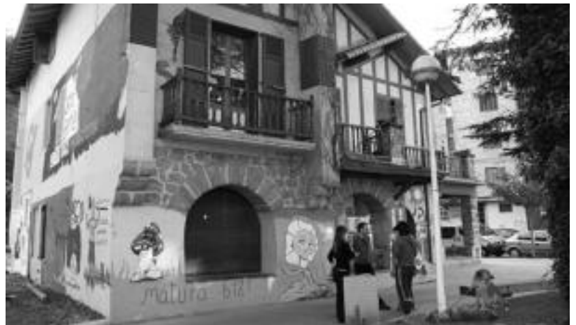
Onddo Gazte Asanbladako zenbait kide, atzo goizean, Urdapilleta etxearen aurrean. MADDI SOROA

Herenegun bukatzen zitzaien epea eraikina hustutzeko, baina Gazte Asanbladakoek ez dituzte beraien gauzak atera