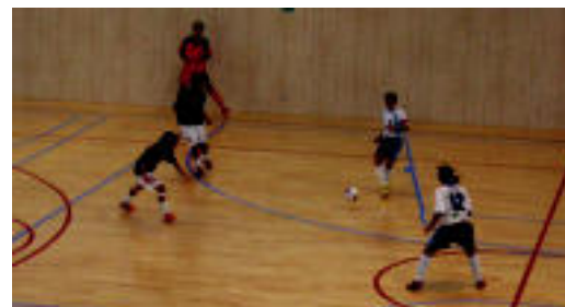
Mostolesen aurkako partidako une bat. HITZA

Bihar jokatu du hurrengo partida areto futbol taldeak, Madrilen ▶ 3