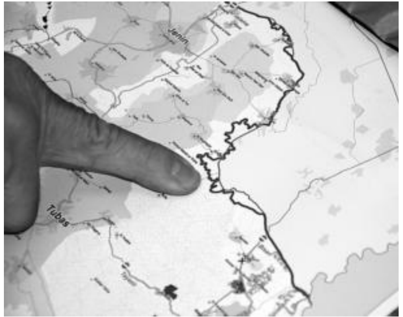
Iparraldetik ere, harresiek palestinarren lurra murrizten dute. I.ASENSIO