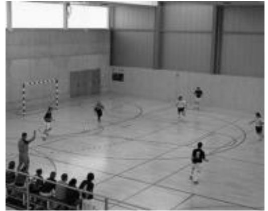
Hegoaldeko jokalariek kiroldegi berrituan. ESTI EZEIZA