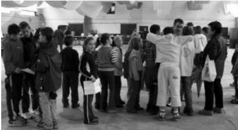
lazio Kultur Asteko irudia, gazteboenak altxoraren bila jokoan. OLAIJA ESKITXABEL

San Estebanek «merezki duelako eta ondo pasatzeak preziorik ez duelako», herritar guztiak animatzen dituzte bertan parte hartzera.