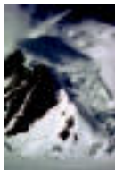
Gili, Karakorumen. HITZA

lehen arketak hasi zituzten. Pikanaka altuera hartzen joan ziren. Lehen egunean Platara iritsi ziren, 5.700 metrofara.