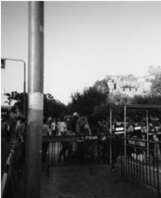
Jerusalemgo gune historikoaren sarbidean Israeldarren kontrolak. J. A.