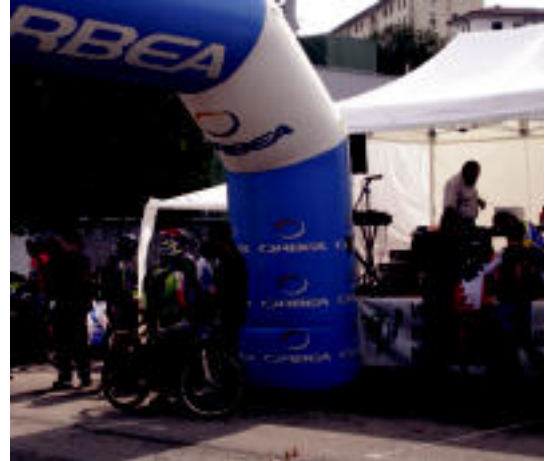
Maratoiaren helmugan zenbait txirindulari. N. GARZIA