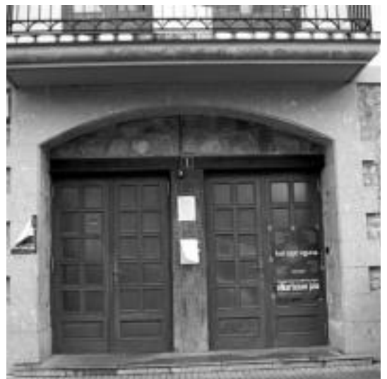
Iriarte taberna eta jatetxearen sarrera. I. GARCIA

Iriarten orain arte taberna eta jatetxea egon da. Kultur etxe bezala ere funtzionatu du eta hainbat ekitaldi ezberdin egin dituzte bertan. Liburutegia ere badago eta San Millan eskolako haurrek bertan jasotzen zuten jangela zerbitzua aurtengo ikasturtera arte.