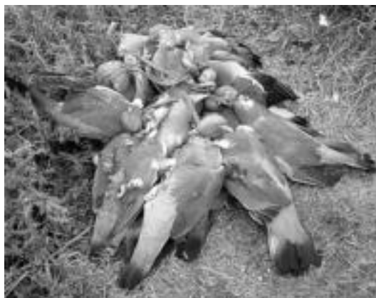
Pagauso. Udazkenean ehiztari gehienentzat pagauso da preziatuenetarikoa. Irudian, Leiztan ehizatutako uso multzo bat. HITZA

Isiltasuna entzun du hiru ehiztariak une batean, walkie-talkitik uso talde «polit» bat altxatzen hasi dela esan baitute.