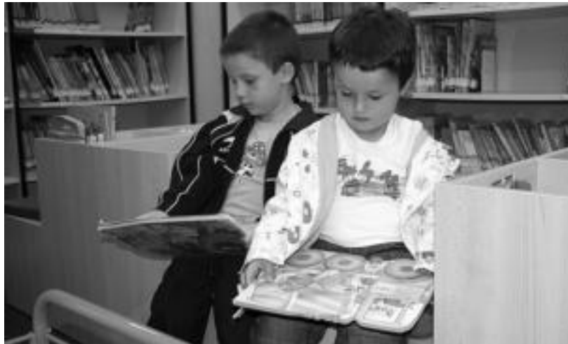
Bi haur Anoetako Udal Liburutegian irakurtzen. I. GARCIA

Liburutegien arteko maileguz dagokionez, hau da, sareko partaide diren beste liburutegietara bidalitako aleak, kanpoko bazkideen sei eskaerei arreta egin zaie. Bestalde, 18 titulu jaso dira, horietatik 3 Donostiako Koldo Mitxelena Kulturuneari dagozkie eta gainontzekoak beste liburutegietatik jasotakoak izan dira. Lehen Koldo Mitxelenara soilik eskaerak luzatzeko aukera zegoen