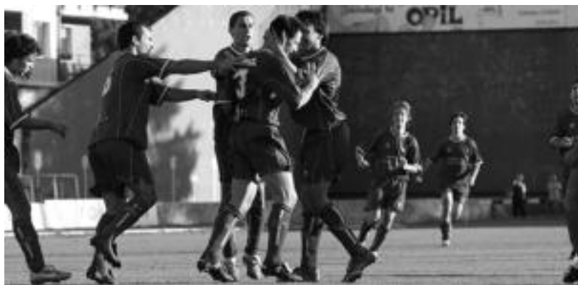
Bigarren gola ospatzen. M. SOROA

Askok arriskatu eta berdinketa lortu arren, amaieran argi utzi zuten tolosarrak emaitzarekin ez zirela pozik gelditu