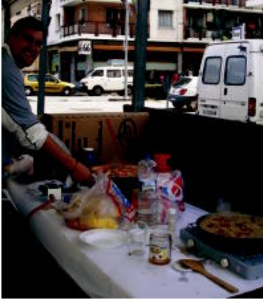
Berazubiko bizilagunek prestatu zuten paella jatea.

Joxe Angel Pradini antolatzailaren arabera 70 inguru txirindularik hartu zuten parte, eta 45 kilometrotakoa izan zen ibilbidea. Txirindulariek ez zuten dortsalik jantzi, hau da, federatua egotea ez zen beharrezkoa bertan parte hartze-ko, azken finean maratoia herrikoia baitzen: edonork harrezakeen parte. Aitor Olano eta Ugaitz Artola iritsi ziren lehe-