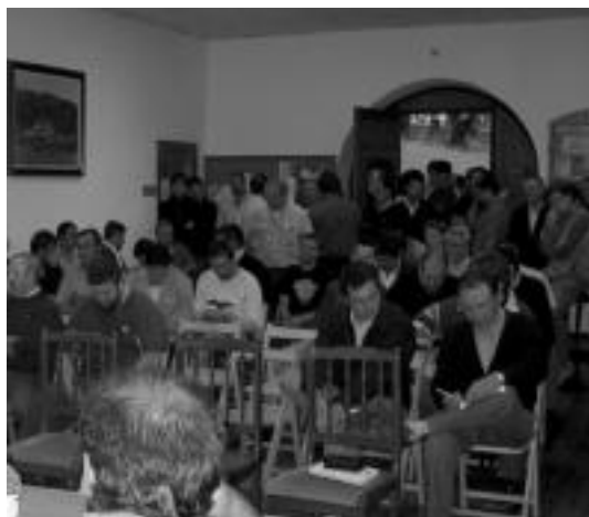
Ehiza postuetako enkantea. Areson bitan egiten da enkantea. Bertan jende asko biltzen da: aurten lehengo urtean baino gehiago, eta denak 27 postutatik baten bat erosteko.