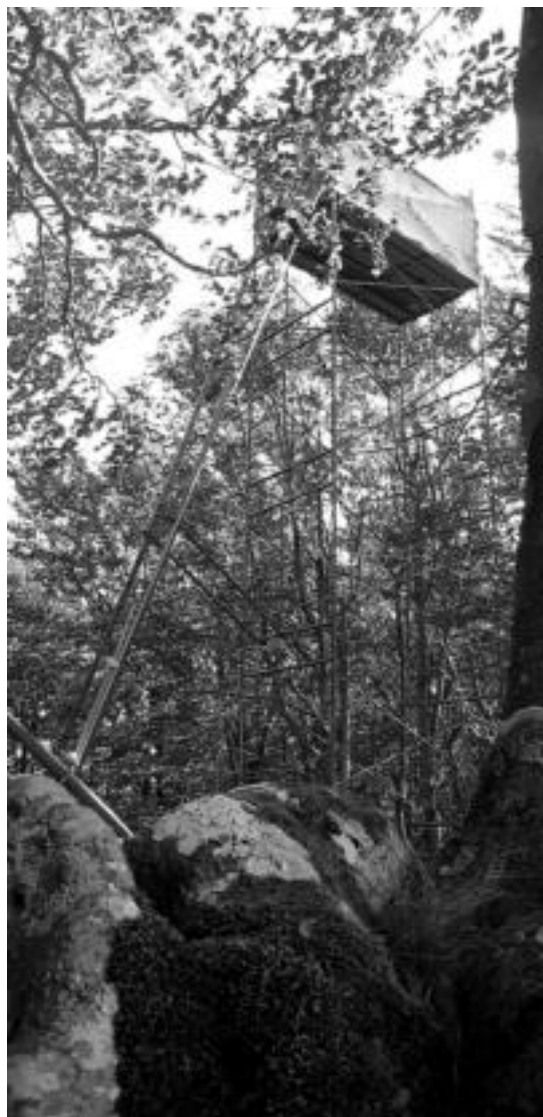
Postua, zerua ukitu nahian. Usoetan aritzeko gehienetan postuek zuhaitzen altuera hartzen dute, zeru zati garbiak errazago ikusteko, eta nola ez, uso-taldeak datozenean eskopetak prest izateko. N. URBIZU

tan hiltzea kaltegarria da oso, usoek kumea egin behar duten garaia baita».