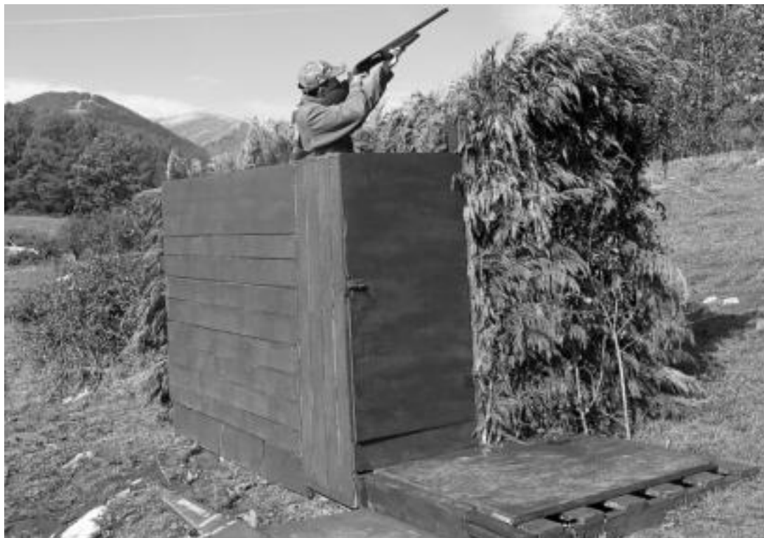
Ehiztari bat eskopeta eskuan hartuta, pagauso taldea pasatzen denean ehizatzen prest. HITZA

Ehiztariek, biologoek, eta mendia maite duten guztiek dituzte usoak gogoko, baina ez modu berean; alde batekoek dibertitzeko, beste batzuek, aldiz, udazkeneko zeruaren jabe direla ikusteko