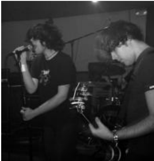
Moksha, musika talde kataluniarra kontzertu batean. HITZA

Kashbad-eko abeslari ohiarekin batera, Moksha talde kataluniarra ariko da bihar, 22:30etik aurrera