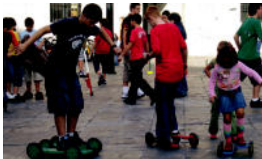
Igandean gazteek ederki igaro zuten Triangulo plazan. NEREA LIZARTZA

Azokan egin beharreko «lan handia» azpimarratu ohi dute antolatzaileek, baina, antza, lan horrek eman du bere fruitua, «iganderako ia garagardo guztia bukatua baitzegoen». Horretaz gain, 4 taldeen artean banatu beharreko irabaziak ere espero bezalakoak izango direla esan nahiko du horrek.