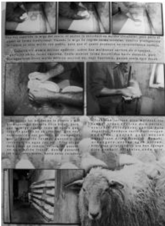
Artzainak duenn ardientzako ebolan ardietako bat jezten. IÑAKI VERGARA