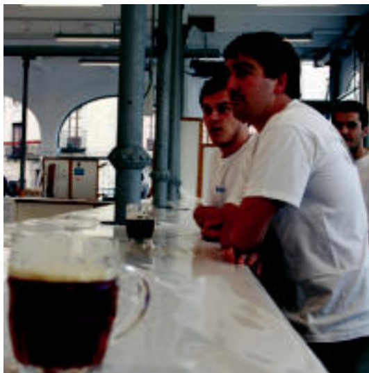
Zerkausi eraberritua hartu du Garagardo Azoka. NEREA URBIZO

Ostegun arratsaldean atzerapenez ekin zion Festak, «arazo txiki batzuk» tarteko. Dena den, bere ateak ireki, eta jendea erruz hasi zen bertaratzen garagardo mota desberdinak dastatzera. Osteguna izan zen antolatzaileen arabera egun lasaia, baina ostiralean, larun-