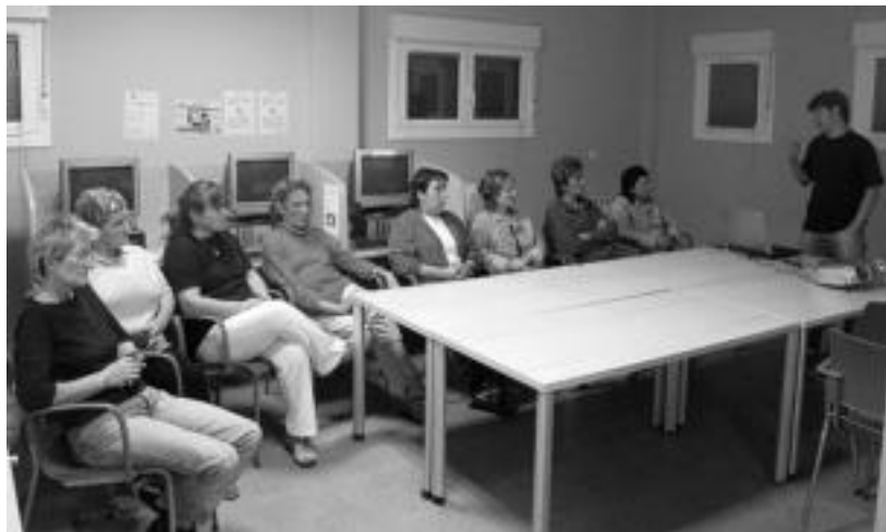
Irailaren 26an Nola kontsumitu garapen iraunkorraren ikuspegitik izeneko hitzaldia. N. URBIZU

Adin guztietako herritarrek hartu dute parte iraileko azken astean gauzatutako Bidegoiango XVII. Kultur Astean