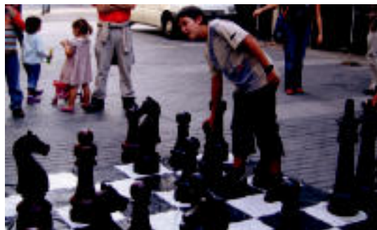
Plaza Zaharrean ere egin zituzten jokoak. N. LIZARTZA