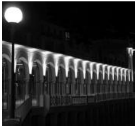
Urtarrila. ANGEL ALONSO