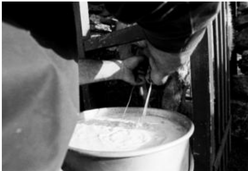
Informaziozko testuekin lagundu du Vergarak erakusketa. MADDI SOROA