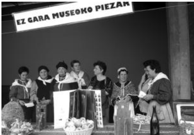
Iazko Azoka Berezirako EBELkoek egindako aldarrikapen saioaren une bat.