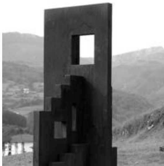
Juan Gorritiren Baserriko Argia eskultura. HITZA

Beka martxan zegoela eta baserrien inguruko argazki bilduma osatzea zela helburua «kanpotik» jakin zuen EBELk. «Zertan laguntzen die horrek emakume baserriarrei?», gal-