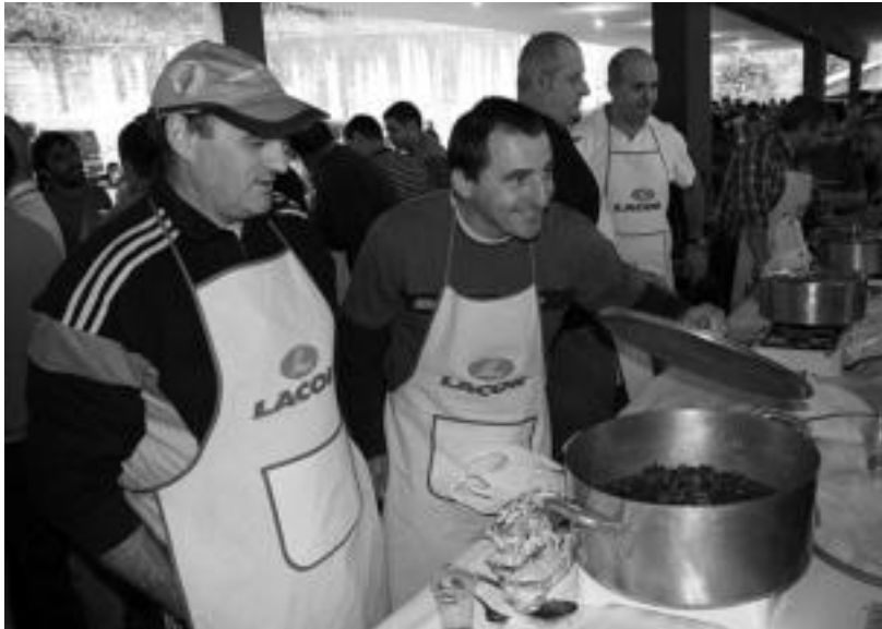
Isats gisatuan bederatzik elkartek hartu zuten parte. Irudian, parte-hartzaileetako batzuk. NEREA URBIZU

Isats gisatzailerik onena Amasako Uxo-Toki izan da, eta posturik onenaren saria Zabalegi fruita eta barazkientzat