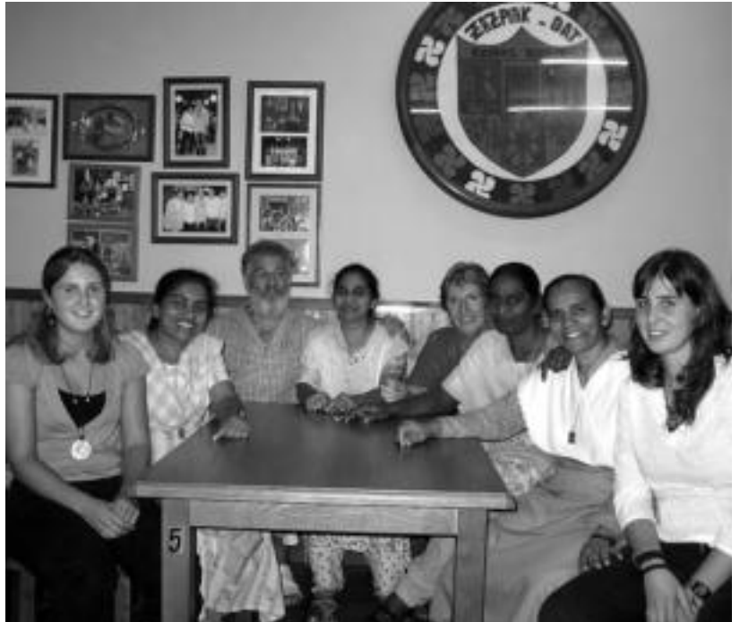
Proiektuan parte hartu duten bi gazteak, monja indiarrek eta Ibarako Misio Taldeko kideak. J. GOIKOETXEA

Gauzak horrela, proiektua abian da jada eta Amondarain eta Esnaola abenduaren 30era bitarte behintzat Indian izango dira euren ezagutzak bertako en egoera hobetzeko balio dezan eta bide batez, ahal duten guztian laguntzeko. Agian historia hau ezagutu ostean egongo da norbait barruan zerbait sentitu duena eta gisa horretako proiekturen baten bidez bere elkartasuna beharrean diren tokiren bateko jendearekin banatu nahi duena. Horrelako kasuren bat balitz, interesatua Ibarako Misio Taldearekin jarri daiteke harremanetan eta beraiek euren esku dagoen guztia egiteko prest daudela adierazi zuten jendearen ametsak egi bihurtu ahal izateko.