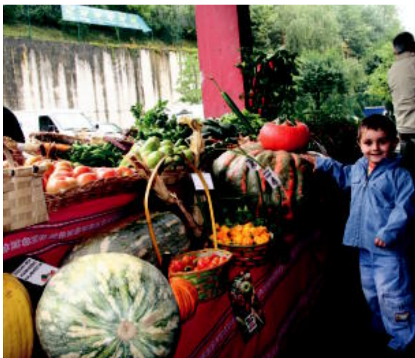
Postu onenari saria irabazi zuen Martuteneko Zabalegi baserriak, postu honi esker. N. URBIZU

SARIAK ▶ Amasako Uxo-Toki elkarteak eraman zuen isats gisatuarena; postu onena, Zabalegi baserriari ▶ 4