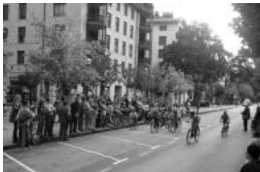
Atzoko Pedalaren Festako irudietako bat. E. EZEIZA

Honez gain, gainontzeko hiru egunetan bezala, nahikoa jan eta edateko aukera izango da Zerkausian. Azken egun honetan, 18:00etan irekiko dira Garagardo Azokako ateak, eta 00:00ak arte egongo dira zabalik. 23 garagardo ezberdin dastatzeko aukera izango du bertaraten denak, eta honekin batera, aurtengo berrikuntza den xajoniar solomoa.