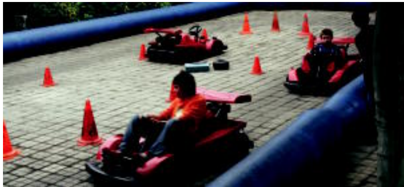
Kart-etan ibili ziren gazteboak. Denek birak eman ahal izateko lerroan ibareron zuten. N. URBIZU

UGARTE ▶ Zaldi lasterketa egin ez bazuten ere, haurrek kalean jarritako eskaintza guztiez gozatu zuten: kart-ez, puzgarriez eta zaldiez