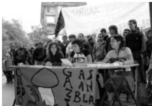
Onddo Gazte Asanbladako kideak, atzoko prentsurrekoan.

Hilaren 15ean utzi beharko dute Urdanpilleta etxea Onddo Gazte Asanbladakoek, Udalarekin «akordiorik eduki gabe»