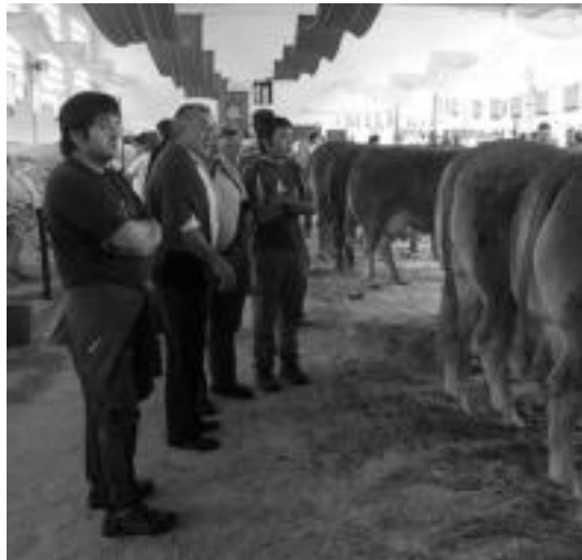
Joan den urteko Probintziako 36. Abelgorri Lehiaketako une bat. i. g.

Gipuzkoako 37. Abelgorri Lehiaketa egingo dute bihar, goiz osoan zehar