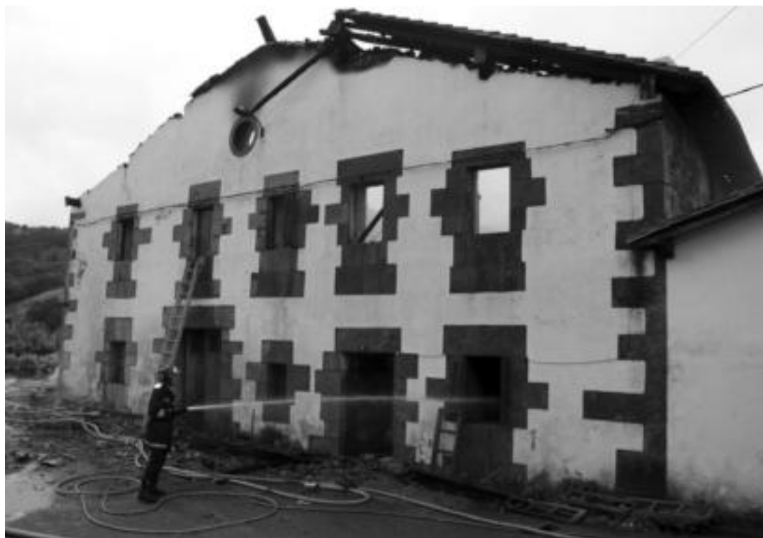
Suhiltzaile bat Arretxe baserriari ura botatzen, atzo eguerdian, su txikirik berpiztu ez zedin kontrol lanak egiten. I. GARCIA

Kalte material handiak eragin ditu, baina bizilagunek ez dute zauririk jasan