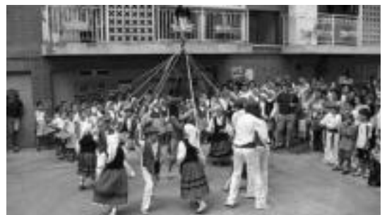
Barne barnetik DVDan, Villabonako jaietako irudiak ikus daitezke. n.u.

izan dute honekin egileek. Hala, Galdarekoen esanetan, «billabonatarrek ere, DVD honetako zenbait irudi ikustean, harrituta geratuko dira, irudi oso lortuak baitira». Lan hau burutu ahal izateko, Galdare enpresakoak, herritarrekin eta taldeekin elkartu ziren, dokumentalean agertzea nahi zute-