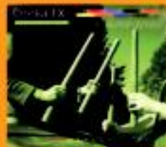
Orreka TX Quercus Enstropina