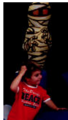
lazko jaiak. M. S. S.

Hiru zaldi ikuskizun, musika emanaldiak eta haurrentzako ekitaldiak antolatu dituzte ▶ 5