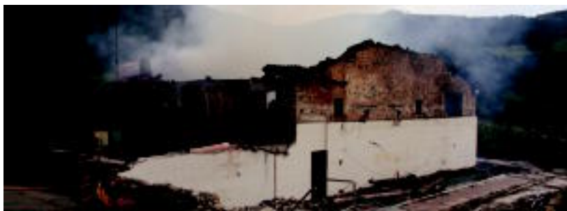
Arretxe baserriaren egoera, atzo eguerdian, aurrealdetik eta atzealdetik, sutearen ondoren. I. GARCIA