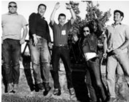
Los Fastuosos de la Rivera taldea gaur ariko da Frontonen. HITZA