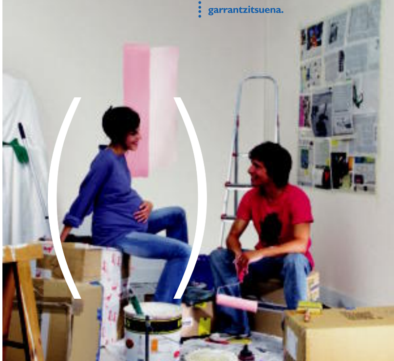
"Biharko Vida y Pensiones, S.A."-rekin kontratatutako Kutxa Bizitza-Asegurua. Kutxa da bere erregistroan 02 zk.az ageri den aseguru agentziaren sozietatea.

Guretzat ere zure familia baita garrantzitsua.