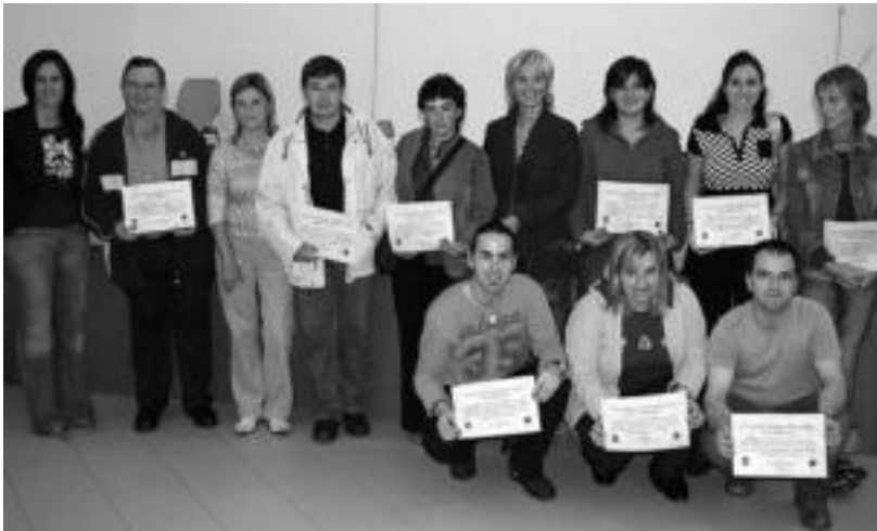
Hitzarmena sinatu duten zenbait merkataritza Udaleko ordezkariekin batera. I. GARCIA

Saltegiatoko karteletan euskarak presentzia izatea eta zerbitzua euskaraz ematea, hitzarmenaren helburuak