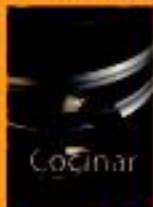
Cocinar de cine Iñaki Gubiernez / J.M. Gubiernez