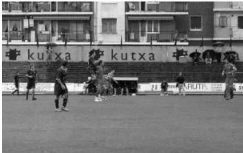
Tolosa CF eta Beasainen arteko norgehiagokaren une bat, larunbatean, Berazubín. NEREA LIZARTZA

Irabazteko aukerak izan arren, «emaitza justua» izan zela dio entrenatzaileak; hurrengo San Ignazio taldearen aurka