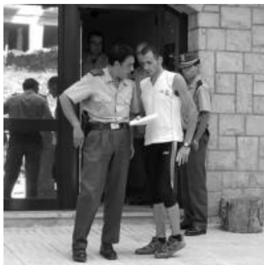
Torlara iritsita, guardia zibil bati azalpenak ematen. IKER KARRERA

Egun batean, 24 orduren buruan, Gipuzkoako mendi ezagunenetakoa, Txindoki, zenbaitetan igo jarri zion erronka bere buruari. Hamaika aldiz jo zuen Euskal Herriko Cervino txikiaren punta. «Ez naiz ibilbide eta erronka laburretara egokitzen; diesela naiz, ez gasolina. Distantzia eta denbora luzeok lanak gustatzen zaizkit, iraupen luzeok», azaldu du amezketarrak. Erronka berriak baditu buruan dantzan; mendia eta korrika uztartuta, noski.