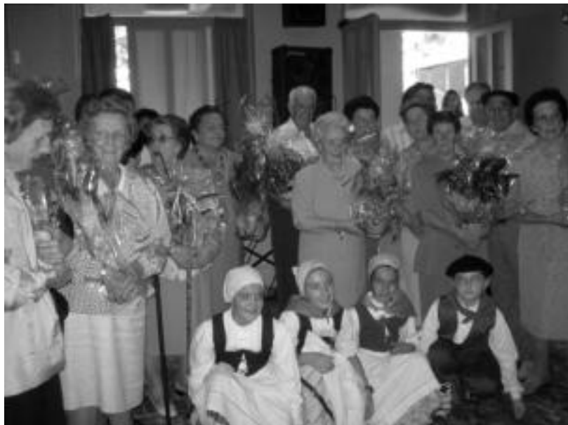
Irurako 80 urtetik goragoko 14 herritarrek landare bana jaso zuten, haiei egindako omenaldian. HITZA

Dena dela, Irurako festetako lehen larunbatean, irailaren 23an hain zuzen, pailazoen saioa ia bertan behera utzi behar izan zutela gogoan izan du, «euri jasa izugarria bota baitzuten bat batean: Pirritx eta Porrrotx aritu ziren kalean saioa egiten, baina utzi egin behar izan zuten». Hau izan da festa guztietan «okerren» joan dena. Dena dela, badute urtea bukatu aurretik berriro ere pailazok Irurara ekartzeko asmoa, egun hartan ilusioz betetako umeen aurpegi horiek berdin ikusteko. «Hasieran bero egi-