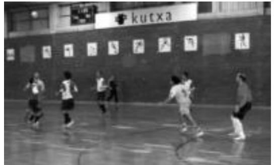
Laskorain areto futbol taldea lehian, partida batean.