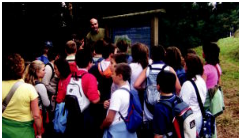
Ikasleek adituekin solasaldian aritzeko aukera izan dute egunotan. HITZA

Aranzadi Zientzia Elkarteak Anoetako Burdin Aroko Basagain herririk indusketak egiten aritu dira egunotan eta eskualdeko ikasleek bisita jaso dute