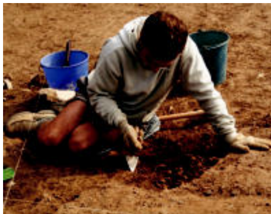
Denbora luzez eserita edo makurtuta aritu behar dute ikerlariek. I.G.

zako eskolako eta Asteasuko Pello Errota eskolako ikasleak izan dira bertan. Gunean dauden sei informazio panelak erakutsi zizkieten Aranzadiko kideek eta zer aurkikuntza egin dituzten azaldu ere.