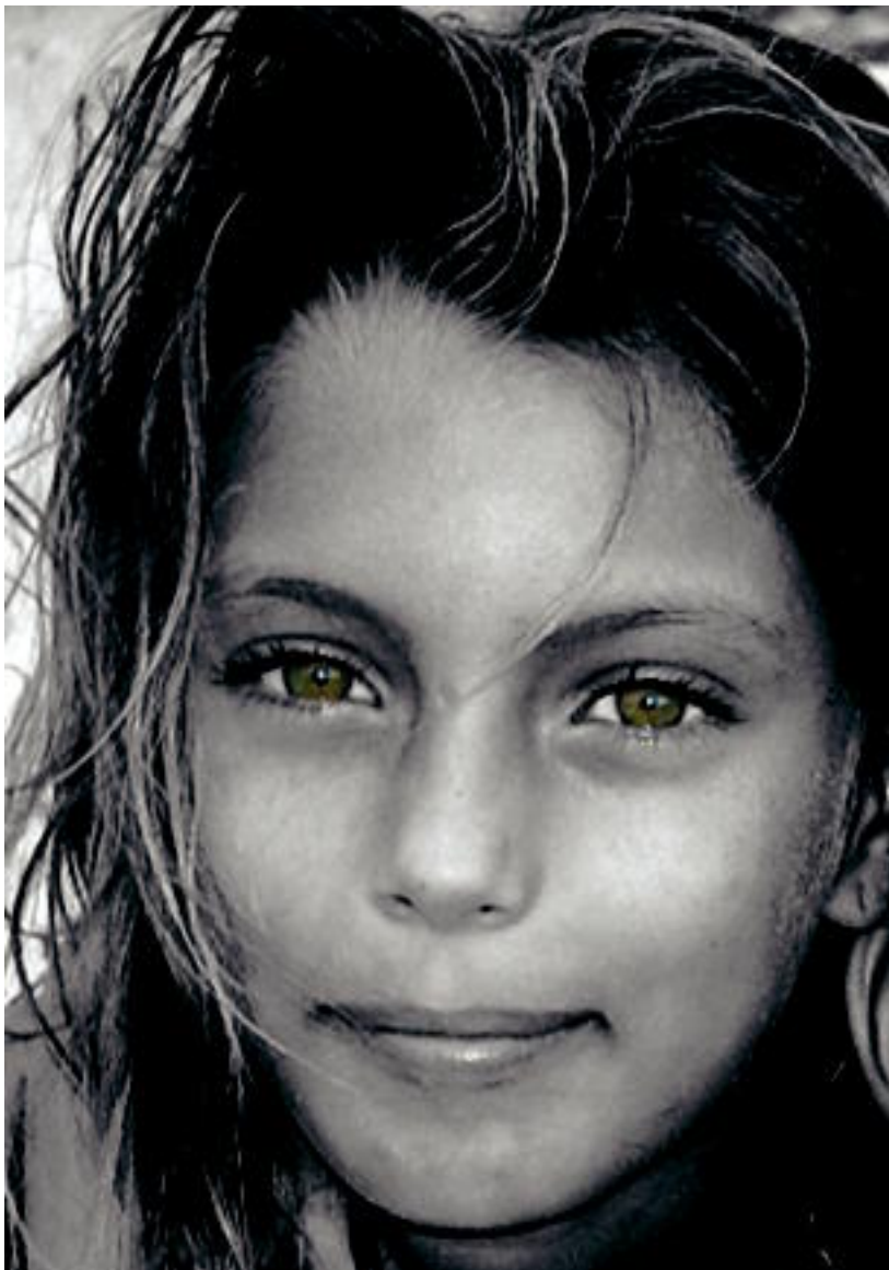
Lehen saria. Neskatxa honen begiradak liluratu ditu HITZAKO irakurleak. URA ITURRALDE

Euskal Herriko landetxe batean asteburu bat irabazi du; bigarren saria, afari bat Zizurkilgo Plaza Etxeberrin, Ibarako Aitziber Zabalok eskuratu du