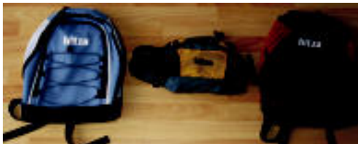
HITZAKO materiala eskuratzeko aukera eskaini dizuegu. HITZA

Saria jasotzeko, Hitzak Araba etorbidean duen egoitzara bertaratzea baino ez du egin behar, harpidedun txartela eskuan. Gisa honetara, HITZAK bere irakurleak saritu nahi izan ditu, egunero-egunero gure egunkaria jarraitzeaga-