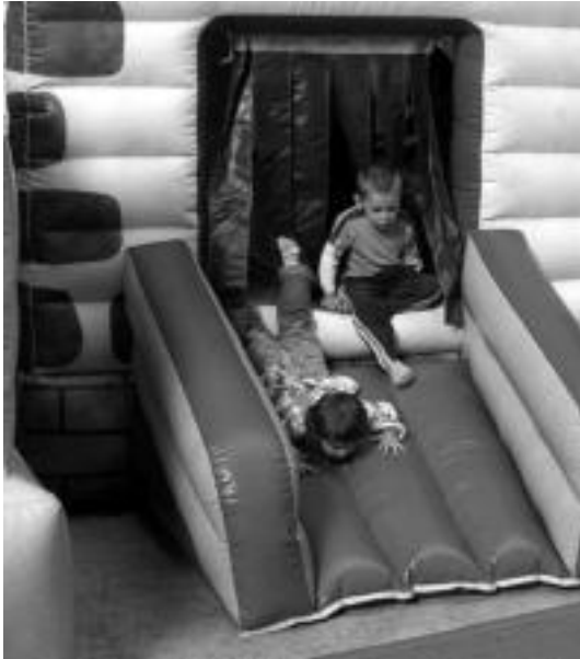
Irura. Bi haur ahal duten moduan puzgarri batetik jaisten. N. LIZARTZA

Gaur amaituko dituzte Iruran eta Aldaban ospatzen ari diren San Miguel jaiak