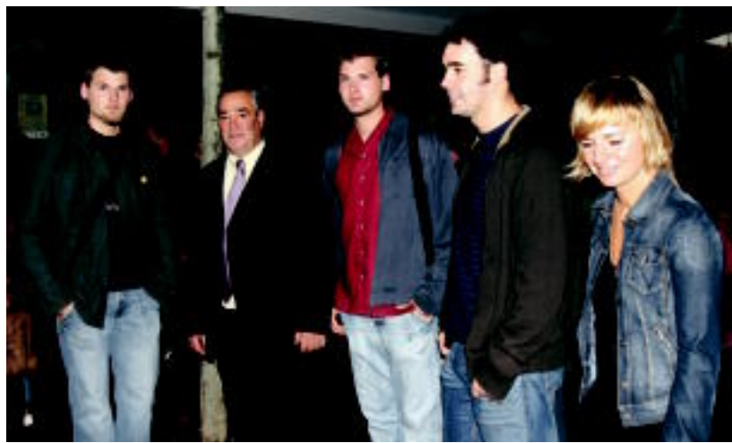
Kutsidazu bidea Ixabeleko lantaldea Leidor aretora sartzen, atzo, Tolosan filma estreinatzeko. MADDI SOROA

TOLOSA ▶ Eskualdeko aktoreek egindako eta eskualdean filmaturiko 'Kutsidazu bidea Ixabel' filma atzo aurkeztu zuten, Leidorren, lan talde osoa bertan zela