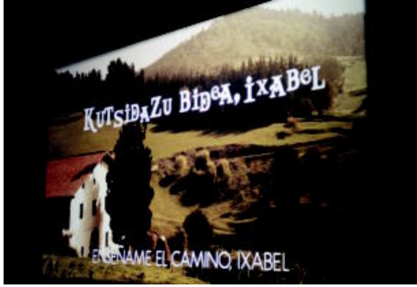
Toperaino bete zen Leidor aretoa, inork ez zuten galdu nahi izan estreinaldiko eguna. MADDI SOROA