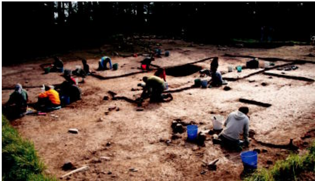
Indusketa lanetan jardun dute hainbat lagunek. Pazientzia handiko jarduerak egin behar izaten dute, lurra gutxinaka mugituz. I. GARCIA

Azken urteotako aurkikuntzek erakutsi dute hipotesi hori ez zela egia eta hemen, Burdin Aroan, izan zirela herririkak. «Egun gauza asko dakizkigu orduko bizimoduaz: etxebizitzak eraikitzen zituzten, lauki zuzeneko oinplanodunak eta neurri handi xamarrekoak; ne-