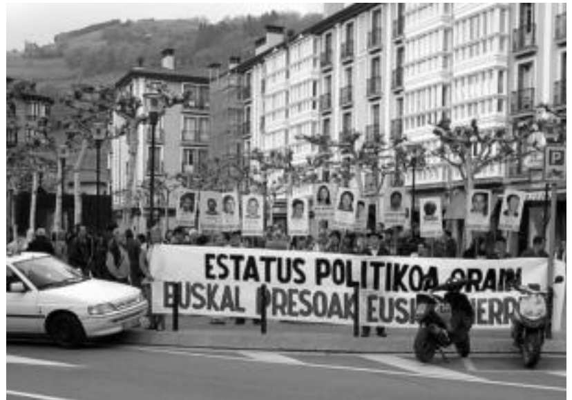
Tolosako Triangulo plazan egindako elkarretaratzeetako bat.

Segik ere bat egiten du elkarretaratzearekin, ohar baten bidez. Erakundeak deia egiten dio «euskal gizarteari, eta zehazki euskal gazteriarri, euskal preso politikoen eskubideen defentsan kalera irteteko eta hein berean Espainiako Gobernuak txantaiarako egiten duen erabilpena eta bizi osorako espetxe zigorraren ezartzea salatzeko».