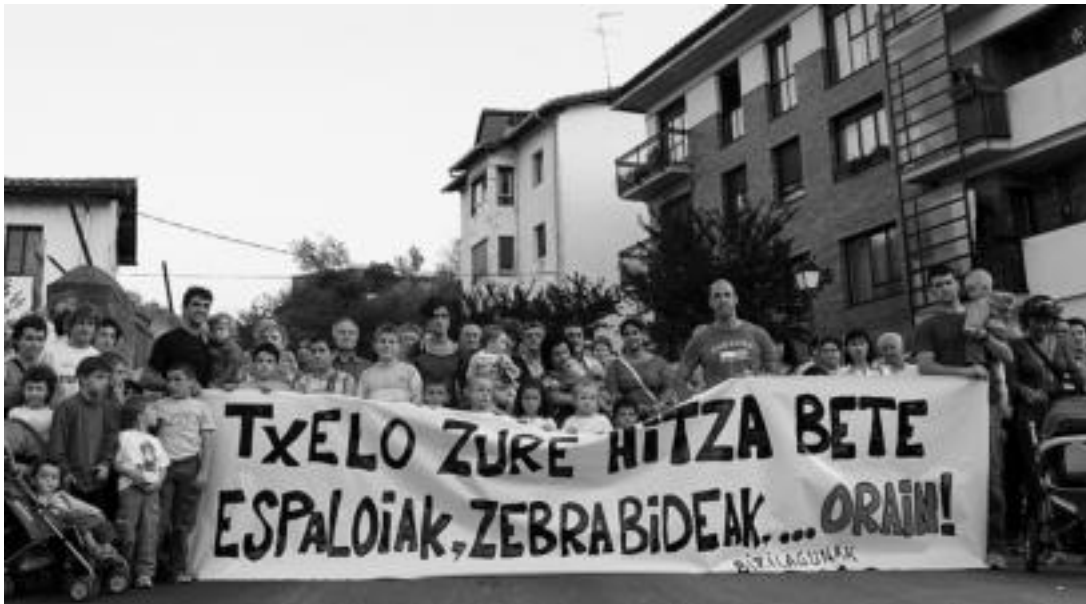
Otarreaga eta Apaiz-Errekako bizilagunak «kezkatuta» daude segurtasuna «arriskuan» ikusten dutelako, «are gehiago haur txikien kasuan». m.s