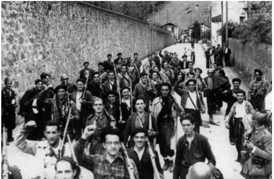
Milizianoak ukabila jasota agurtzen Alegiako posizioetara zihoazela. '1936 GUERRA CIVIL EN EUSKAL HERRIA'

Tolosa 1936ko abuztuaren 11n hartu zuten Francisco Francoren alde altxatu zirenek, eta inguruko herriak aurreko eta ondorengo egunetan. Hiru bidetatik iritsi ziren Francoren aldekoak: Araxes, Berastegi eta Oria bailaretatik. Pablo Cayuela teniente koronelaren tropak Altsasutik Idiazabalera joan eta uztailearen 26an sartu ziren Beasainen, Ordizia berehala hartu eta handik Tolosaruntz abiatu ziren. 1.000 gizon ingu-