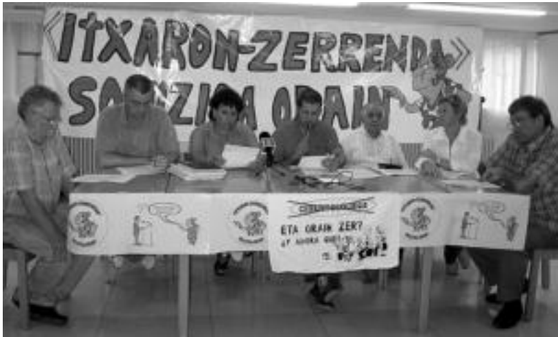
Gerontologikoaren Aldeko Plataformako kideak, atzo arratsaldean, prentsaurrekoan.