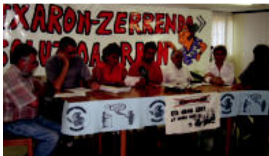
Atzo plataformakoek eskainitako prentsaurrekoa.

EAJk aurkeztutako Gerontologiko berriaren aurreproiektuaz aritu dira ▶ 2