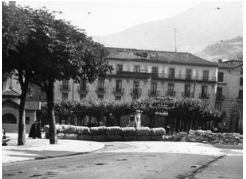
Tolosa defenditu zutenek Triangulon jarri zuten azken defentsa lerroa.