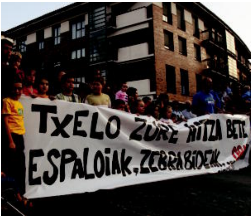
Ehun bizilagun inguru bildu ziren atzo errepidean eginitako konzentrazioan. M. SOROA

IBARRA ▶ «Autoen gehiegizko abiadura» salatu zuten, atzo, Otarreagako eta Apaiz-Errekako auzokideek ▶ 6