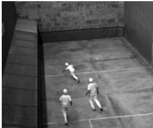
Irurako pilota eskolako haurrak xarean jokatzen, atzo. I. TERRADILLOS

11:00etako mezaren ondoren hamaiketako izango dute herritarrek. Gauera arte itxa-