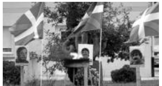
Tolosa eta Lizartza, igande eta astezkeneko ekitaldiak. HITZA