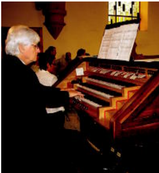
Azkuek eskainitako kontzertuaren une bat. HITZA

▶ HITZAK ez du bere gain hartzen egunkarian adierazitako esanen eta iritzien erantzukizunik.