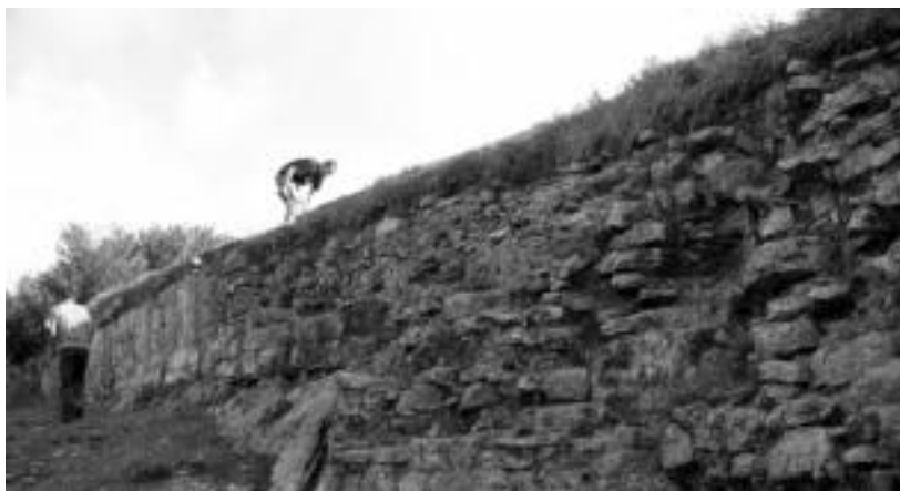
Ikastaroan aipatuko den leku historikoetako bat: Amaiurko gazteluaren hondakinak. BERRIA