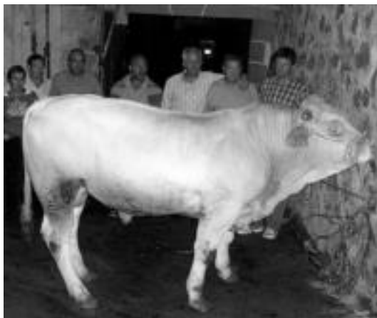
Txekorra, bere zapzi jabe ibartar berriekin batera.