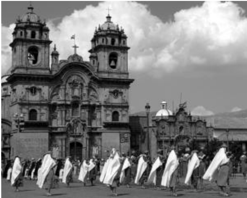
San Joan egunean iritsi ziren Cuzcoca (Peru), bertan, eguzkiaren festa ospatzen dute. FABIOLA JUBIN

Etzi eskainiko dute Angel Cuerdok eta Fabiola Jubinek lau hilabetetan egindako bidaiaren inguruko dokumentala