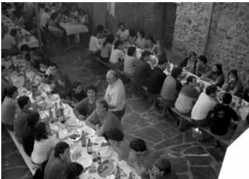
Iaz ere Lasturrerako irteera burutu zuten; iruditzen, Lasturren bertan eginiko bazkariaren une bat. HITZA

Txartelak Zubiaurre, Sendi Ekintza, Atari, Txumitxa eta Karlatzen daude, 23 eurotan.