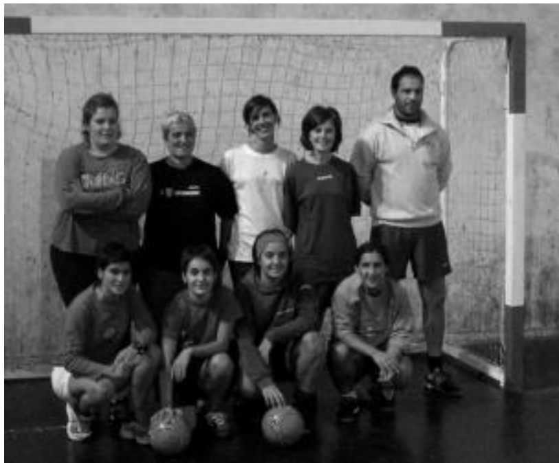
Nesken Intxurre areto futbol taldeko jokalariek batzuk, Alegiko zelaian. N. URBIZU

Villabona, Tolosa, Amaro eta Alegikoak dira hamabiak, eta Gipuzkoako Kopan ariko dira urtarrilaren bukaerara arte