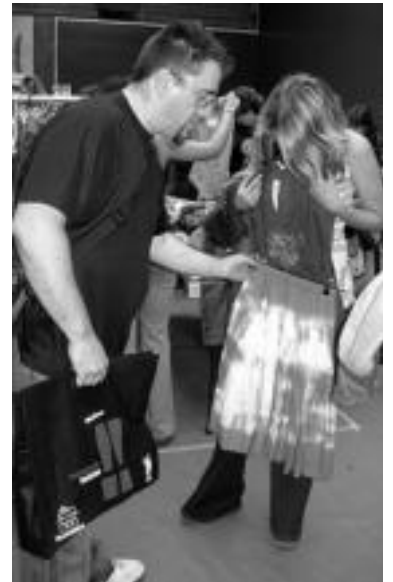
Probagelen faltan, imaginatu egin behar.