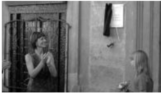
Atzoko inaugurazioan, kanpoaldeko plaka kentzeko garaian. HITZA