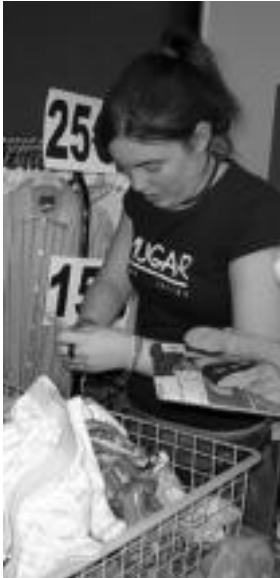
Jendea erosi eta erosi aritu zen.