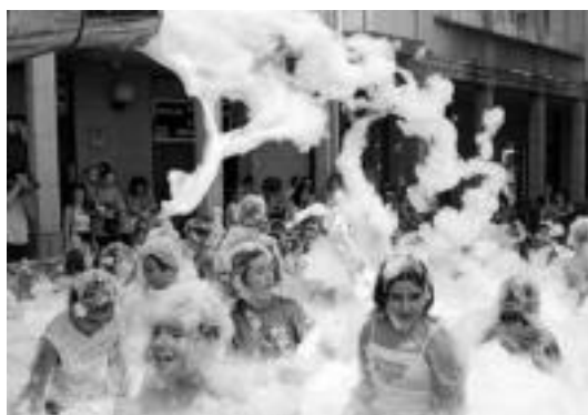
Apar festan aspertu arte ibili ziren gaztetxoak. N. URBIZU

Astelehena indarrak bertuteko eguna izango da, asteartean 17:00etan jubilatuek San Migel plazan eta biltokian jokoa egiteko. Berriz ere ostegun arratsaldean helduko diete festei irurarrak, trinketean herriko Pilota Eskolako haurren arteko pala eta xare partidak ikusteko pilota partidekin.