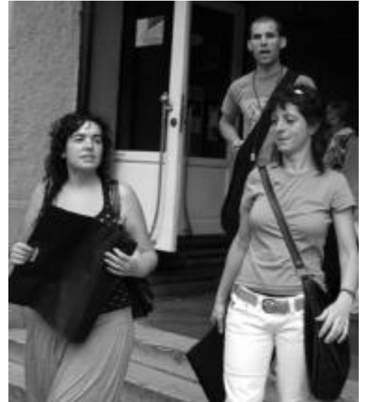
Jendea, eskuan boltsa ugari zituela ateratzen zen frontoitik. E.E.