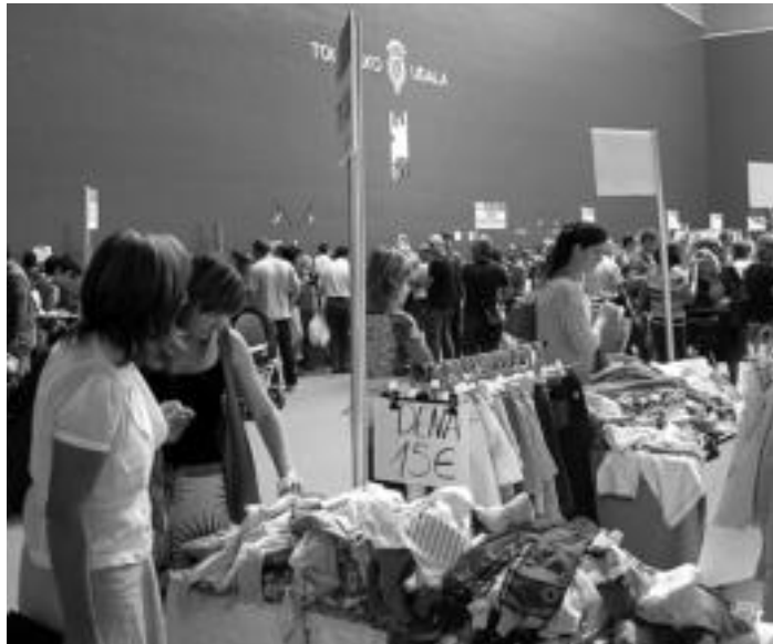
Atzo arratsaldean ere jende asko hurbildu zen Beotibarrera, ikusmiran.

Igarondo Merkatarien elkar-teak antolatuta, denera, eskualdeko, nahiz kanpoko 16 dendek hartu dute parte azokan. Gaur berriro irekiko dituzte atekak, 10:00etatik 21:00etara.