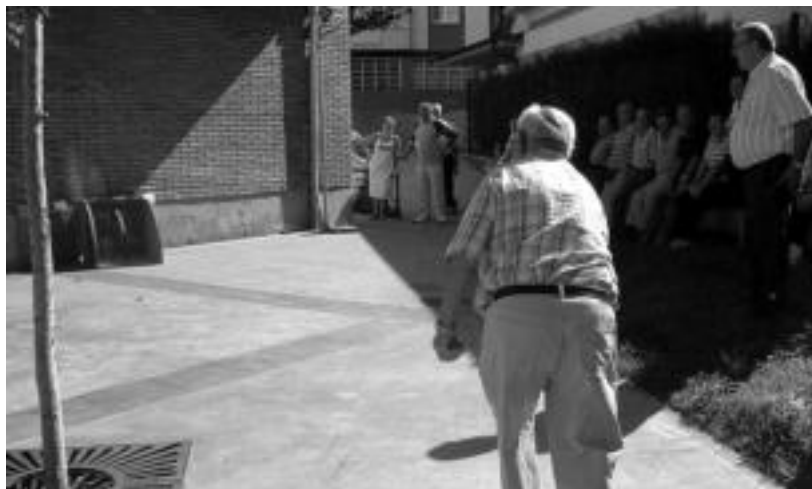
Bizi Nahi jubilatuen elkarteak antolatutako toka txapelketako partaideetako bat, jaurtiketa egiten. E. EZEIZA