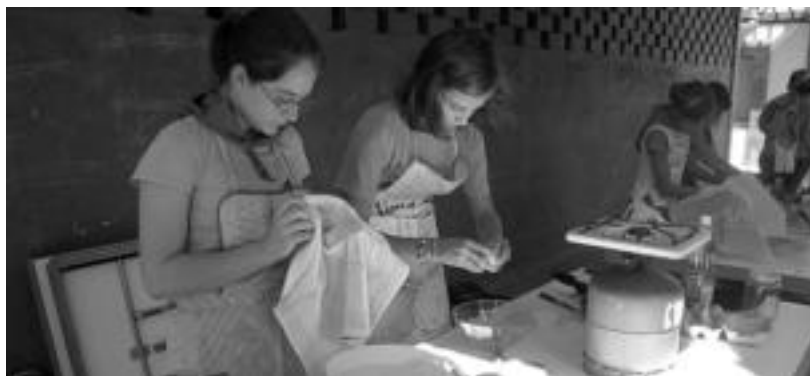
Patata tortilla lehiaketan hiru bikotek hartu zuten parte: hirurek seguruenik, saria jasoko dute. ESTI EZEIZA

Gaur, 11:00etan meza izango da, eta 12:30ean Gorritik ekarritako abereak, San Migel plazan. Arratsaldean, berriz, herri kirolak izango dira pilotale-