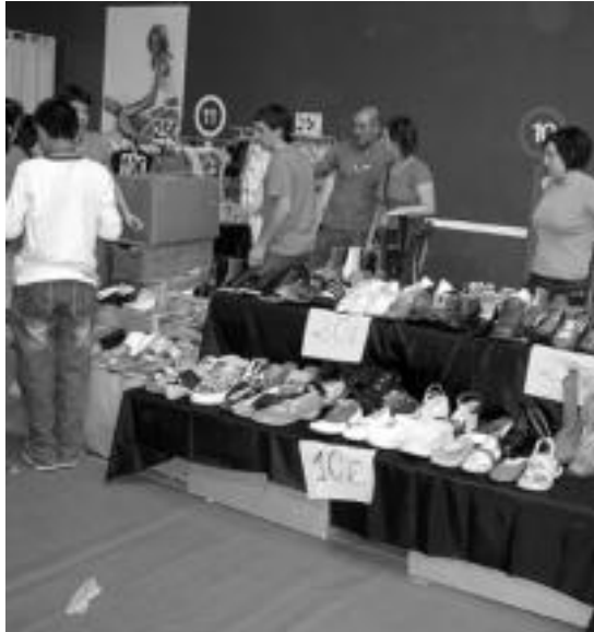
Udako nahiz neguko oinetakoen eskaintza zabala ikus zitekeen.