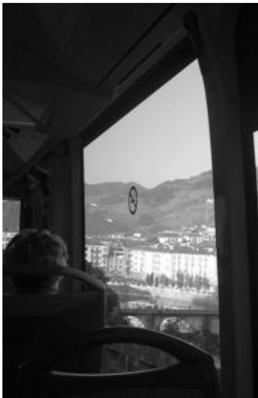
Paisaia ederrak ikus daitezke autobuseko leihoetatik. m.s

Berazubira iritsitakoan autoak ageri dira harantz eta honantz. Herrian lan egiten dutenak badatoz, herritik kanpo lan egiten dutenak badoaz. Muletadun emakume bat igo da geltokian. Asuncion Klinikara doala agertu dio gidariari, baita autobusik gabe mugitze-