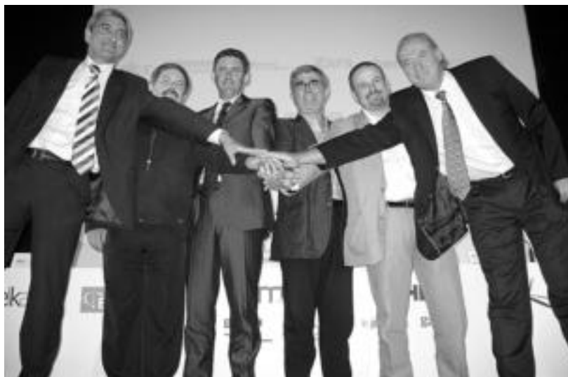
Hamaika Telebista Hedatzeko Taldeko bazkideak, atzo, Bilbon. HITZA

Egitasmoak dagoeneko hainbat oinarri sendo dituela nabarmendu zuten: Euskaltelek jarriko duen teknologia digitala, Bainenek telebista ekoizpenean duen eskarmentua, Elkarren esperientzia kultura alorrean, eta komunikabideen alorrean diharduten hiru enpresa taldeen babesa.