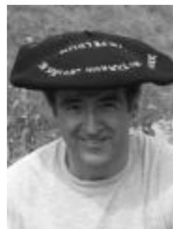
Alustiza Nafarroakoan. HITZA

Igande honetan berriaz, Nazioartekoan parte hartuko dute, Oñatin.