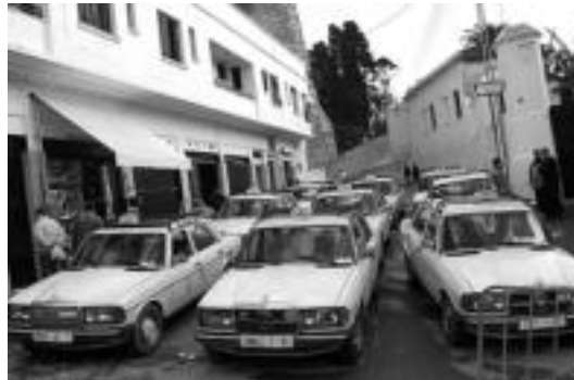
Marokon bertan aritu dira grabaketak egiten. IÑAKI ELOLA

Segituan ikusi zuten egileek istorio honekin zer edo zer egin beharra zegoela, eta pantailara eramatea pentsatu zuten. «Iritsi eta bigarren egunean hasi ginen grabatzen; gure asmoa, batetik, bidaia zein egoeran egin zuten erreproduzitzea izan da, eta bestetik,