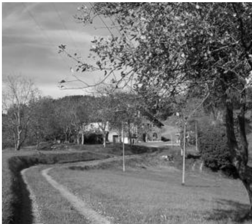
Aundia baserriatik igarotzen den bidea, katalogoan agertzen den bideetako bat da.