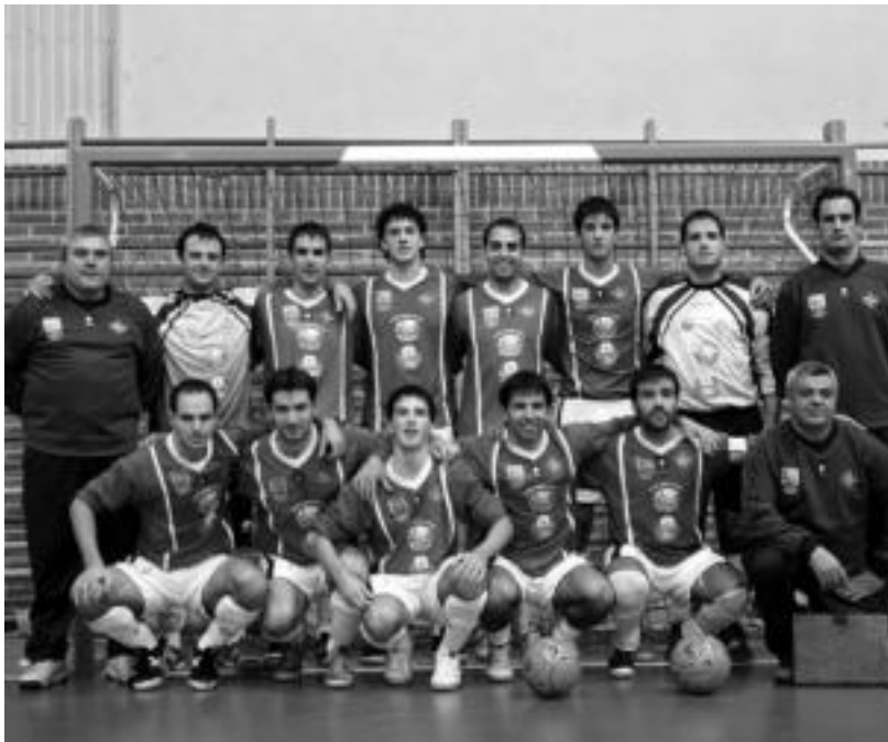
Batzuk joan eta besteak etortzearen ondorioz, hauxe izango da denboraldi berriko taldeko argazkia.