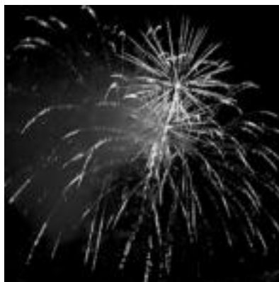
Su artifizialak. Kontzertuaren aurretik su festaz gozatzeko aukera ere izan zen. i. t.

sus Gallego irakasleak, Tolosako historiari buruz prestaturiko lana.