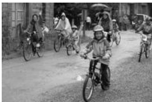
Leitzako estazioetik mordsokaka atera ziren familiak. J. ASTIBIA

Lasterkariet dagokionez, berriz, 125ek parte hartu zuten, hauetatik 9 ziren emakumezkoak, Plazaolako 1.go Maratoi