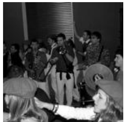
Gau animazioa. Txarangek asko lagundu zuten gaueko festa giroa animatzen. i. t.