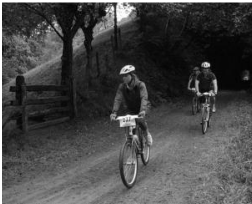
Telleriko tuneletik ateratzen IV. Mendi Bizikleta Marxtako parte-hartzaile batzuk. JAIONE ASTIBIA

IV. Mendi Bizikleta Marxta eta I.go Plazaolako Maratoi Erdia egin ziren igande eguerdiarte, trenbide zaharrea zehar