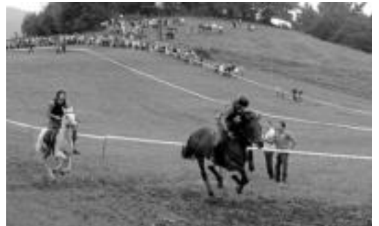
Igandeko zaldi lasterketaren une bat.

Orain arteko partaidetza handiena, lau hasiberri eta hiru emakume lehian aritzea, arrakastaren arrazoiak