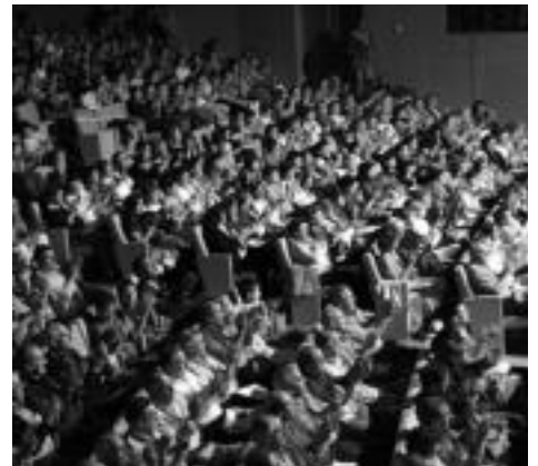
Herritarrak kantuan. Leidor aretoa segituan bete zen, ereserkia kantatu zuten 750 herritarrekin. i. t.