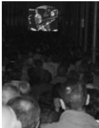
Zerkausia. Bertan jarri zuten pantailan kontzertua jarraitzeko jendez bete zen. i. t.

Kontzertua eta gero festak ez zuten etenik izan herriko kaleetan; txarangek eta Plaza Berriko musikak asko lagundu zuten goizalderarte luzatu zen festa berezia animatzen.