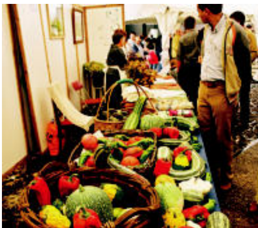
Azoka Egunean atondutako barazki postua. JERONIMO OTEGI

IRABAZLEAK ▶ Olarrea-Goikok eraman zuen saski sariduna; ardi txakurren lehiaketan, Orbegozo ▶ 4