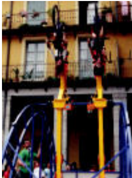
Euskal Herria plazan haurrentzako jolasak izan ziren. M. SOROA

«Gaur, geroari begira ere begaride, eta honetarako, lehenetik ikasi beharra daukagu»