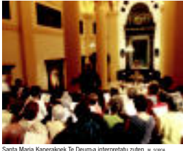
Santa Maria Kaperakoek Te Deum-a interpretatu zuten.