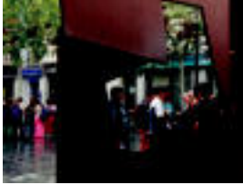
Hiriko begirabideetatik zehar ibili ziren Tolosaldeko gazteak. M. SOROA