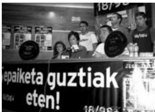
Elkartasuneko sega jaialdiaren aurkezpena.