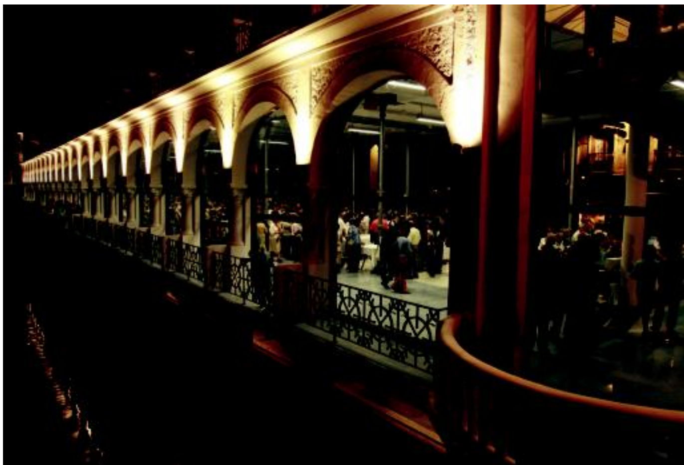
Zerkausia. Argiztapen ikusgarriarekin inauguratu zuten, atzo iluntzean, Zerkausia, ehunka herritar bertan bildu zelarik.