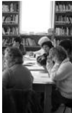
Memoria tailerra. N. URBIZU