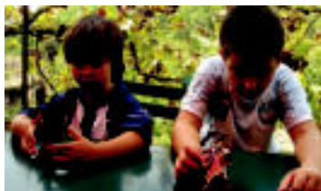
Ongi etorriak oportetarik eta ikasketei gogoz heldu. Aitona eta amona guztien partetik.