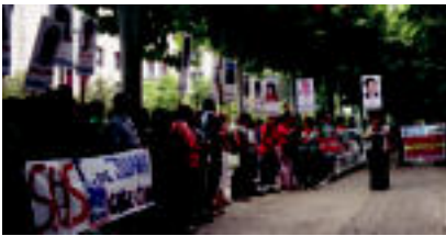
Ezker abertzaleak elkarrekin gatzu egin zuten Leidorreko abesbatza. M. S.

kian, Caballer pirotekniaren eskutik. Azkenik, 22:15ean, Esperientziak sora eta trudu ikuski zuzaz gatzu ahal izan zuten herritarrek, Triangulo plazan. Bertan, proiektua egiten ari zirela bildutako material batzuk erakutsi ziren, Alos Quartet hari instrumentuko laukoak giroa melarrik ekitaldia. Azkenia hurberean, Kantu jarela liburitik aterako hainbat pasarte dramatizatu zituzten. Hau, Esperientziak proiektuan elkarritzatutako emakumezkoen testigantza oinarritutako liburua da, honekin batera bideo bat ere proiektatu zela.