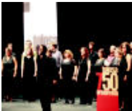
Leidorreko ekitaldian Hodeiertz abesbatzak kantatu zuten. M. SOROA