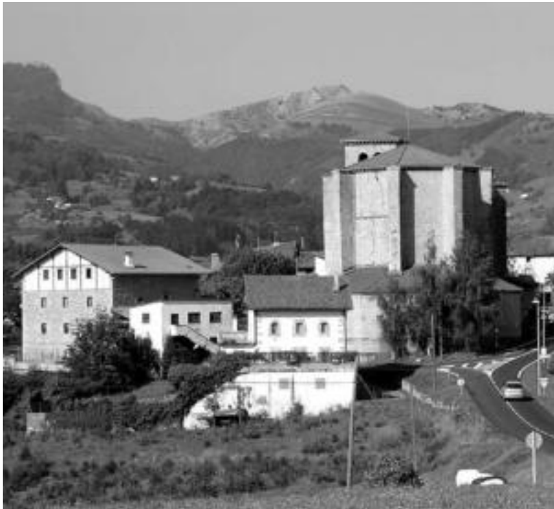
Zizurkilgo baserrietako ondarea jasotzea izango du helburu I. Baserriko Argia Bekak. J. AZKUE

Hilaren 15a izango da aurkezteko azken eguna; beka nori eman zaion Zizurkilgo Azoka Berezian jakinaraziko dute