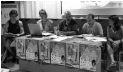
Taloaren Egunaren aurkezpenean, Ezkutari eta Aierdi, Partzuergoko kudeatzailea eta lehendakaria, eta Lazkano Leitzako zinegotzia. HITZA

10:00etan irekiko dute merkata. Herriko hiru talogileek postu bana jarriko dute; Villabonak, Saralegik eta Talotegiak beren talo bereiztasunak jarriko dituzte salgai. Hauekin batera, Plazaola Partzuergoko kide diren artisauek ere beren postuak jarriko dituzte. «Zonaldeko artisaunen produktuak erakusgai eta salgai ere jarriko dituzte artisauek beraiek, eta gazta desberdinak, zurezko lanak, ezta, zeramika, sagardoa izanen dira». Goiz guztian zehar zabalik egonen dira postu hauek denak, beraz.