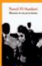
Memorias de una joven doctora Natal D-Salazar