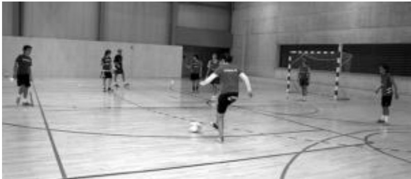
Hegoaldeko neskek 2006-2007 denboraldiko lehen entrenamendu saioetan.