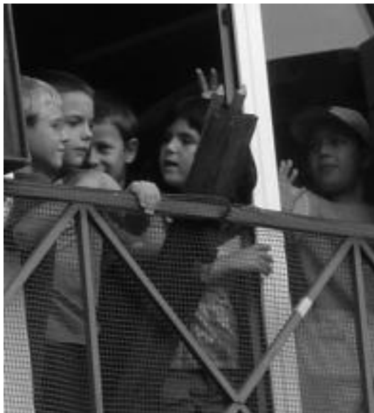
Haurrek bota zuten atzo goizean txupinazoa Zizurkilen. HITZA