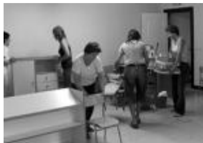
Auzolanean, aritu ziren atzo goizean, beheko gela hori gaurko prestatzen. J. ASTIBIA

tik egindako laguntza eskaerari erantzunez: larrialdietako atea egin duten gela hori, Haur Hezkuntzako izanen dena, garbitu eta bertara beharrezko altzari eta materialak jaitsi eta txukuntzen aritu ziren.