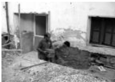
Sotoko gela handiko leiho zuloaz baliatuz egin dute larrialdietarako atea herriko eskolan. J. ASTIBIA

herriko bi langile; solairu horretako gela handiko leihoak baliatuz, larrialdietarako irteera egiten ari dira, eskola atzean dagoen jolaslekura ateratzeko arrapalarekin. Goranzko arrapala izanen da; eskolako gela hauek erdi-sotoan daude eta ondorioz leihoak atariko lurraren parean. Horrela, leihoa ate bihurtzeko, kanpoko lurra ere