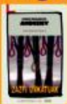
Zuzi uhakak Leand Nolasena Andreu