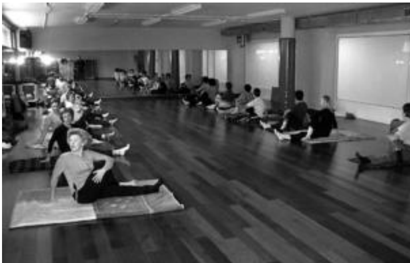
luz antolatu zuten yoga ikastaroko irudia.

Informazio gehiago nahi duenak kiroldegian eskura dezake, 943 67 15 44 zenbakian.