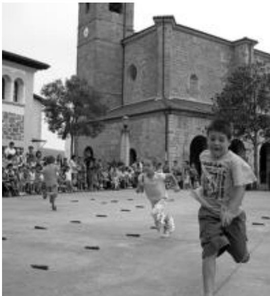
Lokotx-bilketan ederki saiatu ziren Alkizako haurrak. I. GARCIA

Zizurkilen eta Alkizan hasi dira festak eta haurrak izan dira protagonista