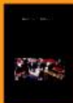
Kavkaziar iraultza beretila Bernat Berche