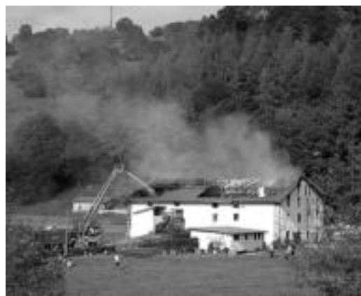
Sutearen ondorioz, Eztiola baserria suntsiturik geratu zen. N. URBIZU

19.200 euro lortu dituzte jai berezian, erretako baserria konpontzen laguntzeko