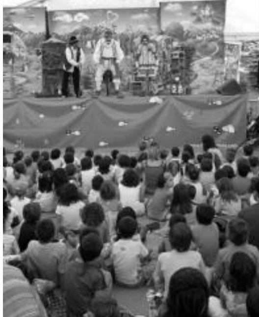
Pirritx eta Porrotxen emanaldian haur ugari bildu zen Zizurkilen. I. G.