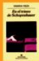
En el reino de Schopenhauer Yusufna Raza