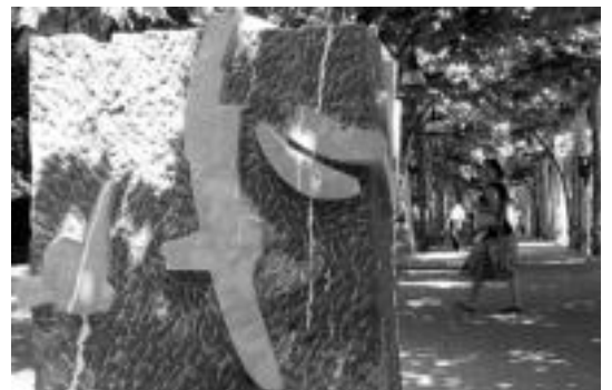
Kantu isila erakusketako piezetako bat. INIGO TERRADILLOS

Bestalde, proiektua osatzen duten 15 eskulturetatik bat aukeratu dute, eta hau, Tolosako hirian bertan geratuko da, behin betiko.