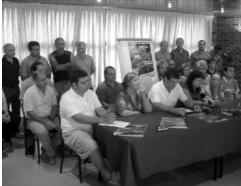
Jaialdiaren antolatzaileek eta babesleek atzo egindako aurkezpenaren une bat. HITZA

Hilaren 15ekoan, herri kirolen bitartez euskal selekzioak aldarrikatuko dituzte eta geroko