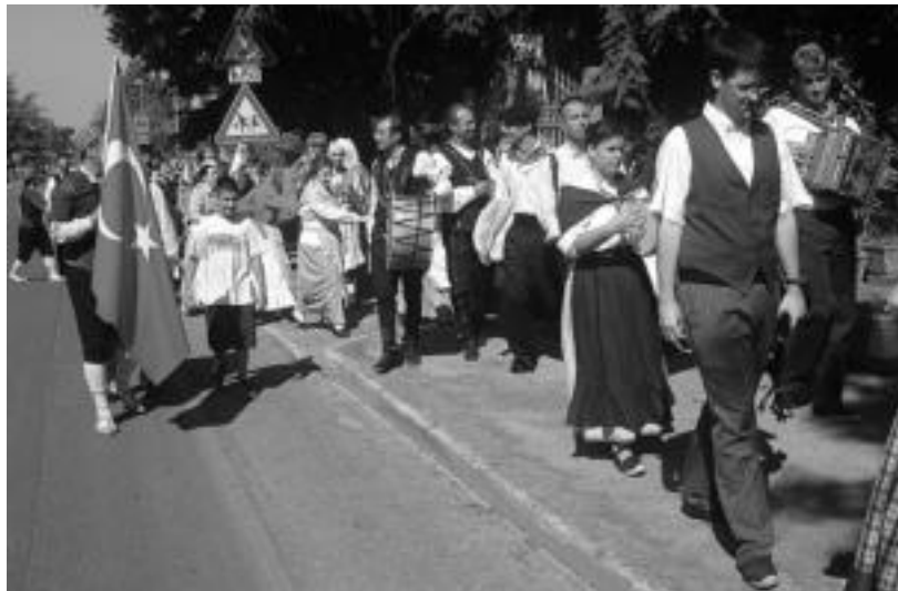
Italiako Castiglione del Lago herrian, Agilla e Trasimeno talde italiarrarekin eginiko desfilea.