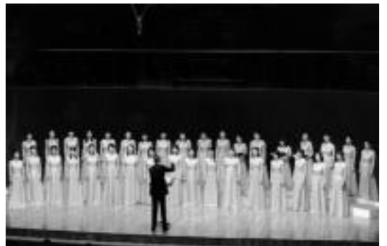
Japoniako Aoi Tori abesbatza. HITZA