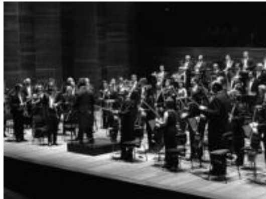
Euskadiko Orkestra Sinfonikoa.