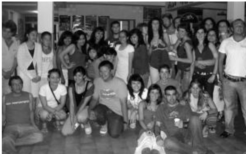
Italiako eta Turkiako dantzariak gain, Indonesiako dantzariarekin —irudian— ere egon ziren ibartarrak. HITZA

kulturaniztasuna garatu dutelako gazteek eta honen aberasgarritasunarekin jabetu direlako. Eta, bestetik, Ibarrako enbaxadore lana bete dutelako Italian, Ibarraren nortasuna eta izaera lau haizetara zabal-