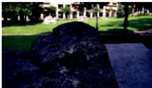
Kantu isila aire libreko eskultura bat, Zabalarreta parkean. L. MONTES

«Ardatz garrantzitsua» delako hartu du erabakia 750 Fundazioak ▶ 2