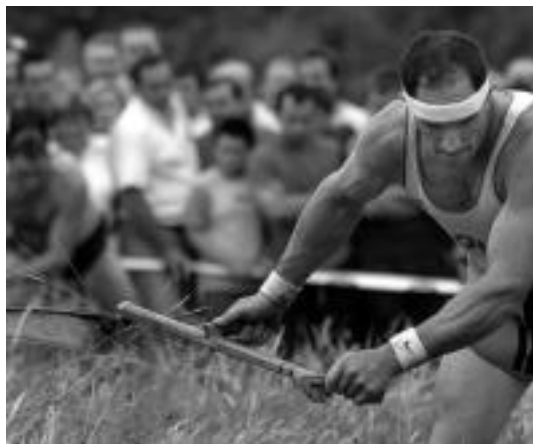
Erasunek Bedaion aterako du sega azkeneko.

Elduain, Lizartza eta Bedaio oraindik ere falta dira jaiak igarotzeko, eta ez dira atzean geratu: euskaldun onak bezala, herri kirolak eta musika ez da faltako