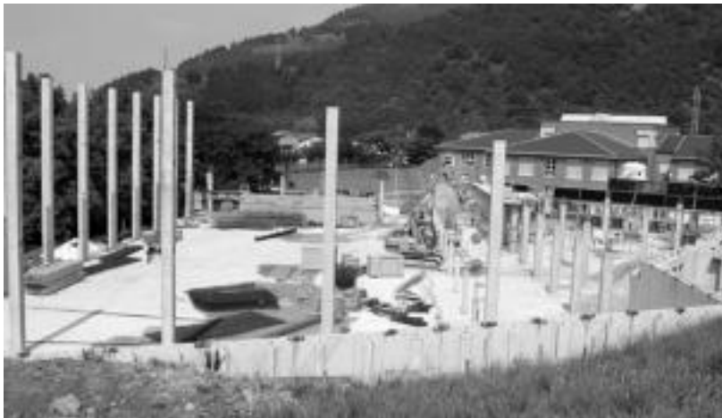
Obra eta Zerbitzuen Saila izan da kexa eta iradokizun gehien jaso dituen orain arte. JOXEMI SAIZAR

2006ko lehen hiruhilekoan 35 espediente jaso zituen Udalak, eta hurrengo epealdian, 20 gehiago