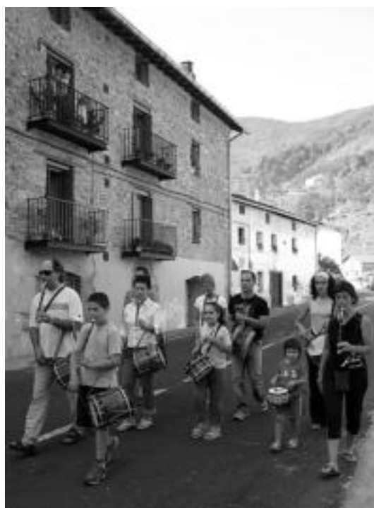
Lizardi txistulari taldekoek diana egingo dute bihar.