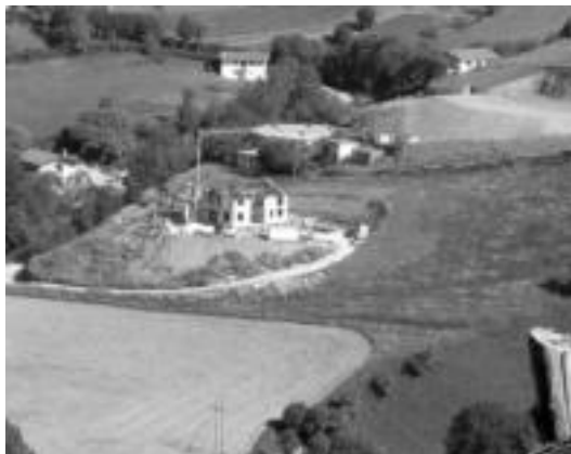
Ur depositua, artxiboko irudi batean, Arkixkil auzoan dago. JAIONE ASTIBIA

TOLOSALDEKO ETA LEITZALDEKO HITZAK jakin ahal izan duenez, eguneko leitzarrek egiten duten ur-kontsumoari aurre egin ahal izateko, alegia, ur-depositutik egunean zehar ateratzen den ur kantitatea berriz beteko bada, irteerak itxi eta betetzen uztea derrigorrezkoa izan da: