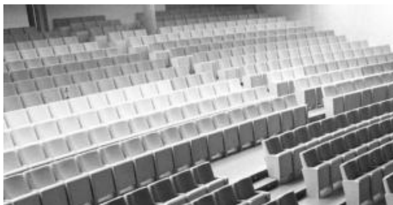
Leidorreko eserlekuak handiagoak eta atseginagoak dira. I. GARCIA

Erosotasuna, akustika ona eta eskenatoki aproposa bilatzea izan dira eraberritzearen helburu garrantzitsuenak