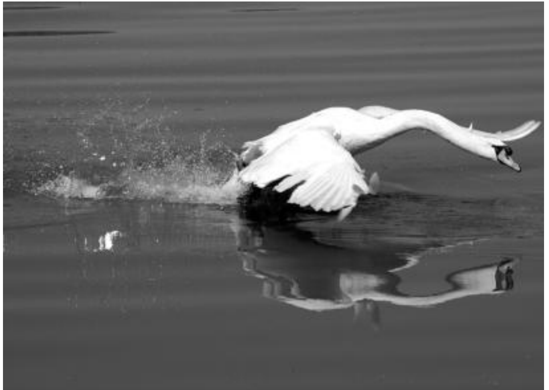
III. Hitza Argazki Lehiaketako finalistetako bat: Plaiaundin, Irunen (Txingudiko parke ekologikoan) aterata dago. IBAN ORMIZABAL

Aurreko edizioetako parte-hartzearen arrakasta eta harrera onaren ondoren, IV. HITZA Argazki Lehiaketa hasi da berriro dagoeneko