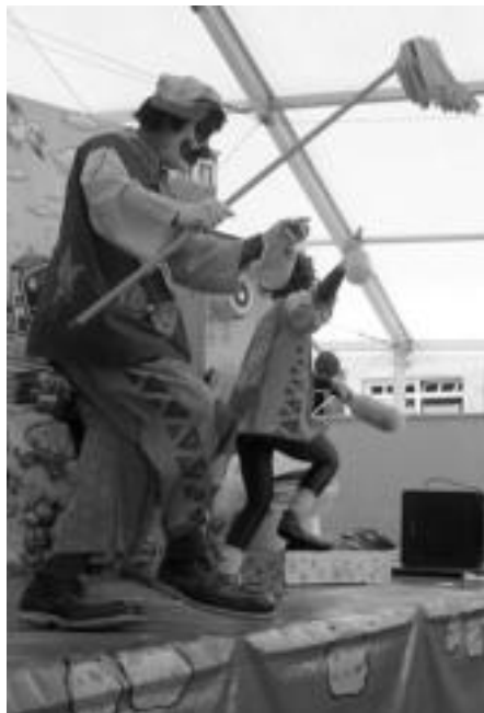
Iker Goenagak Alkizan eskainiko du emanaldia. Zizurkilen Pirritx eta Porrotx izango dira ikusgai. IMANOL GARCIA