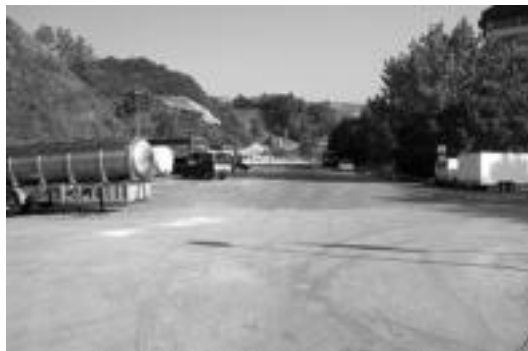
Txermin auzoko aparkalekua; bertan egingo dira 60 etxebizitzak. i.e.

Onartutakoaren arabera, beraz, Txermin-2 izeneko eremu berria etxegunerako lur eremu hiritargarri gisa sailkatu dute, 11.303 m 2 guztira. 9.486 m 2 etxegunerako lur eremu gisa