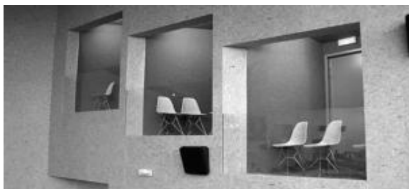
Sei palko egin dituzte: hiru alde bakoitzean. Bertatik, hobe ikusi eta entzun ahal izango da. I. GARCIA

besteko zabalera handiagoa duten pertsonengan pentsatuta».