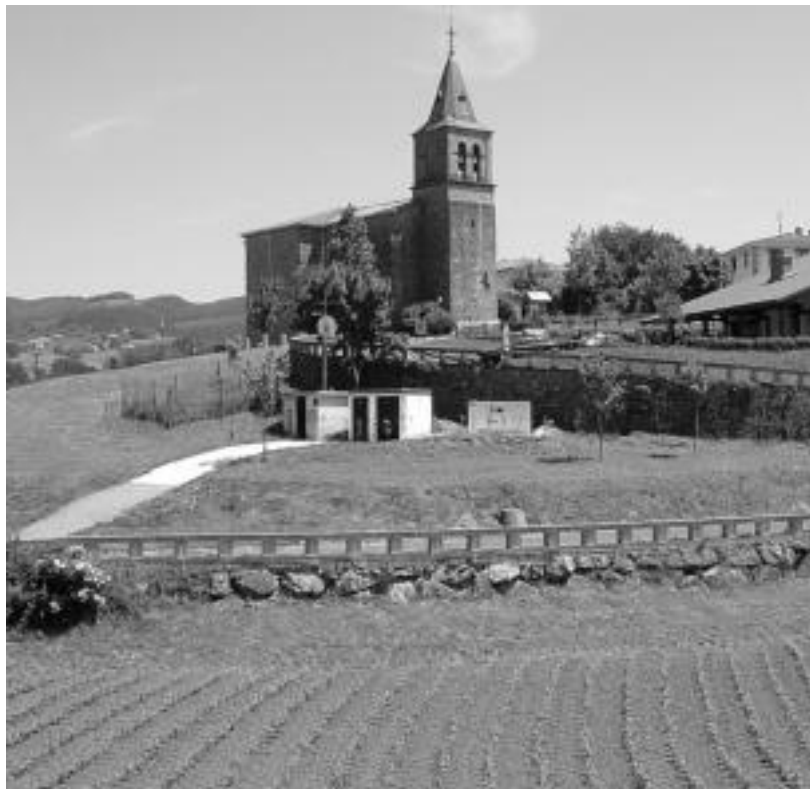
Leaburu Uli Udaltaldeko partaide da, Gaztelu, Lizartza eta Orexarekin batera. HITZA

Tokiko Agenda 21 datozen urteetan herrrian egingo diren ekintzak definitzeko balio