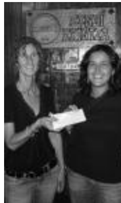
Diru-laguntza banaketa. HITZA