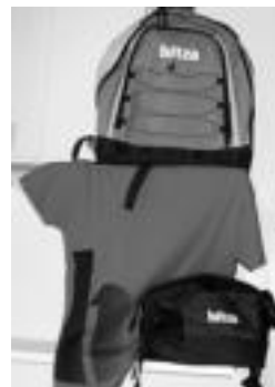
HITZAKO materiala. E. EZEIZA

zabalera eta 250eko bereizmena. ▶ Jarri behar diren datuak: egilearen izen-abizenak, helbidea eta telefonoa. Horrez gain, argazkia non eta noiz egin den adierazi behar da, eta zer ikusten den ere labur idatzi.