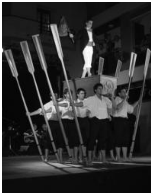
L'Arboç herriko emanaldiko irudia da. Bertako herriko jaien barneburutu zuten emanaldia. Kaxarranka dantza egiten ari dira Oinkari dantza taldeko mutilak. HITZA

Aurrez eginiko lana handia izan zen, ez izan zalantzarik, baina guztia erakusteko ordua iristean barruko harra ere dantzan jarri zen. Urduritasunak urduritasun, dantzariok genuen guztia eman genuen taula gainean. Harrera ezin hobea izan zuten gure pausoak. «Noraino altxatzen duten hanka dantzari hauek!», «ikusi al duzu kaxaren gainean dantza-tzen duen mutikoa?», «edaldon-tziaren gainera salto egiteak ez du erraza izan behar, alajaina!». Harriduraz betetako esamesak entzuten ziren eszenatoki inguruan, beti ere zorionak ematera inguratzen zirenen zirrararekin tarteka-