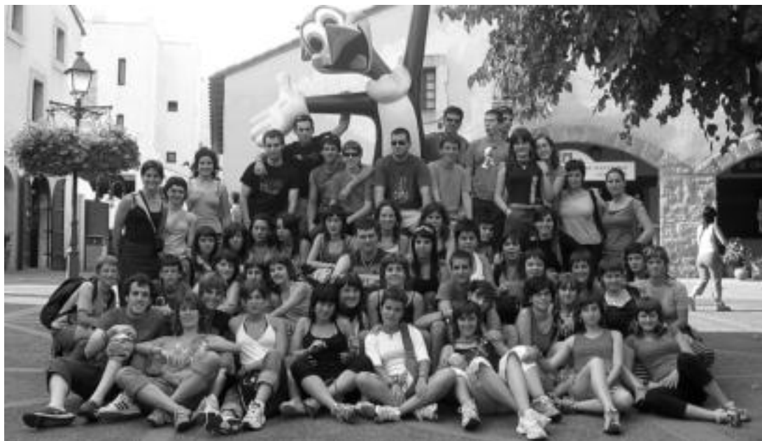
Oinkari taldekoak kalez jantzita. Behin Kataluniara joanda turismo pixkat egiteko aukera baliatu zuten. HITZA