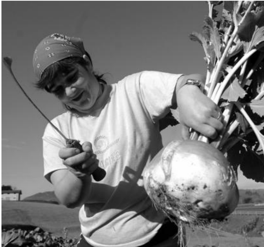
Villabonako Argazberri baserrian emakume bat baratze lanak egiten ari da.

Halere, azaldu dute analisisa egiteko Gipuzkoako baserrietan lanean aritzen diren emakume guztiak elkarrizketatzea ia ezinezkoa zenez, bertako hiru eskualde nagusietatik bat hartzea erabaki zutela; Tolosaldea izan zen azkenik hautatua. Eskualde honetako hamalau udalherri hartu dituzte txostena