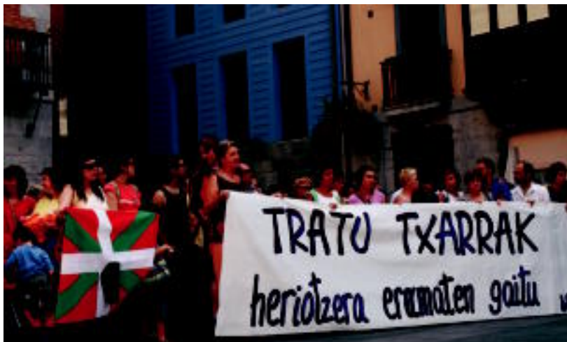
200 lagun bildu ziren Tolosako udaletxearen, Bilgune Feministak deituriko konzentrazioan. MADDI SOROA

Hildako emakumea duela urte eta erdi banandu zen, eta gutxienez salaketa bat badu senarrak bere kontra.