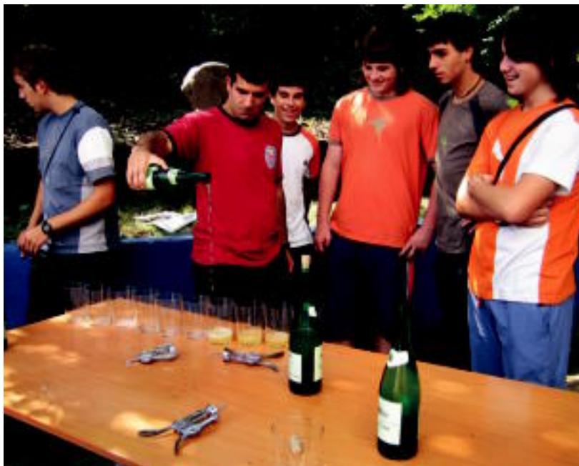
Sagardo dastaketan ia botila guztiak agortu egin ziren. NEREA URBIZU

Aurten Anoetako kiroldegi berria erabili ahal dute partidak jokatzeko. Ea bi taldeak han ikusteko aukera dagoen.