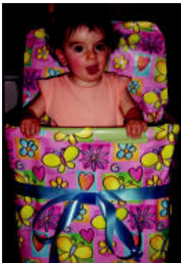
Aitaxorik tinko, kementsu ta maitagarriarenarentzat. Zorionak ta muxu pottolo pille zure bi sorginboen partetik. Urrundu gintuenak batuko gaitu! Osasuna, maitasuna ta askatasuna!