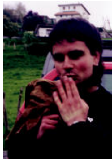
URTE ASKOAN HAIMAR Gure desira eta ametsak egi bihurtuko ditugulako, jo ta ke! Muxu handi ta goxoan ekitekoen partez!