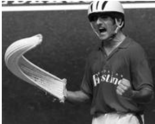
Elduaindarrak Binakako Txapelketa irabazi zuen iaz.

Apustu zaleek elduaindarra jotzen dute faborito gaurko finalerako