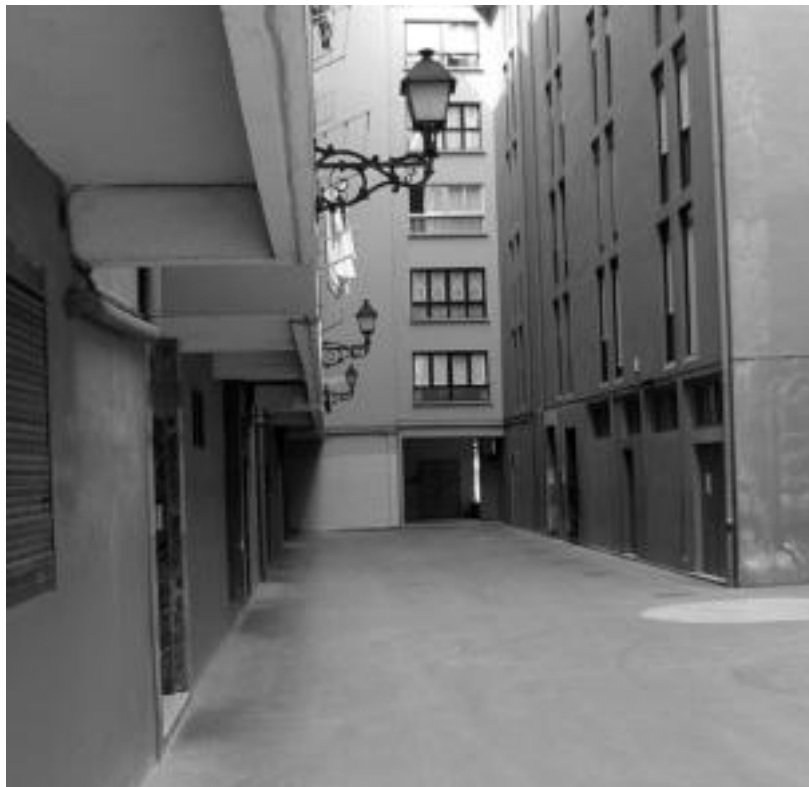
Santa Maria kaleko etxebizitza batean aurkitu zuten emakumea hilik. INIGO TERRADILLOS

Bitartean, atzo, goiz guztian zehar Ertzaintza hildakoaren etxebizitzan izan zen, ikerketa burutzen. Etxebizitza ez ezik in-