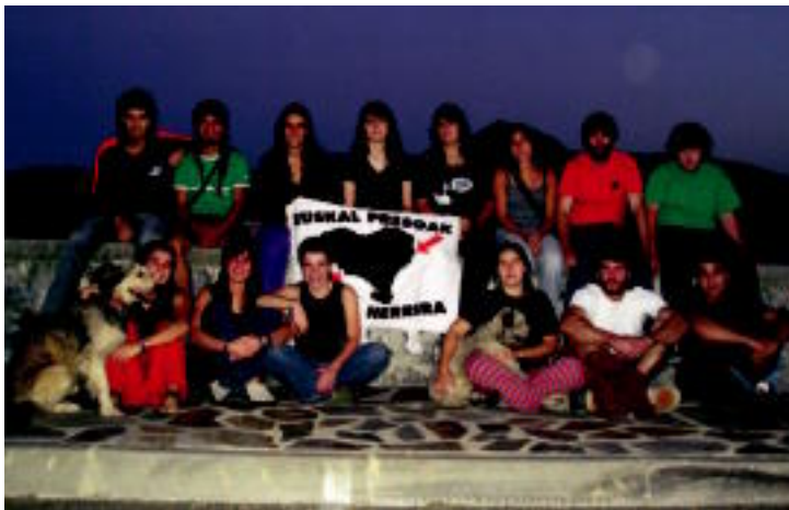
ZORIONAK GUAPU! Elbixoen herritik alaitasun ziztadak!