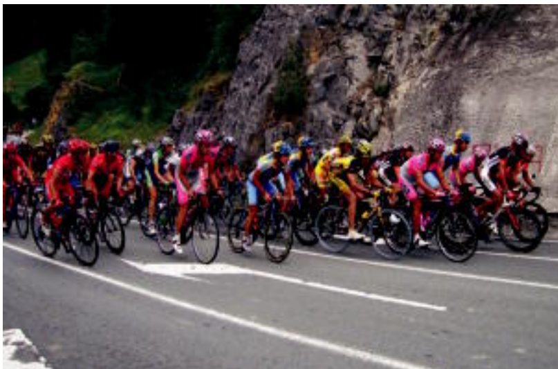
Alde egindako txirrindularien ondoren, gainontzekoak tropelean igo ziren Albizturtik gora. E. EZEIZA