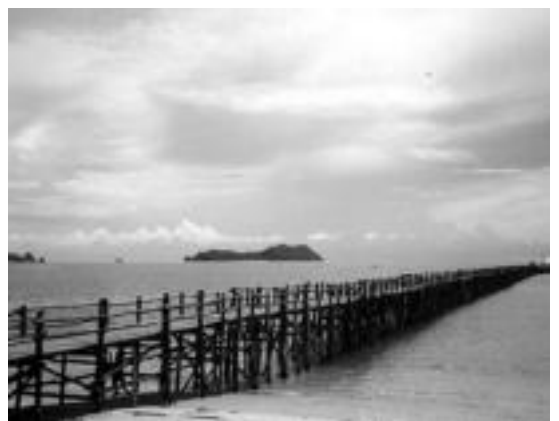
Goitik behera, Jimenezen etxetik begiratura agertzen den ikuspegia, hark izandako ontzietako bat, eta Thailandiako irudi bat. HITZA

nean, oso jatorra zen. Orain aldatzen hasita daude; beraiek inbersioak egin behar izan dituzte turismoa mantentzeko. Dirua gora eta behera... orain zakarxeagoak dira. Esaten dute ere turismoak beti ez dituela jenderik onenak ekaritzen. Batzuetan izaten dira kalamitate batzuk, eta bertako jendea gutxiespenarekin tratatzen badute... ba, normala, haserretu egiten dira! Batekoz beste, aldatu egin dute beraien izaera».