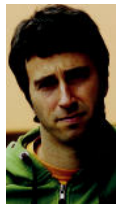
JON URBE / ARGAZKI PRESS

«Lanaldia hobe bizitzeko murriztu behar da»