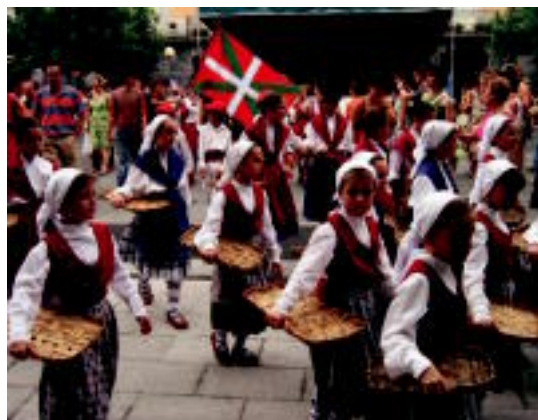
Goian eta eskuinean, gazteboek eskainitako dantza emanaldiak. Ezkerrean, gazteak korrika, 26. Santio Krosean. NEREA URBIZU