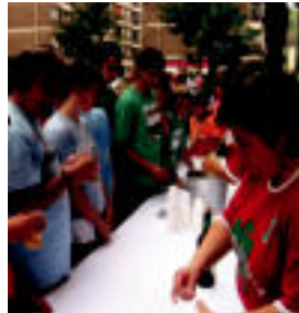
Hamaketa. Korrikalarien saioa bukatuta ondoren, Zurbeltz elkarteko hamaketa.