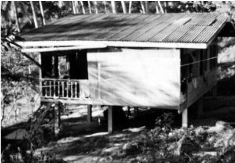
Bidaiari alegiarraren lehendabiziko etxea da goiko irudian agertzen dena. HITZA