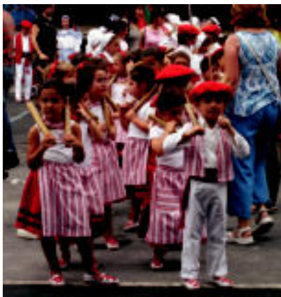
Dantzari bokiek auzoetan egin zituzten saioak. Arratsaldean, aldi, emanaldi Txistulari plazan.

Egunpasa bete izan zen atzokoa, eta dantzariak eman zioten egun beroari kolorea, auzo guztietan txistulariekin batera saioa eskaini zutelarik