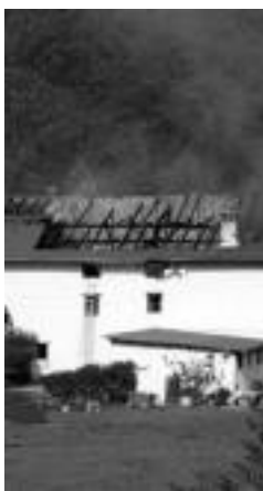
Eztiola, suak harturik. N. URBIZU

Afarira joateko txartelak erosteko epeak bukatu egin dira. Baina bankuan ere badago dirua sartzeko aukera: 2101 0067 2001 2549 8733 (Kutxa). Informazio gehiago nahi izanez gero 943 68 10 03 telefonora dei daiteke.