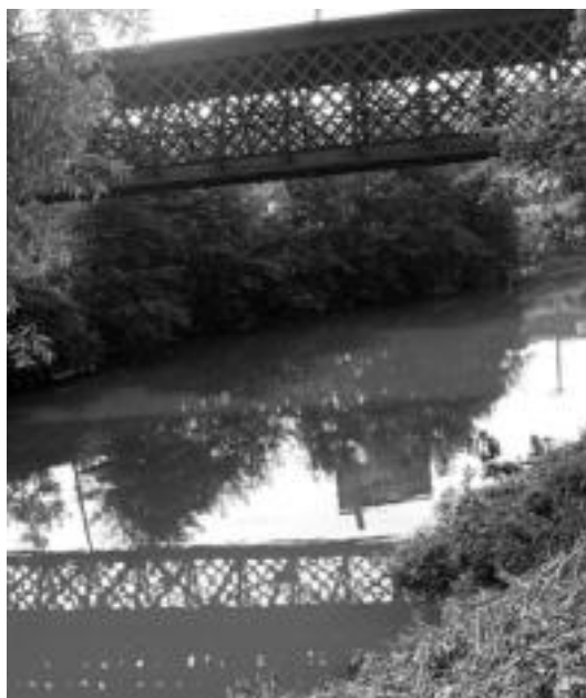
Burdinezko zubiaren inguruan jokatu da batel txapelketa.

Herriko elkarte guztiek hartzen dute parte jai egitarauan. Eresargi eta Eresargi Txiki abesbatzek kontzertua eskainiko dute. Behar-Zanak pilota partidak antolatuko ditu. Onddo Gazte Asanblada futbito txapelketa antolatzen ari da eta finala jaietan izango da. Oinkarik eta Oinargik dantzari txikien kalejira. Zumbeltzek herri krosa eta bertsoariak. Irrintzik txirindularitza proba. Loatzo Tiro Elkarteak plater tiraketa... Ahaztu gabe Euskal Jaiaren antolatketan parte hartu duten elkarte guztiak. «Euren ekitaldiak antolatzeaz gain, Jai Batzordean ere parte hartzen dute», gaineratzen du Vitorian.