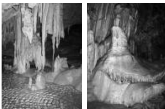
Nabardurak. Laminosinen harrizko zutabeak eta ura dira nagusi (ezkerrean); herensugearen burua ikusten? (eskuinean). HITZA

ak... eta gainera, denak, bertatik bertara ikusteko moduan. Bestearen ezaugarria, berriz, bere handitasuna da: 60 metro luze eta 20 metroko altuera du puntu batzuetan. Gelaune hau ez da bestea baino ikusgarritasun gutxiagokoa, baina nabarduretzat ohartzea zail egiten da bere zabaltasun horretan guztian. Hemen proiektorea eta soinu efektuak ere jarri berri dituzte.