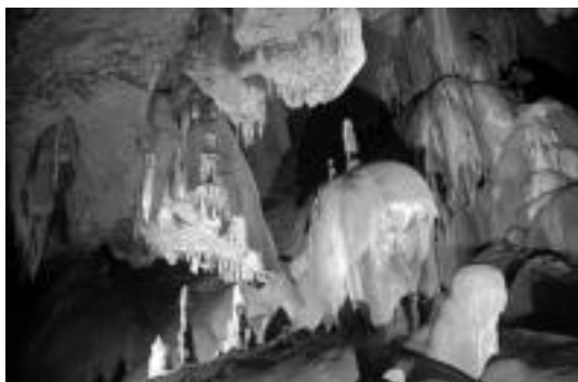
Gerlariaren gotorlekua. Areto hau bisitatzerik ez dago orainoz. Hemendik dago Intxixen gotorlekurako pasabidea. HITZA

Astitzko kobazuloa, Larraitzeko azpikaldearen itxura ikusteko atari