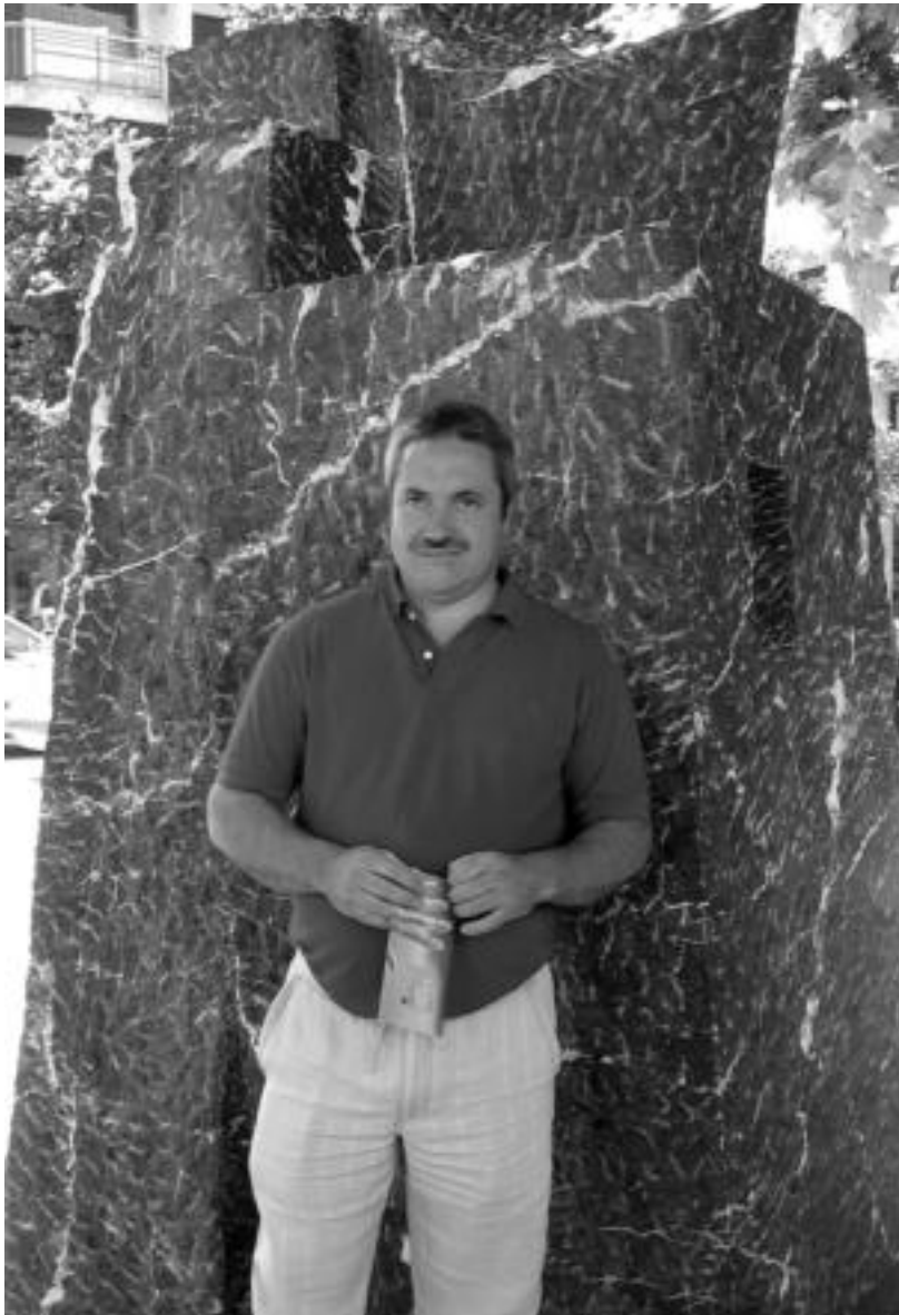
12 tona pisatzen du San Frantzisko ibiltokian ezarri duten eskulturak. N. LATABURU

Koldobika Jauregi alkizarrak Tolosaren 750. urteurrenaren harira antolatutako eskulturen erakusketa inauguratu dute