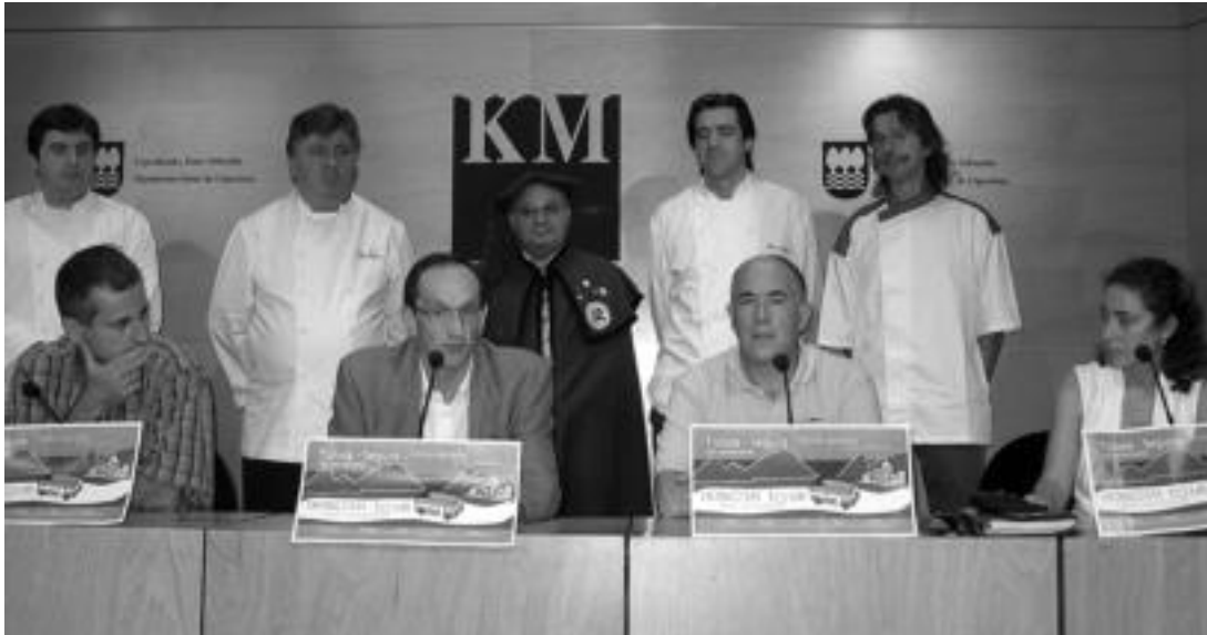
Tolosaldeko eta Segurako turismo eta ostalaritzako zenbait ordezkari, atzoko aurkezpenean, Donostian.

Tolosa eta Segura herrien 750. urteurrena dela eta, bi eskualdeak lotuko dituen autobus turistiko bat jarriko dute martxan gaurtik aurrera