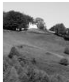
Ermita inguruak. J. ASTIBIA

Leitzako jubilatuko elkarteak antolatuta du; 13:30ean meza emanen dute ermitan