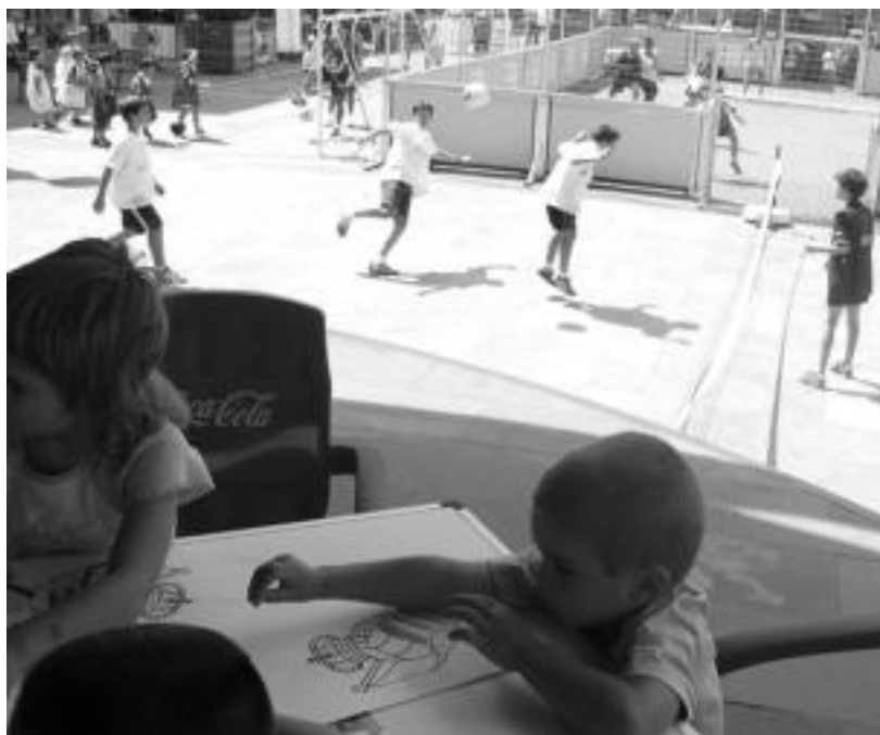
Lehenengo urtean ere Tolosan izan zen Realeko Bira. JAIONE ASTIBIA

Jolas eta ekitaldi bereziak izango dira gaztetxoentzat, futbol taldeko kluba haiei gehiago hurbiltzeko asmoz