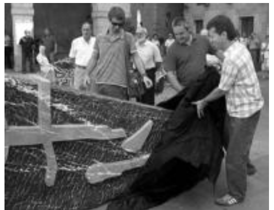
Iturzaetak, Jauregik eta Bildarratzek kendu zuten estalkia. N. LATABURU

Gustatu ala ez, ulertu ala ez, herritarren artean kuriositate, bederen, piztu du. Irailera bitarte bertan jarraituko dute eta, ondoren, guztietan bat aukeratu dute herriaren ikur bilaka dadin.