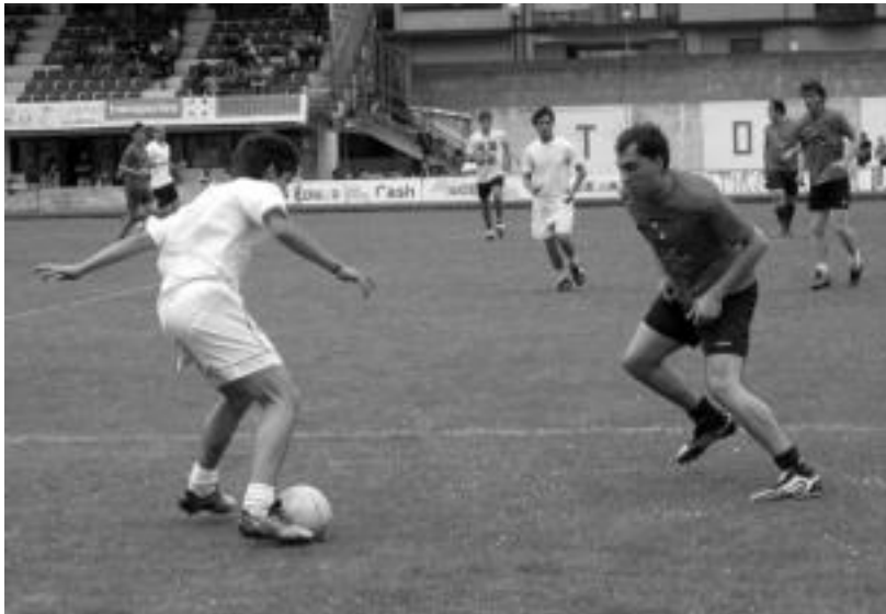
Tolosa Kup Txapelketan, Ibarra eta Tolosaren artean, joan den urtean jokatu zen partida. INIGO TERRADILLOS