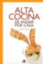
Alta cocina de Ancha por casa Ancha