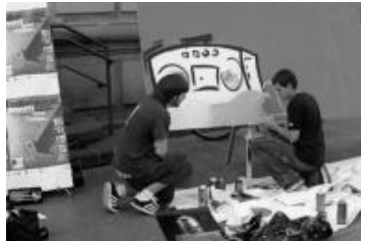
Gazte batzuk graffiti bat egiten, aurkezpen egunean. HITZA

Euskal Herriko hirugarrena izango da, eta abuztuan amaitzen da izen-ematea