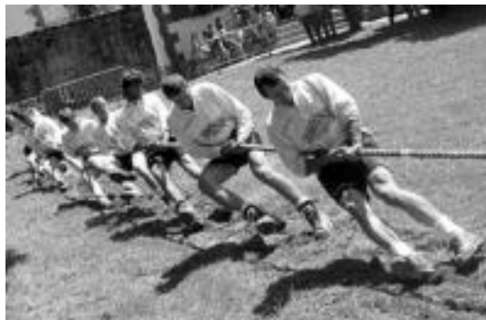
lazko Aresoko saioan, bertako taldea lanean. JAIONE ASTIBIA

Bihar jokatu dute Azpeitian 600eko hirugarren eta azken jardunaldia eta asteartean, berriz, 560ko bigarrena