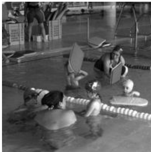
Etxeko txikiak igerian ikasten dute ikastaroetan. E. EZEIZA