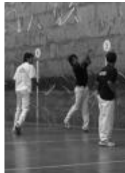
Txapelketako iazko irudia.

Txapelketa honetako beste edizioetan bezala, Adunako jaien baitan jokatuko dute finala. Aurtengoan abuztuaren 12an izango da, larunbata, eta 16:00etan hasiko dira pilota partidak.