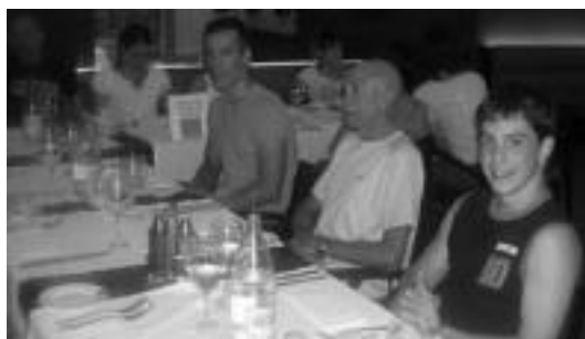
Sagastibeltza beste kirolari batzuekin. HITZA

Madriren, 16:30ean, 36 graduko temperaturarekin, hantxe lehiatu zen leitzar gaztea triatloieko hiru probetan. Igeriketa probarekin hasi ziren, herri hartako laku artifizial batean, hari bi itzuli emanez, 750 metro