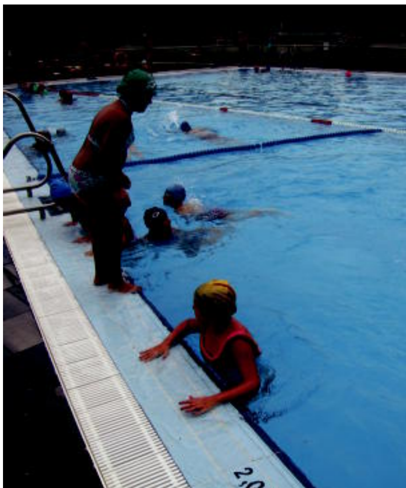
Udan erabiltzaile gehienek hautatzen dituzte kanpoko igerilekuak; ume asko joaten da. N. LATABURU

BAZKIDEAK ▶ 6.500 bazkide inguru ditu Usabalek; jarritako 5.000 laguneko helburua gainditu du ▶ 2,3