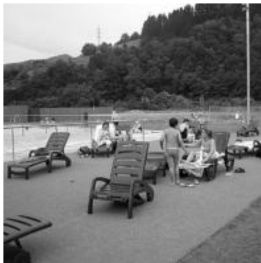
Hamaka leku aproposa da eguzkia hartu nagan dutenentzat. E. EZEIZA