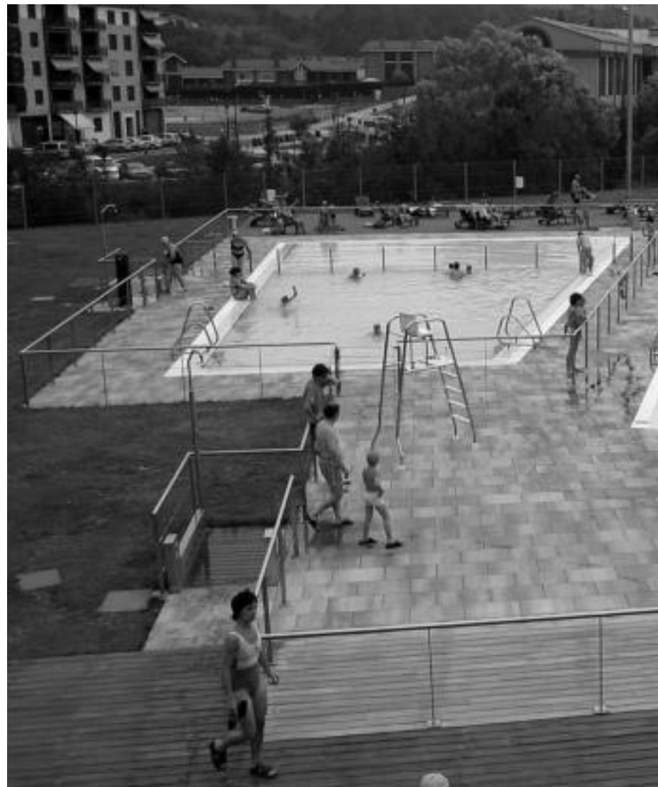
Usabalgo kanpoko bi igerilekuak beteta izaten dira; adin guztietako jendea biltzen da, sorosleen begiradapean. N. LATABURU