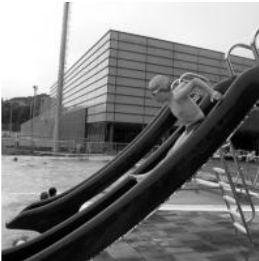
Gazteenentzat txirristak jolasgarriak izaten dira . N. LATABURU

«Oraindik urtebete ez du egin eta balorazioak ez ditugu egin, baina hobetzeko gauzak beti izaten dira». Hondartza ez baina, beraz, Tolosak badu, aurtengo udatik aurrera, egunotako beroari aurre egiteko irtenbidea. Kexak kexa eta oztopoak oztopo, milaka lagunek hautatu dute Tolosako igerilekua aisigune gisa.