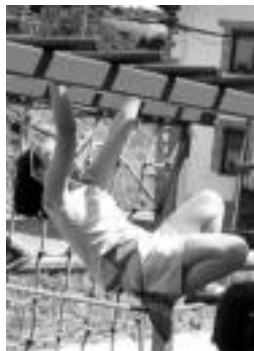
Aresoko ikasle batzuk errekreo garaian jostaketan. J. ASTIBIA

Azkenik, beraz, baieztatu da, oporraldia hasi aurretik Aresoko eskolan zalantzarikoa zen hirugarren irakaslearen afera.