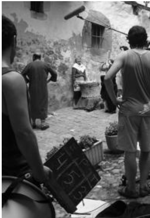
Segurar ugarik hartu zuen parte filmaketan.

Eneko Aritzaren Lagunak Filmagintza elkarteak, beraz, «Segura ikusgarri apaindua» zegoela aprobetxatu zuten bertan grabatzeko. Ibarren egina zuten hitzordua bertara joateko; goizean goizetik lanean hasi, eta bazkalordura bitarte prestaketa lanak burutzeko: