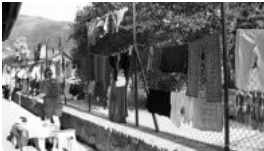
Arropak garbitu eta lehertzeko, zintzilik jarrita. E. EZEIZA

Loiolatik Jabiererako ibilbidea egitekoak dira hamabi egunetan