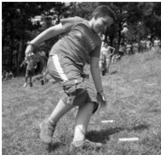
Gazteenak lokotxak biltzen jardun zuten. I. GARCIA