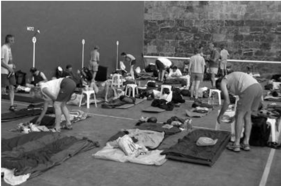
Pixkanaka Altzoko frontoira iristen joan ziren, eta bertan lo egiteko lekua prestatuta zuten. E. EZEIZA