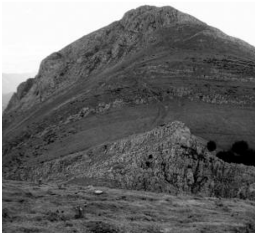
Txindoki inguruko hainbat herri daude Bozue Udaltalde 21en. Irudian, Txindoki mendia bera. HITZA

Udaltalde 21eko herrietan jasotako erantzunekin osatutako diagnostikoaren zirriborroak udazkenean aurkeztuko dituzte