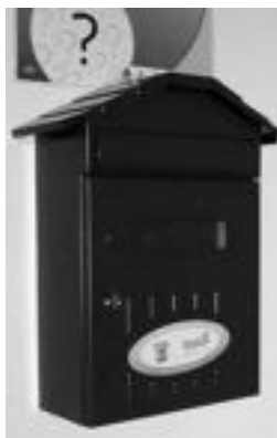
Abaltzisketako buzoia.