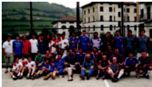
Futbolari guztiak, elkarrekin, lehia bukatutakoan. J. ASTIBIA