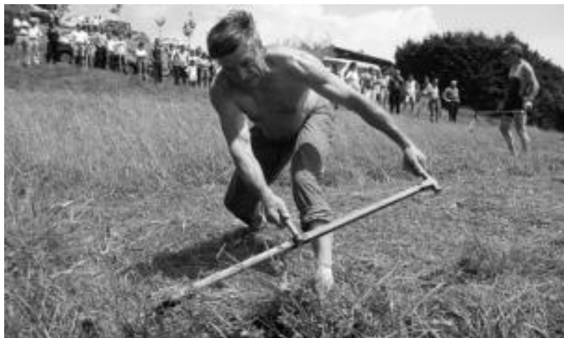
Segalariak erakustaldi bikaina eman zuten. I. GARCIA