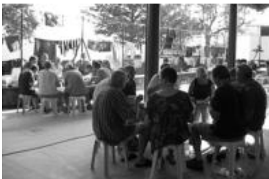
Afaltzeko garaian, taldetxoetan banatu ziren. E. EZEIZA

duak-eta prestatzeko. Hauek kamioi batean, ibiltariak baino lehenago iristen dira herrietara, eta hauek ailegaterako dena atonduta izaten dute.