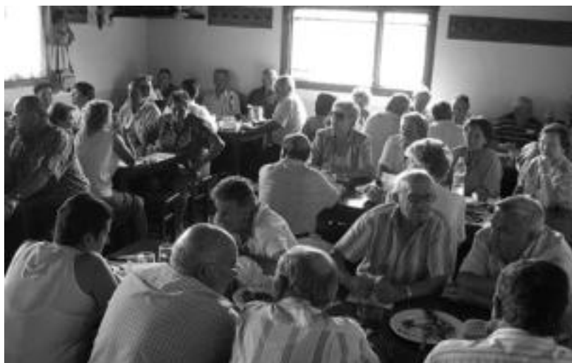
Hamaitetako egitera jende ugari bildu zen Santamañako elkartearen. I. GARCIA