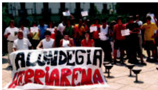
Prentsaurrekoa eskaini zuen Alondegiaren Aldeko Plataformak. J. ASTIBIA

Eraikina saldu eta han etxebizitzak egiteko Udalaren asmoa salatu du Alondegia-Udaletxe Zaharra Bizirik plataformak ▶ 6