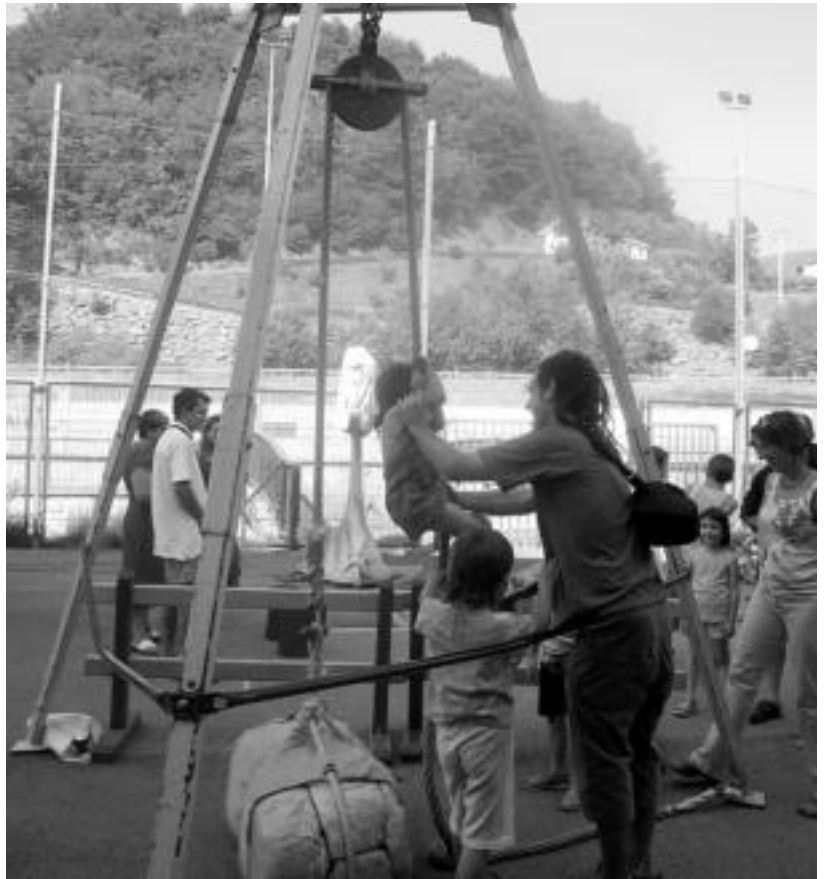
Umeak gustura ibili ziren atzo, Kulkutaldea antolatutako baserri jokoetan. E. EZEIZA

Eta esaerak dioen bezala, hasten den guztia amaitzen denez, gisa horretan, Alegiako jaiak ere joan dira. Atzo goizaldean, kalejira ibili ondoren, bere azkena iritsi zitzaion aurtengo txintxarriari. Modu honetan, eta Alegiako ereserkia atzetik zuela, alkateak txintxarria erretzeari ekin zion. Hala, eta San Fermin zaleek dioten bezala, alegiarrek ere 364 egun itxaron beharko dituzte datorren urteko jaiak arte.