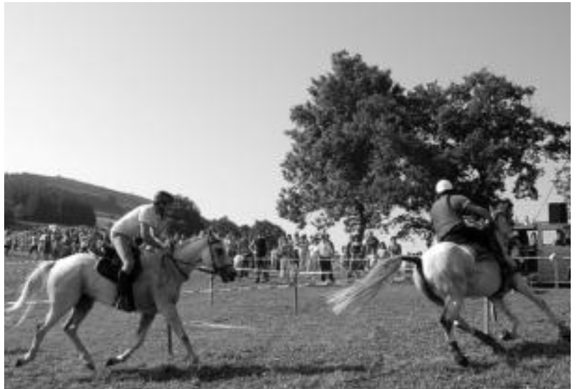
Zaldi lasterketak ikusmina sortu zuen, urtero bezala, eta proba ederra ikusi zuten bertaratuek. MADDI SOROA

Igandean egin ez zuten omenaldia egingo diete gaur Laja eta Landakanda trikitilarietara. Laja gaixo zegoen, eta horregatik atzeratu zuten ekitaldia. Ikusmin handia sortuko duena ere bailarakoen arteko herri kirolen lehia izango da.