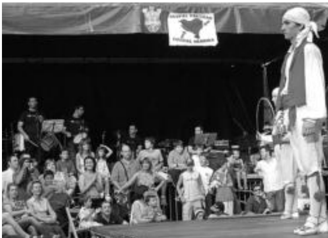
Jende ugari bildu zen, Oinkari dantza taldekoak igandean eskainitako emanaldian. M. S.