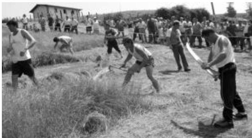
Bi segalariak eta ingurukoak lanean: aurrean Kanflanka eta atzeragoan Mariñelarena. JAIONE ASTIBIA

Bitartean, lantzarra mailaz maila alde handituz joan zen;