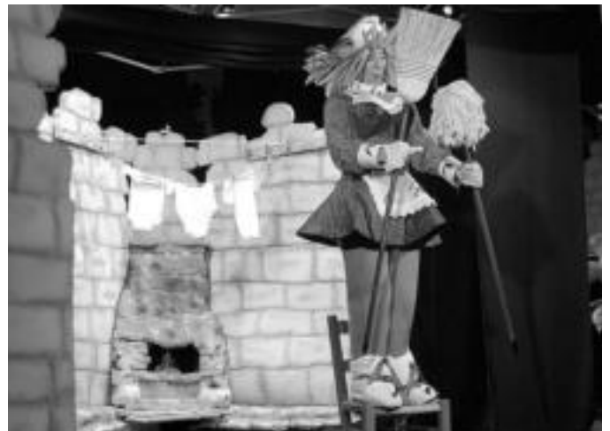
Gaztetxean izan zen Farsantes antzezlaneko irudietako bat. MADDI SOROA