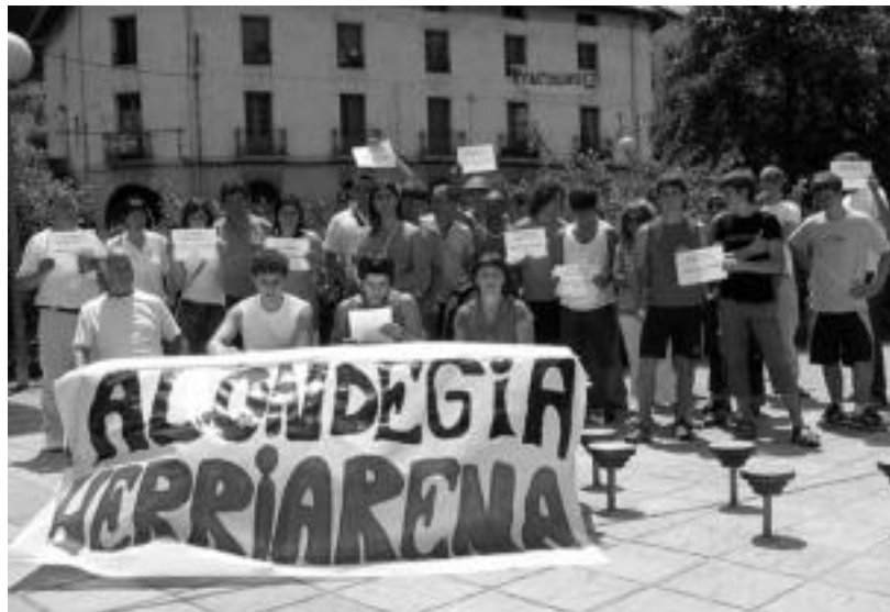
Alondegiaren Aldeko Plataformako kideak, iragan larunbatean eskaintako prentsaurrekoan. Atzean ikusten den eraikina da Alondegia. JAIONE ASTIBIA

Eraikina saldu eta bertan etxebizitzak egiteko Udalaren asmoa salatu dute, herriak eraikina behar duela esanez